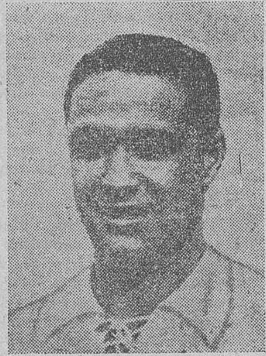
CAMPANAL Delantero centro del equipo sevillano

Barcelona.—La gran jornada deportiva que tuvo lugar en el campo de Montjuich, donde se disputó el partido final de la copa del Generalísimo, tuvo como preámbulo la celebración de un partido amistoso entre los equipos de Aviación Nacional y Recuperación de Levantas. Terminó este encuentro, con 3 a 2, a favor del equipo madrileño.