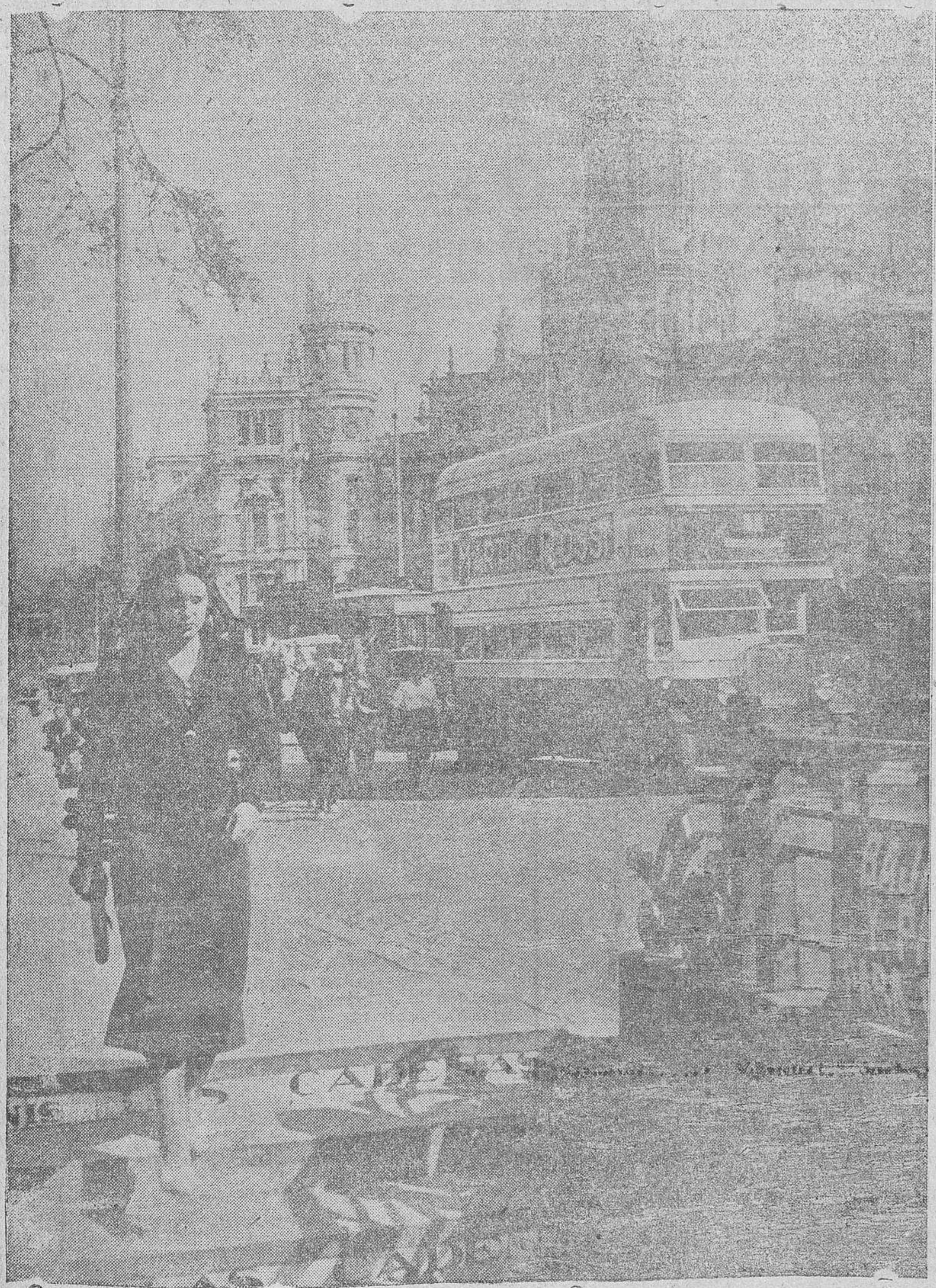
La calle de Alcalá, desembocando en la Plaza de la Cibeles. Al fondo, el Palacio de Comunicaciones

Pero sabemos a qué alienamos. Saben todos los españoles—lo sa-