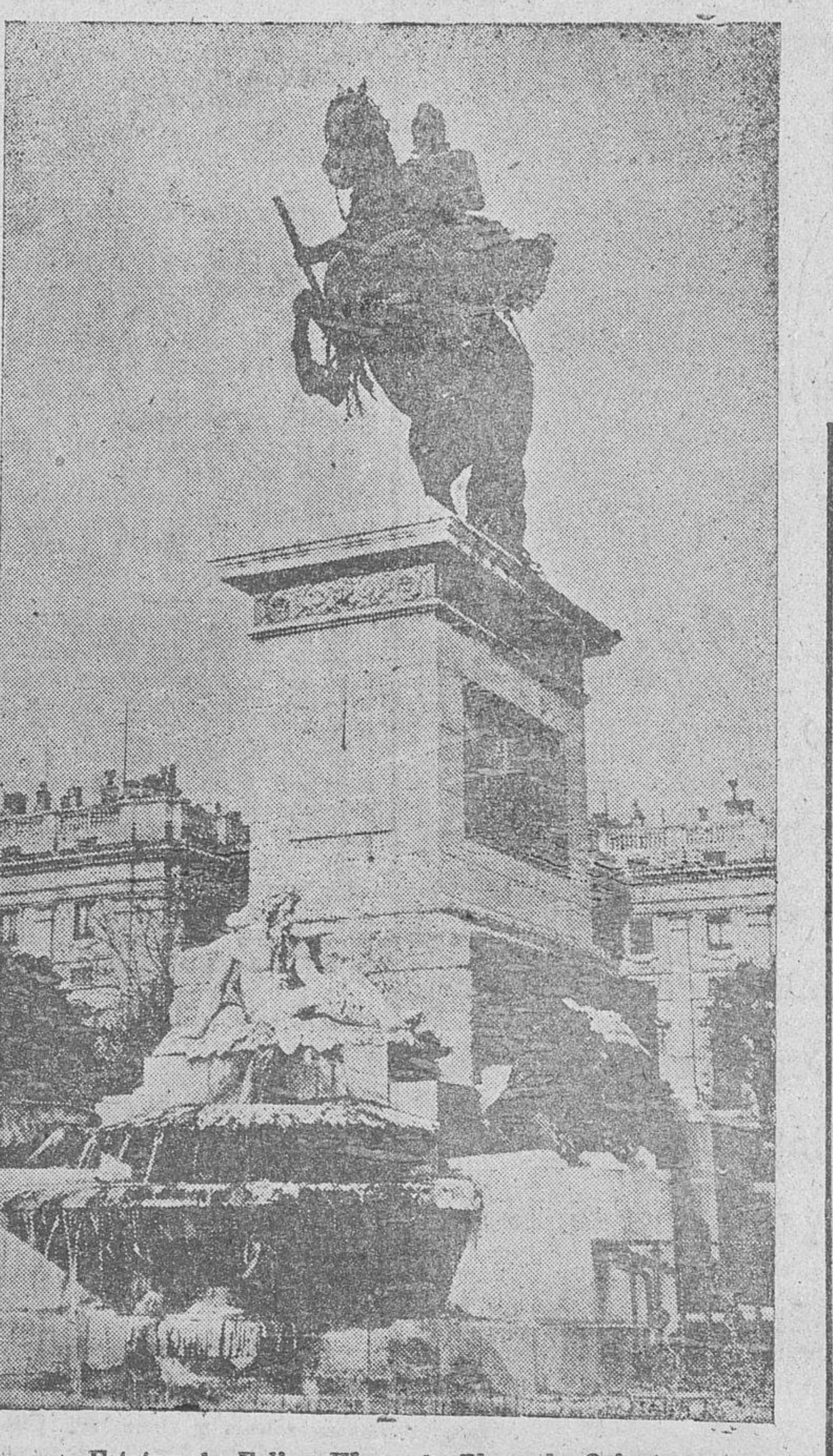
Estatua de Felipe IV, en la Plaza de Oriente

La Aviación Nacional presta constantemente sobre los alrededores de Madrid y sobre las calles. Los avia-