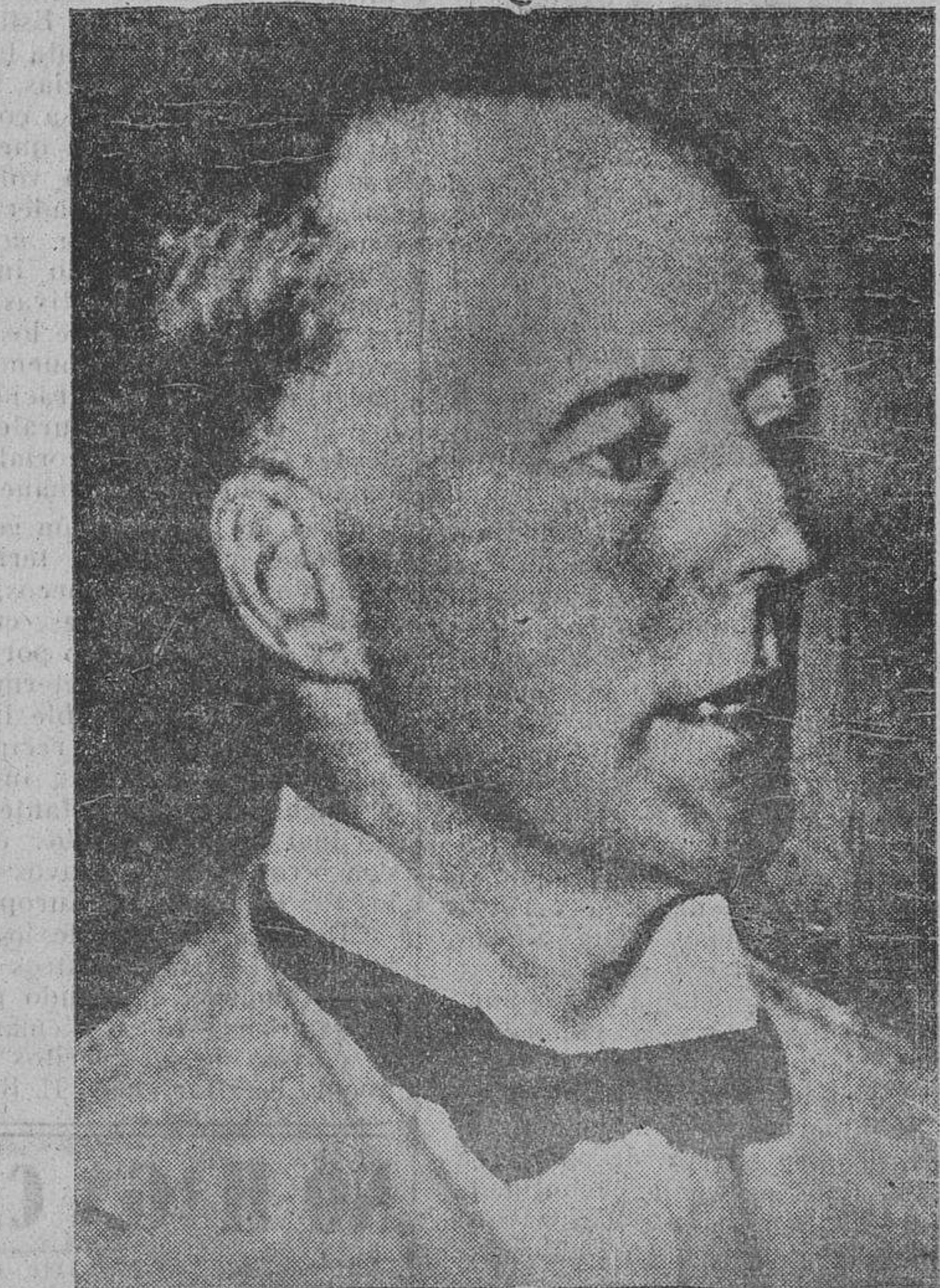
Lord Runciman, el hombre de confianza de los gobiernos inglés y francés, que actualmente se halla en Praga en concepto de consejero e intermediario para la solución de las cuestiones políticas de Checoslovaquia

madre; la plena libertad de culto queda asegurada y garantizada a las minorías, cuyos representantes podrán desempeñar cargos públicos, tanto del Estado como provinciales y municipales; en las ciudades donde el elemento minoritario constituya la mayoría el alcalde y el viceal-