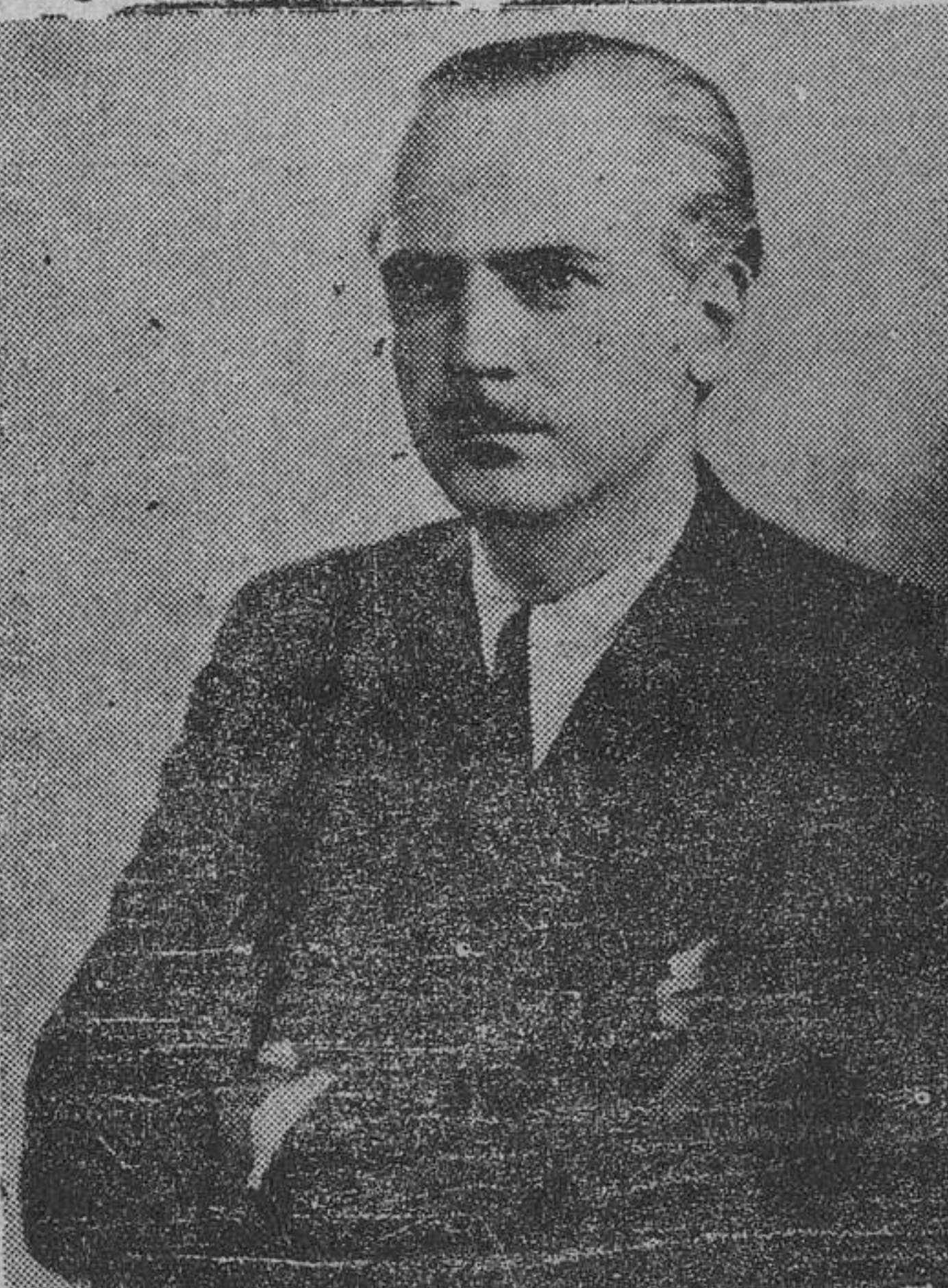
Excmo. Sr. D. Ramón Serrano Suñer Ministro del Interior