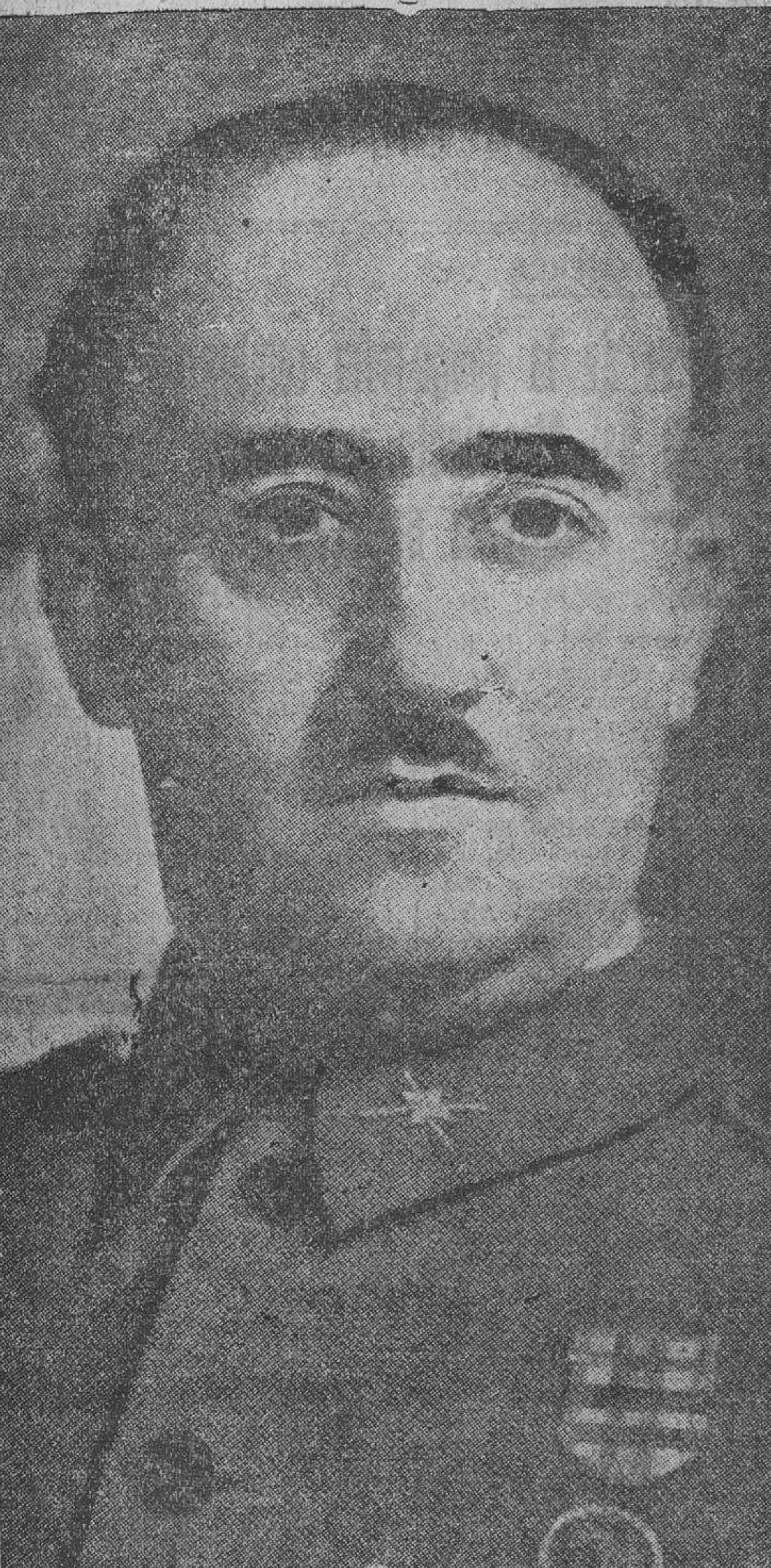
una cultura, gravemente amenazada por los principios rojos comunistas.

¡Franco, Capitán General, Caudillo victorioso! ¡Franco, Franco, Franco!