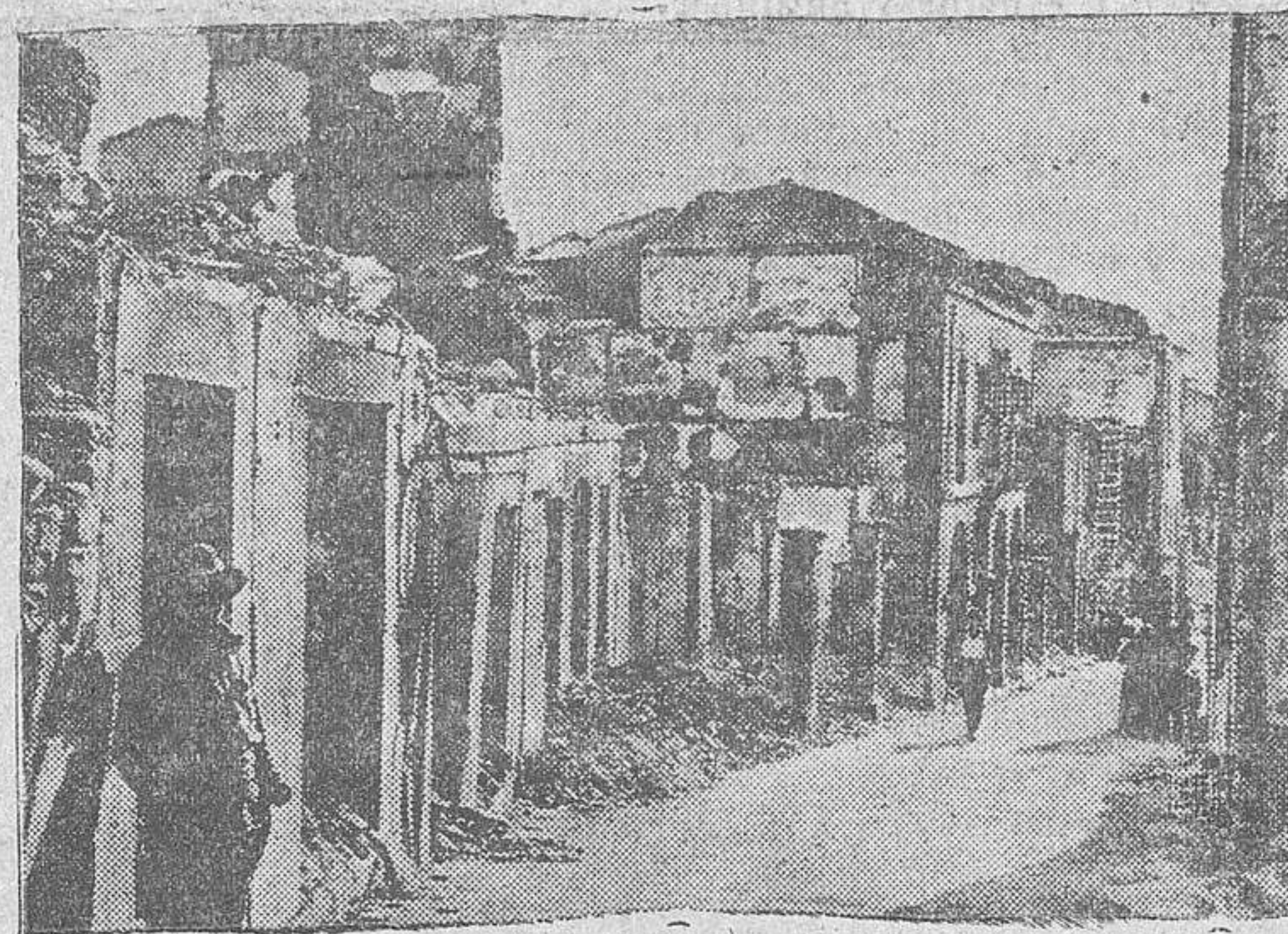
Potes, la villa mártir

La ruta de guerra, en fin, es un viaje de nueve días, hecho a lo largo de una región evocadora, la más agradable de España durante los meses de verano.