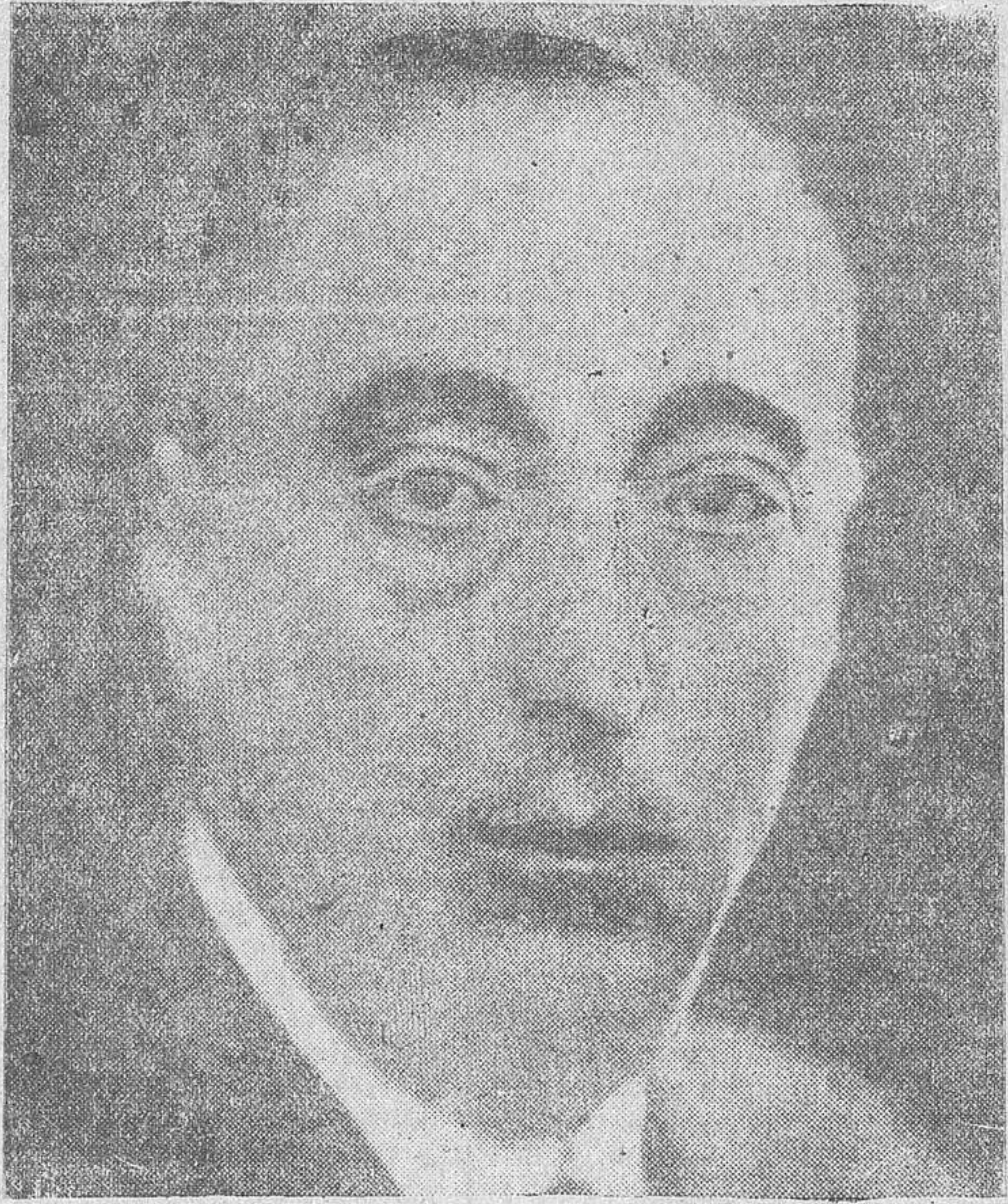
Excelentísimo señor conde de Rodezno ministro de Justicia

El general Franco—nosotros lo vimos—lloró emocionado a