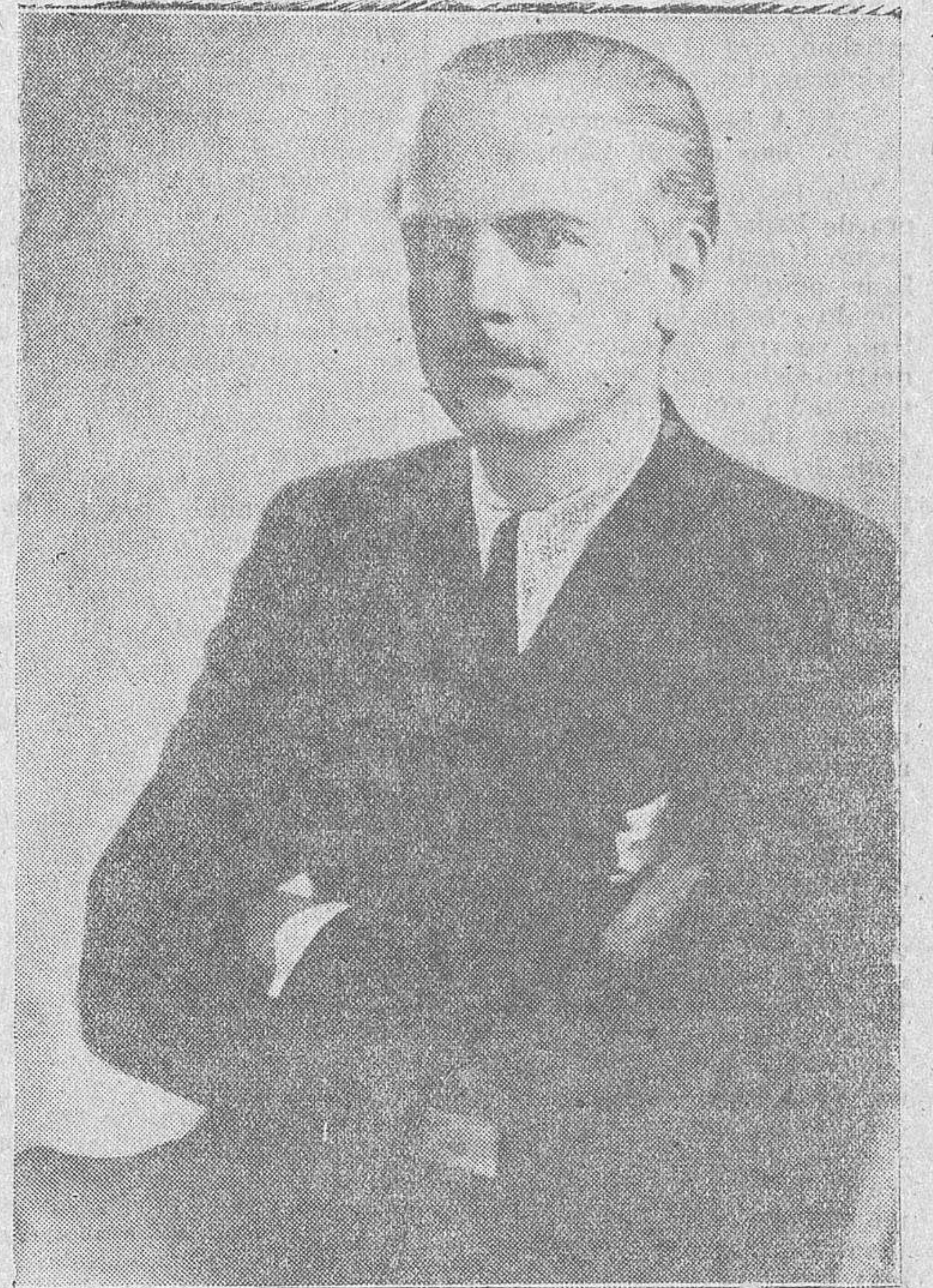
Excelentísimo señor don Ramón Serrano Suñer, ministro Interior, Prensa y Propaganda

de la tarde, llega el excelentísimo señor ministro de Defensa y general jefe del Ejército del Norte, don Fidel Dávila, acompañado por el general López Pinto. Se le dispensa una acogida triunfal. Todas las personalidades se dirigen al Puente de San Antón. Hizo la ofrenda del puente el conde de Superunda.