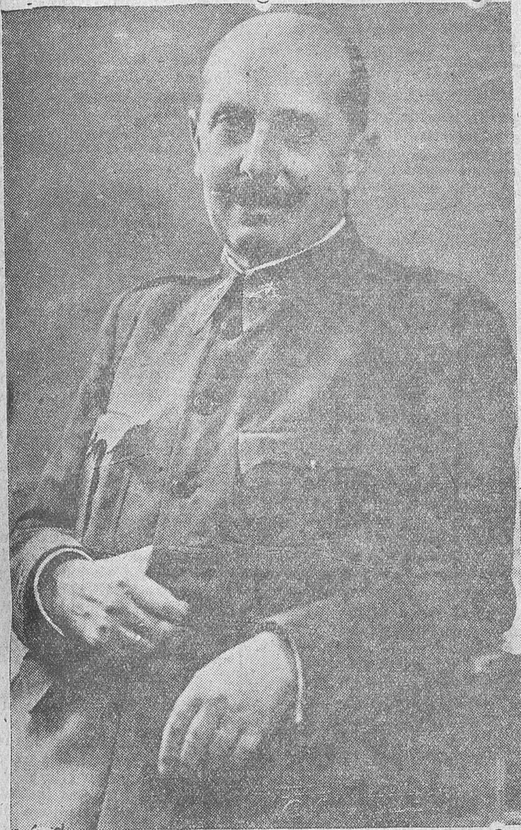
Excelentísimo señor don Fidel Dávila, ministro de Defensa Nacional