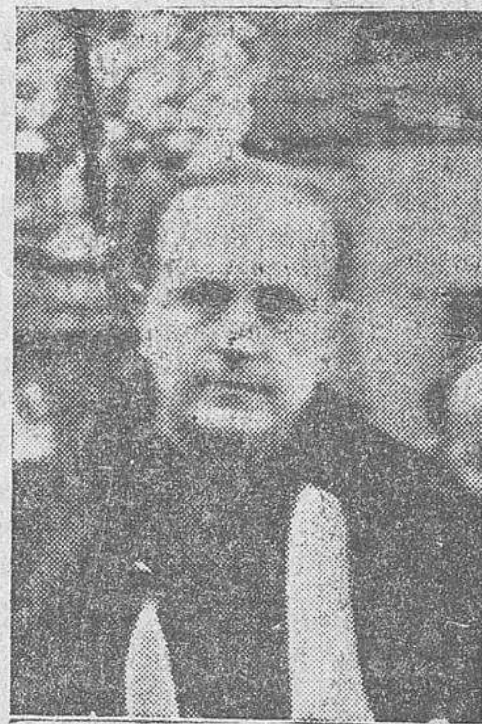
Raimundo Fernández Cuesta

rrecoos, cuando la escuadra, traicionándonos, impedía el paso de las fuerzas legionarias. Un hombre que, victoriosa tras victoriosa, ha puesto a flote los afanes de la juventud nacional; un hombre insigne al que el destino había puesto en la Jefatura del Estado. Y este hombre,