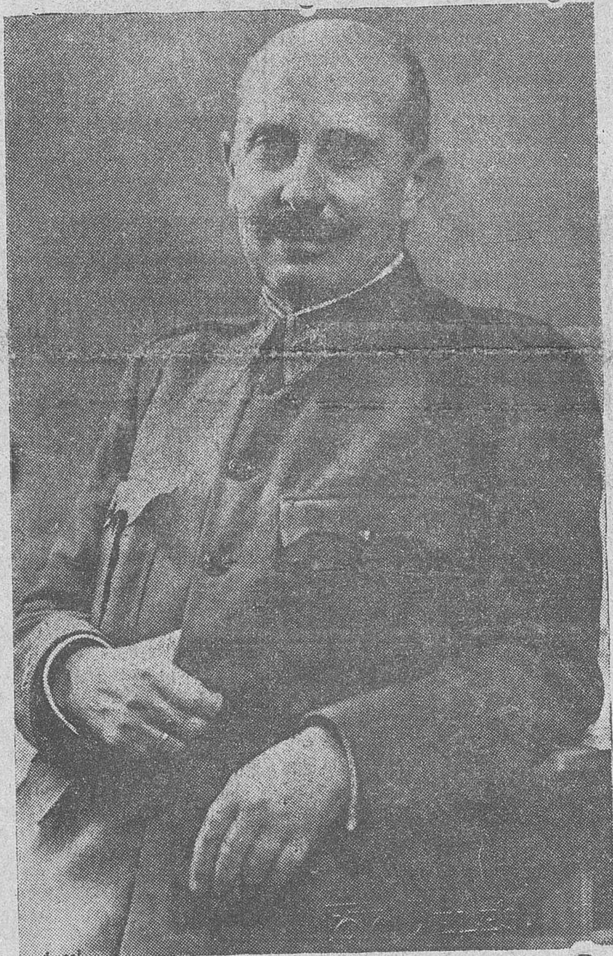
El excelentísimo señor don Fidel Dávila, ministro de Defensa Nacional y general jefe del Ejército del Norte