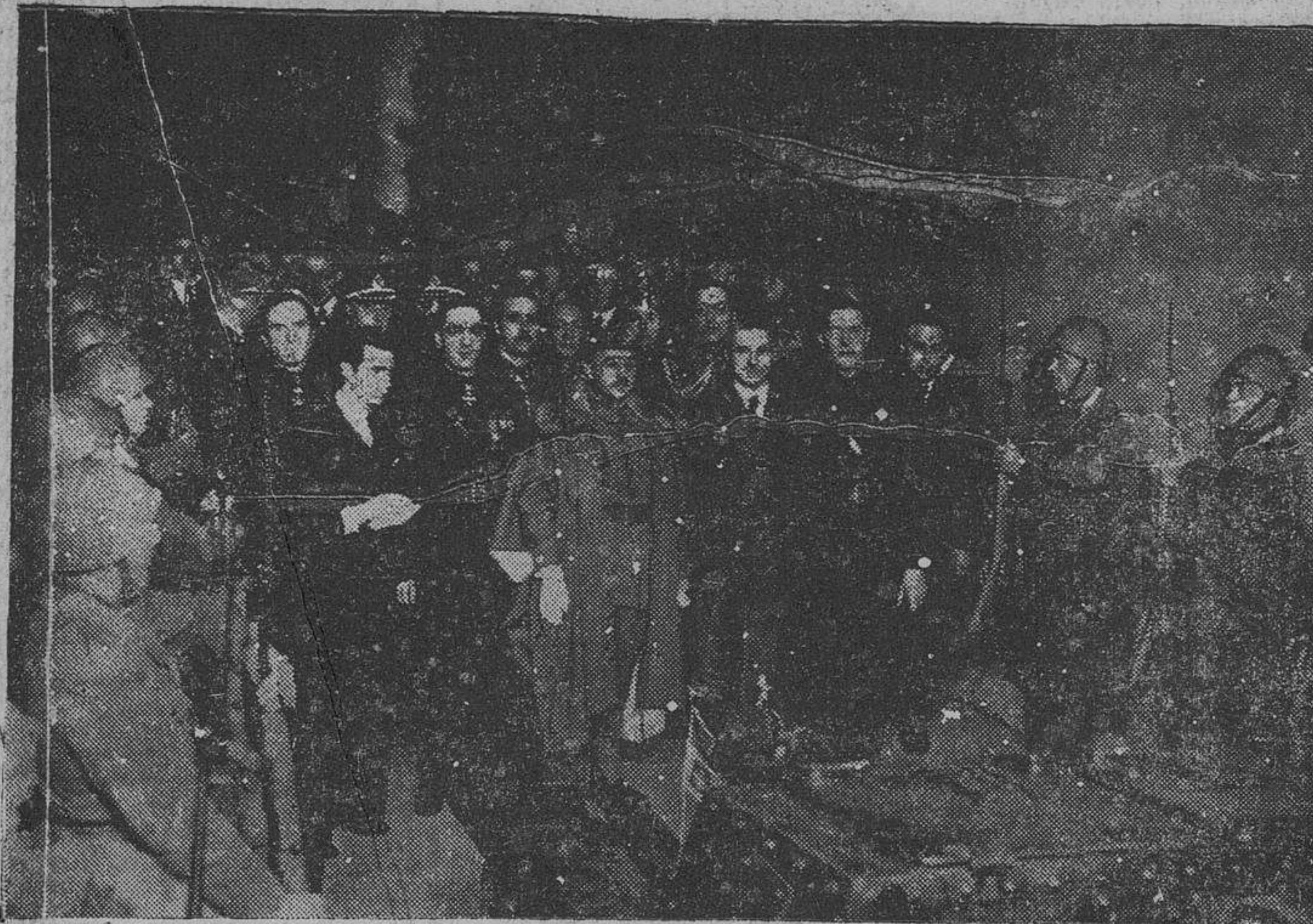
Su Excelencia el Generalísimo Franco entre el excelentísimo señor Encargado de Negocios de Italia y el Jefe de la Oficina Italiana de Prensa al entrar en el teatro Coliseum, para asistir a la fiesta del domingo

Al final de la magnífica velada, el público dió entusiastas vivas a Italia, Alemania, Portugal, España, a Mussolini, Hitler y Franco, haciendo objeto a los representantes de las naciones amigas de cariñosos homenajes de simpatía en el momento de abandonar la sala. Al salir el Generalísimo, el público, estacionado en la Plaza Mayor, le saludó con el grito de ¡Franco, Franco, Franco!, prueba de la adhesión fervorosa de Salamanca, que representaba a toda la España nacional.