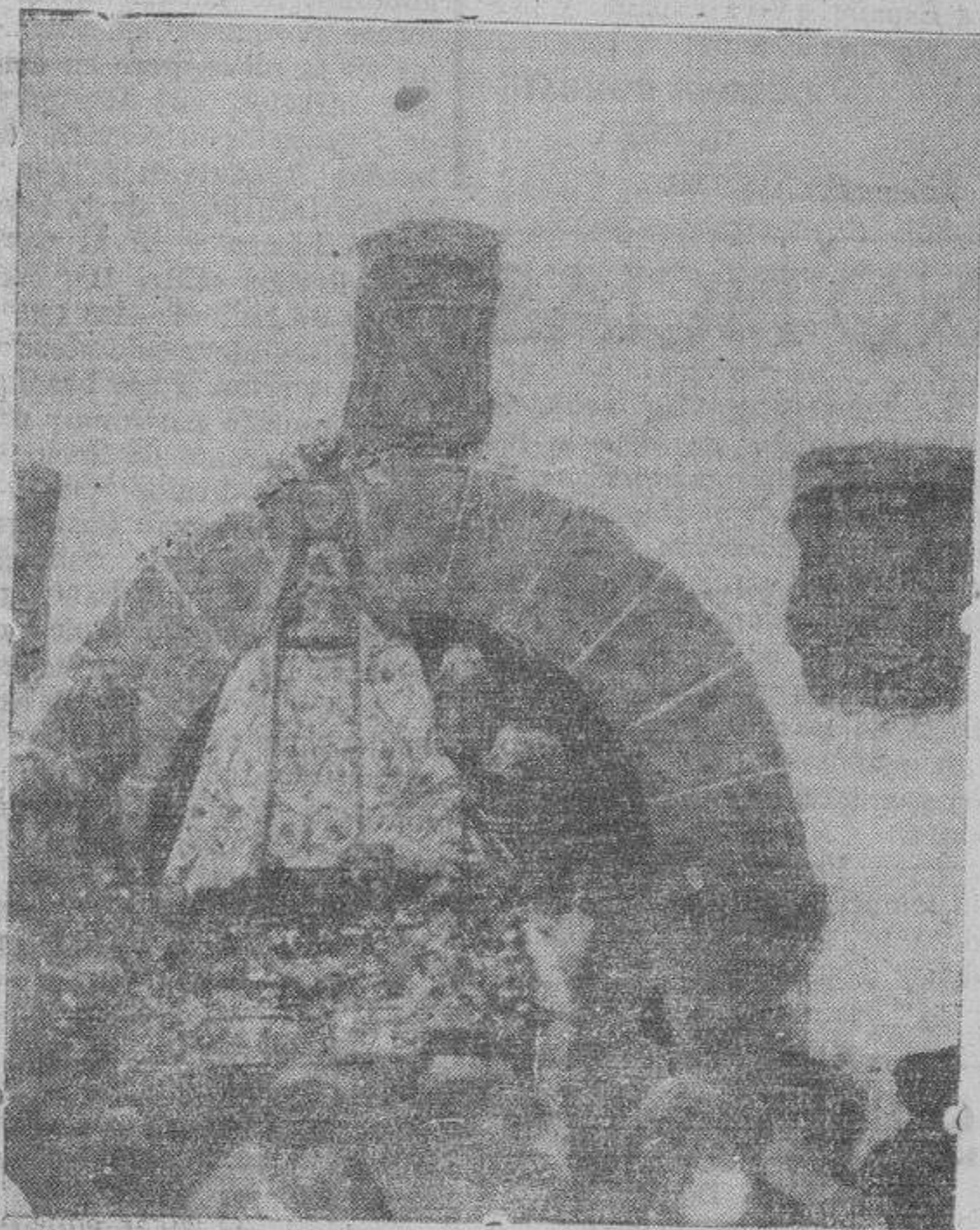
Traslado procesional de la Santísima Virgen del Castañar

las circunstancias, señalando la empresa estéril de los que tratan y tratan de arrancar violentamente la fe del corazón humano y particularmente de los españoles que supieron realizar tantas y tan inmortales gestas en defensa de sus creencias. Al finalizar el encendido sermón dió el predicador vivas a España, a las mil-