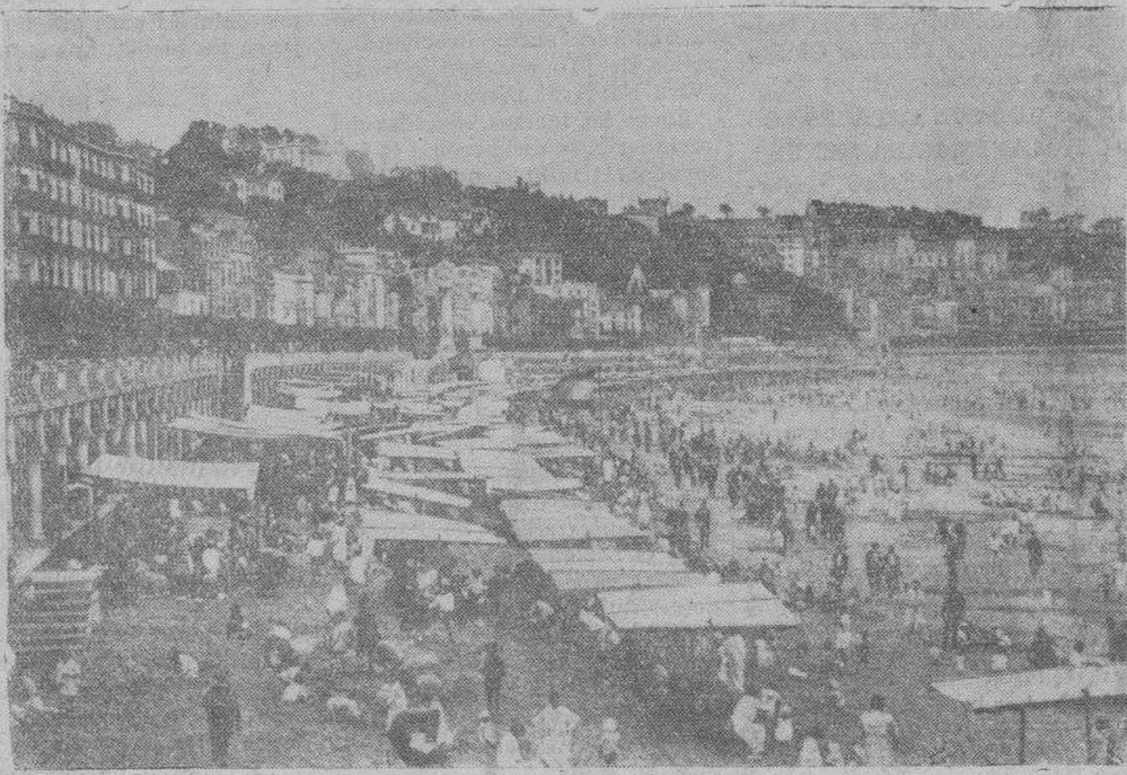
Una vista de San Sebastián, la bella ciudad del Cantábrico, que tomaron el domingo las heroicas tropas del Ejército Nacional