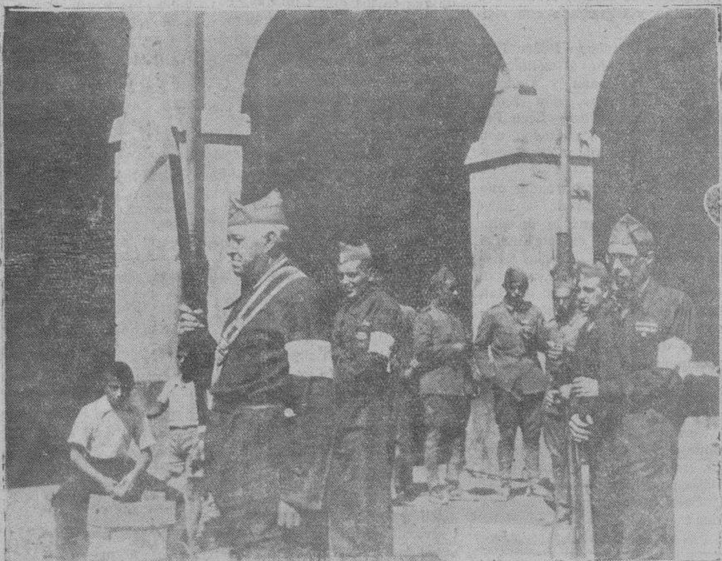
La nueva Bandera de la Guardia Civil que hizo su primera salida el domingo último.

La Discreta, Salud, 6. Madrid. Catálogo gratis, sin enviar sello