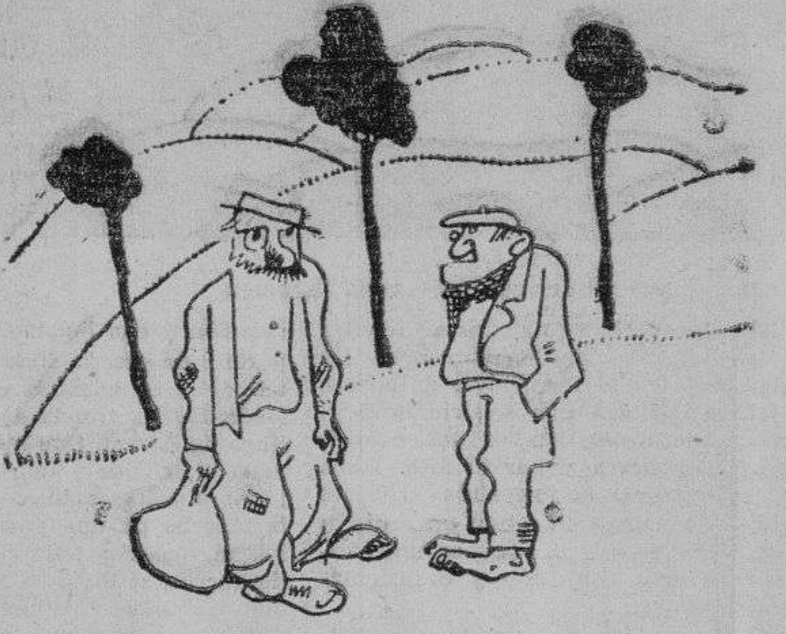
DOS IGUALES —Soy un obrero parado. —Como yo. —Que no encuentra trabajo. —Como yo. —Y que me me estaría atrozmente cambiar de ocupación. —Como a mí. (Gringoire)