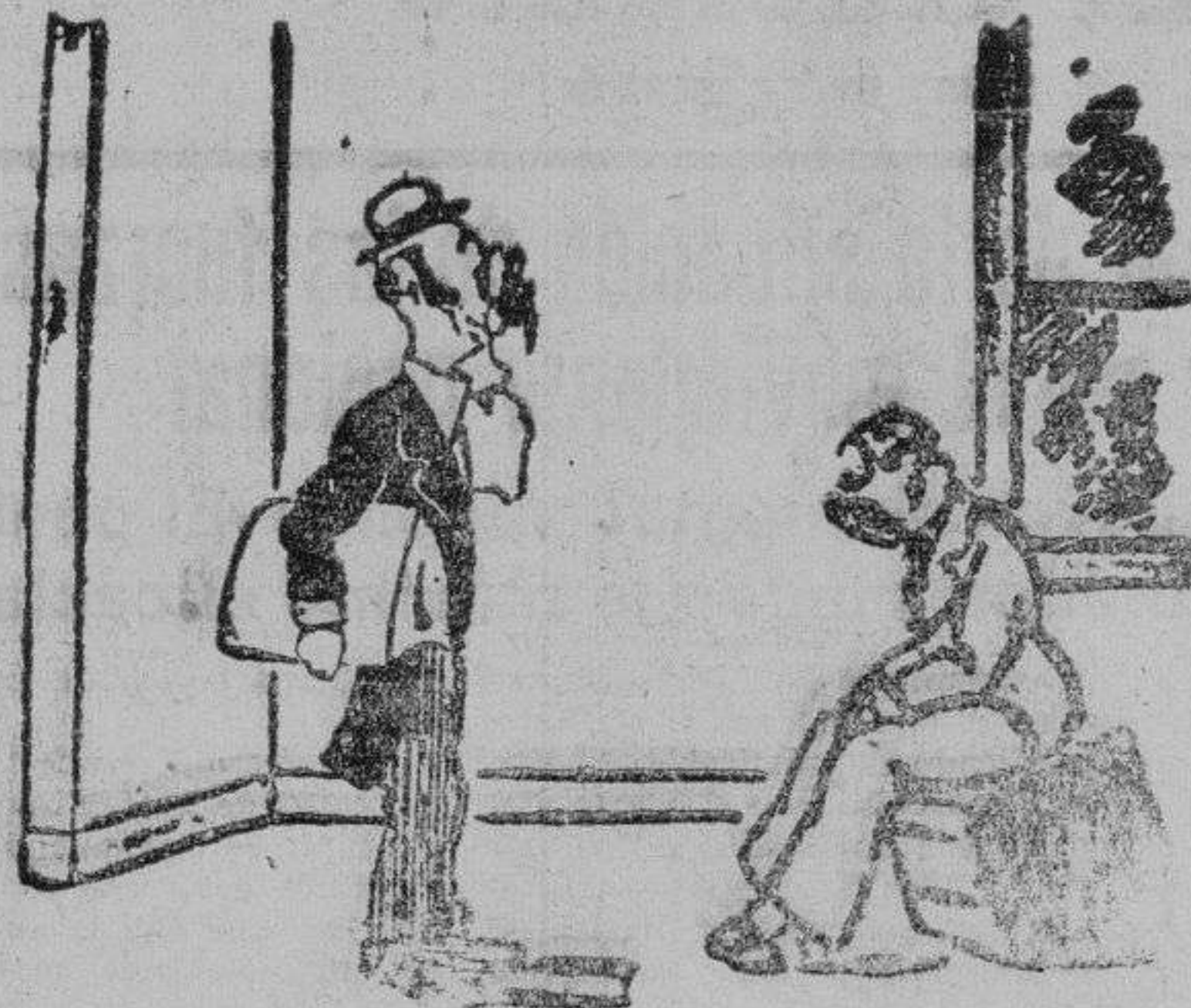
—Conseguí del Jurado veredicto de inculpabilidad. Es usted ya libre. —No, señor abogado. Ahora empieza un nuevo encadenamiento para mí. He de cumplir una palabra de casamiento. (Humor)