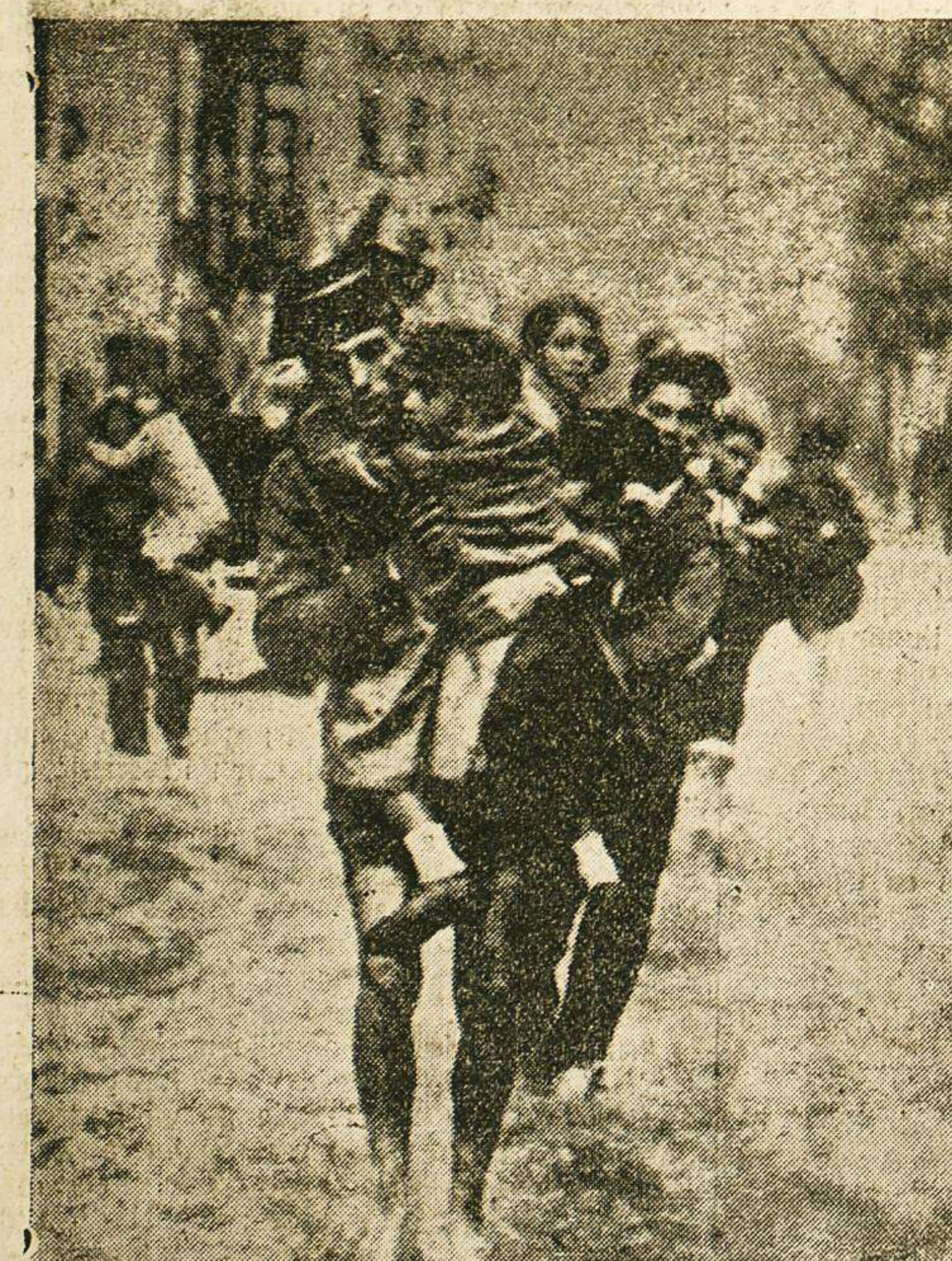
En las Arenas (Bilbao) han ocurrido sensibles inundaciones. He aquí un momento en el que la Guardia civil y los vecinos auxilian a las mujeres y niños