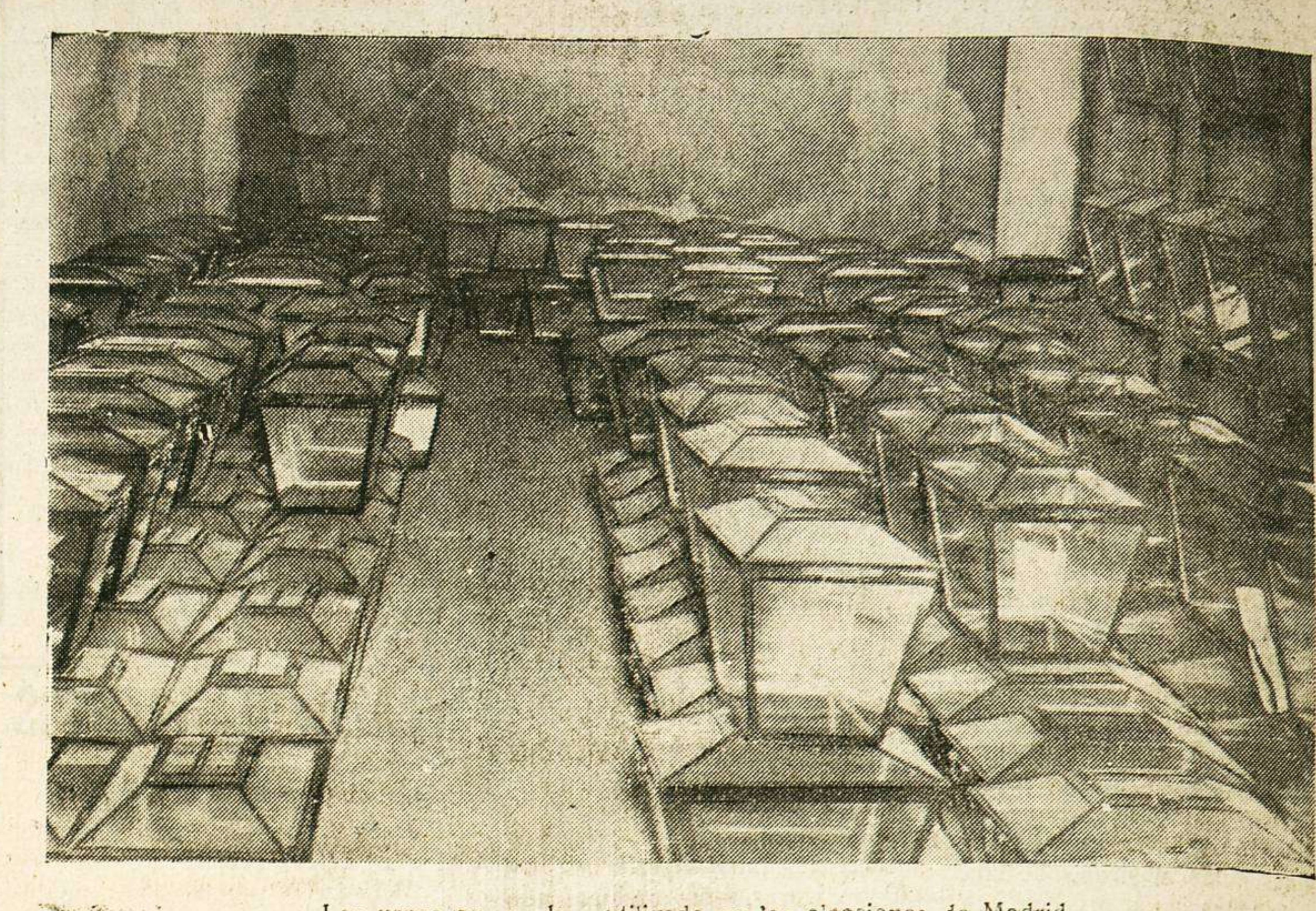
Las urnas que se han utilizado en las elecciones de Madrid (Foto Rico).

DUENOS DE AUTOMOVILES, tractores motores de aceite pesado. En Talleres Rafols se rectifican los bloques a la máxima perfección y encontraréis de todas medidas, camisas y pistones en hierro y aluminio. Pedid presupuestos gratis. Plaza de Santa Brígida, 7. Teléfono 1704, Valladolid.