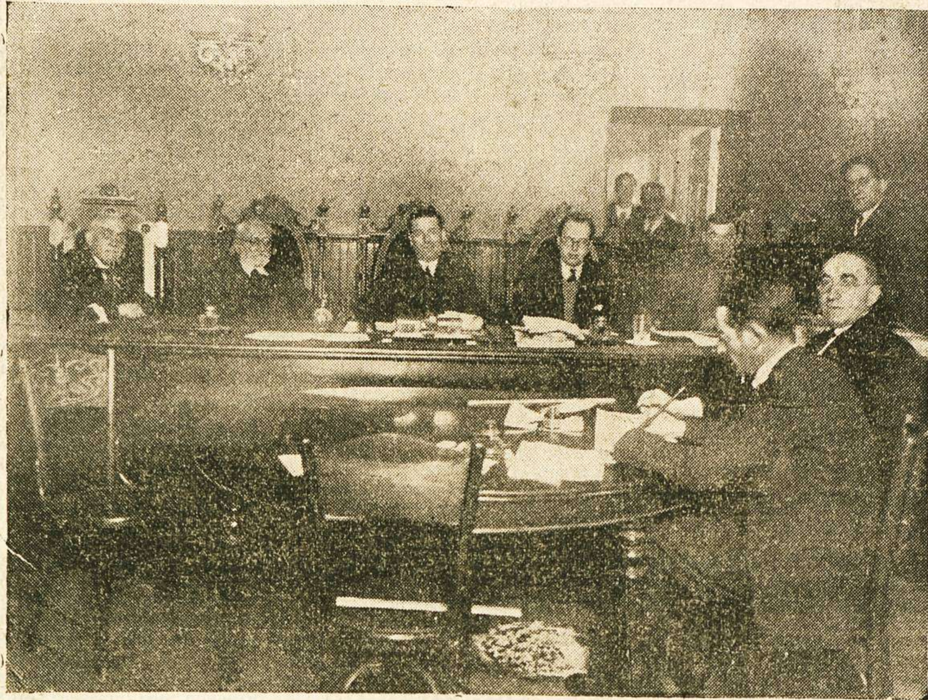
La presidencia de la Junta del Censo