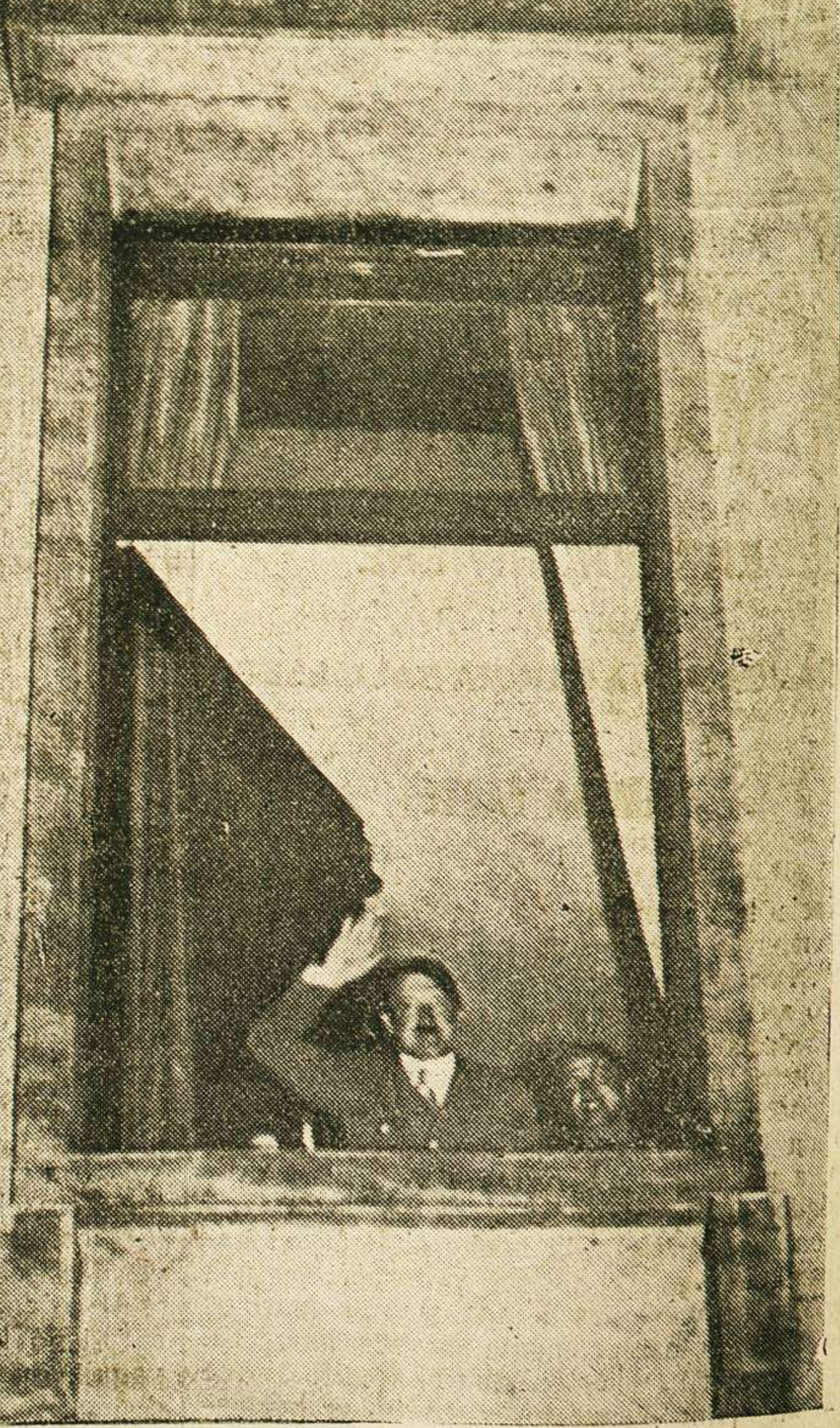
El domingo por la tarde y el lunes, una multitud enorme ha desfilaro por el despacho de la Cancillería de Berlín, para aclamar a Hitler por el resultado del plebiscito. Este corresponde a dichas aclamaciones saludando desde una ventana de su despacho.