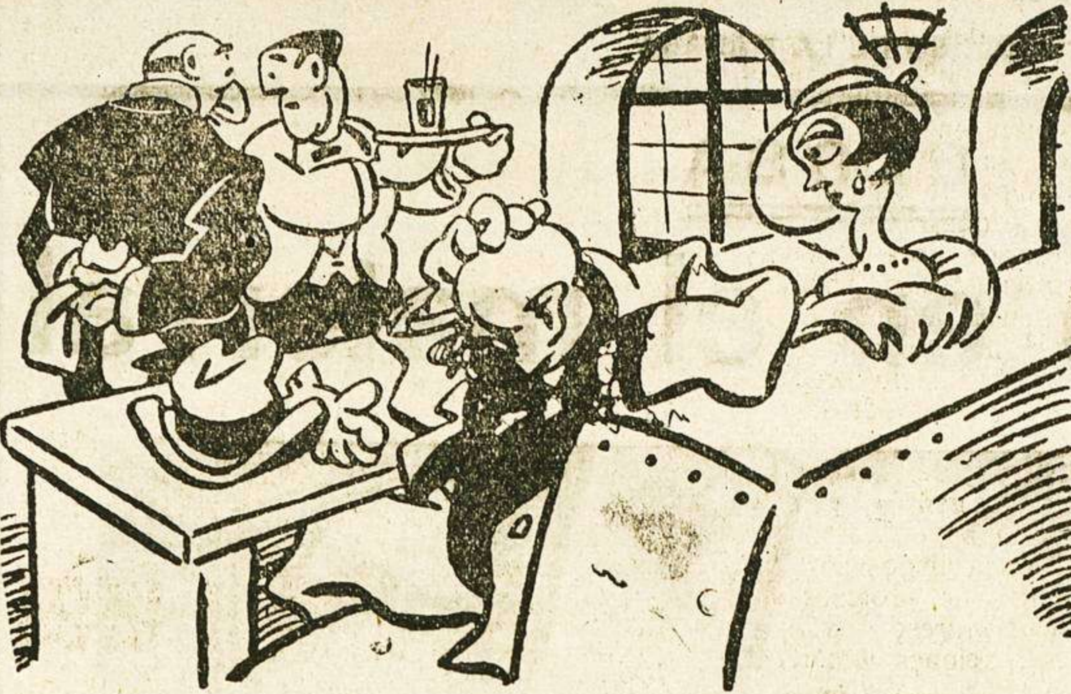
—¡Camarero! A este señor hágale pagar su consumición antes de servirle. Le conozco bien. Bebe para olvidar.