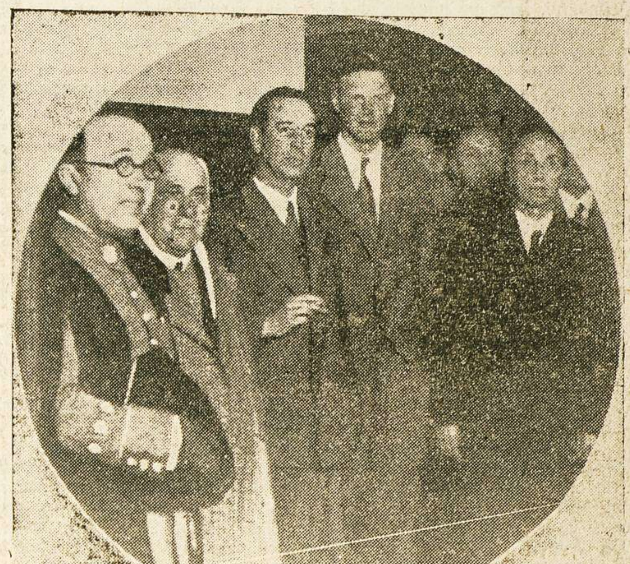
El famoso aviador Lindbergh con las autoridades de Santoña que acudieron a saludarle

Acaso, sólo Don Fili, el invencible, sea el candidato que mejor conserva sus "facultades", porque Don Fili no hace discursos, sino charlas amigas, en torno de unos cuantos "fieles" de su causa bienhechora y evangelizadora. Don Fili dá mucho que hacer a la máquina de escribir, y al cartero rural, y al telégrafo y al teléfono; pero su vida se desliza tranquila, casi normal, entre la clínica, la oficina burocrática de la Caja de Previsión, y el viaje apacible en la hora agradable de la digestión del almuerzo. Pero los demás candidatos están hechos una pena. ¡Pobrecillos! Dan la sensación de uno de esos encuentros de boxeo en el que los contendientes, agotados, malfrechos, se tambalean y apenas pueden levantar los brazos. El pobre candidato, en este apogeo de la lucha, es la víctima anticipada de la contienda. El triunfo le remediará el mal. Pero ¿y el que fracase? ¿Qué recompensa va a tener el pobre? Yo, la verdad; no quisiera encontrarme en el pellejo, en esos felices ratos de la charla íntima de la familia, puesta a comentar la derrota... — Un Repórter.