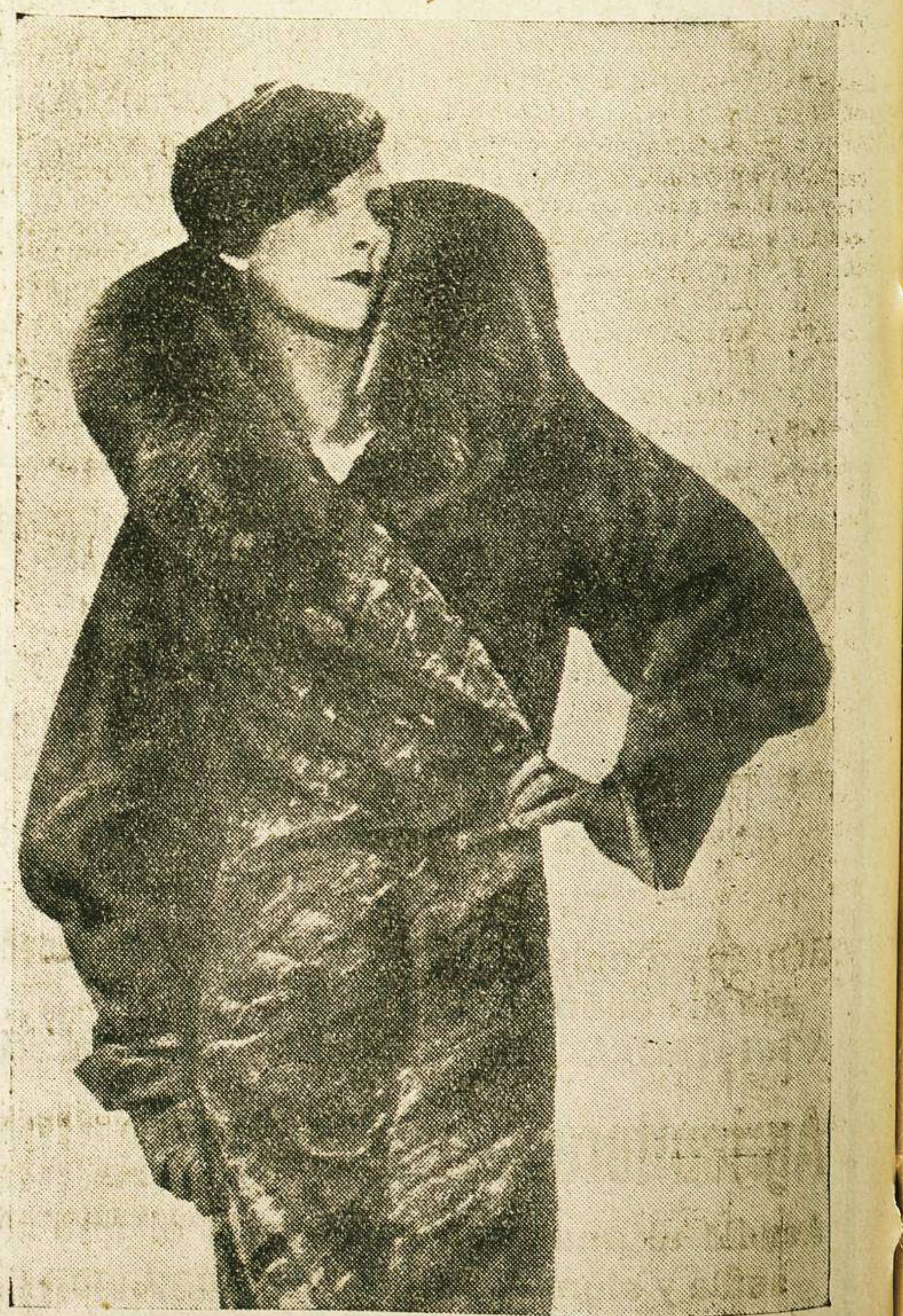
Abriego de piel de armiño, teñido en marrón, con cuello de piel de zorra.

Les deseamos grandes éxitos en todas sus actuaciones.