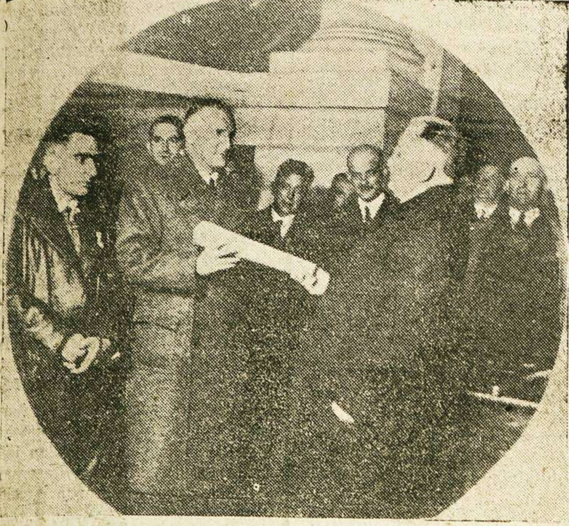
El alcalde de San Sebastián al serle entregadas las actas de las elecciones en pro del Estatuto Vasco

tos ideales cuando permanecen en el mundo de las abstracciones puras, sin cristalizar en actos humanitarios, en disciplinas de fraternidad y de justicia. Así, en el orden moral, no es cristiano el que predica las doctrinas de Cristo, ni aun que en ellas cree, sino el que las vive y practica, devolviendo bien por mal, amando a sus enemigos, perdonando a los que le ofenden y orando por los que le persiguen.