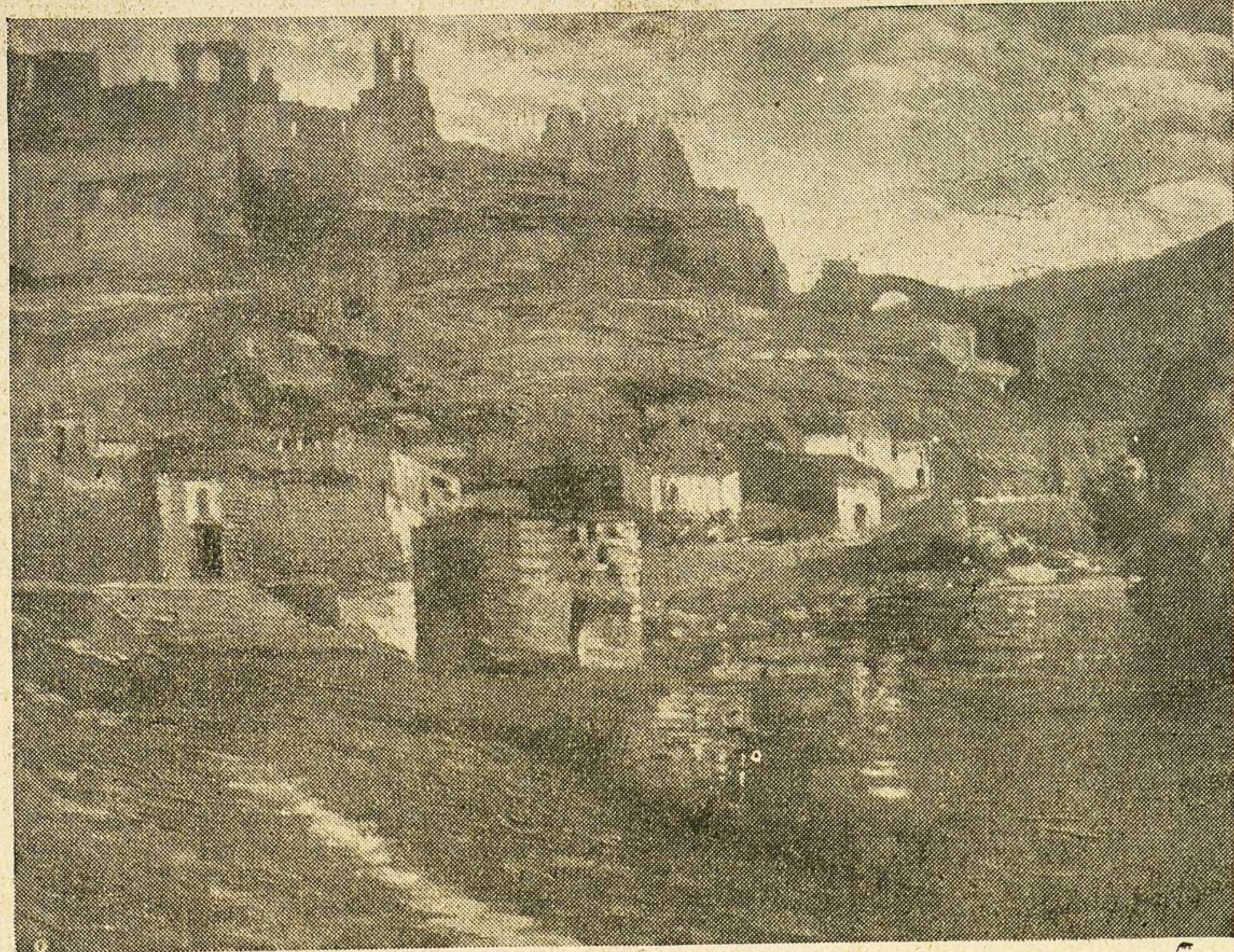
«Castillo de Zorita de los Canes», uno de los bellos paisajes que exhibe actualmente Félix Herraez en el madrileño Círculo de Bellas Artes

Se inaugura en Madrid la temporada de exposiciones personales, en el Círculo de Bellas Artes, con una de Félix Herraez.