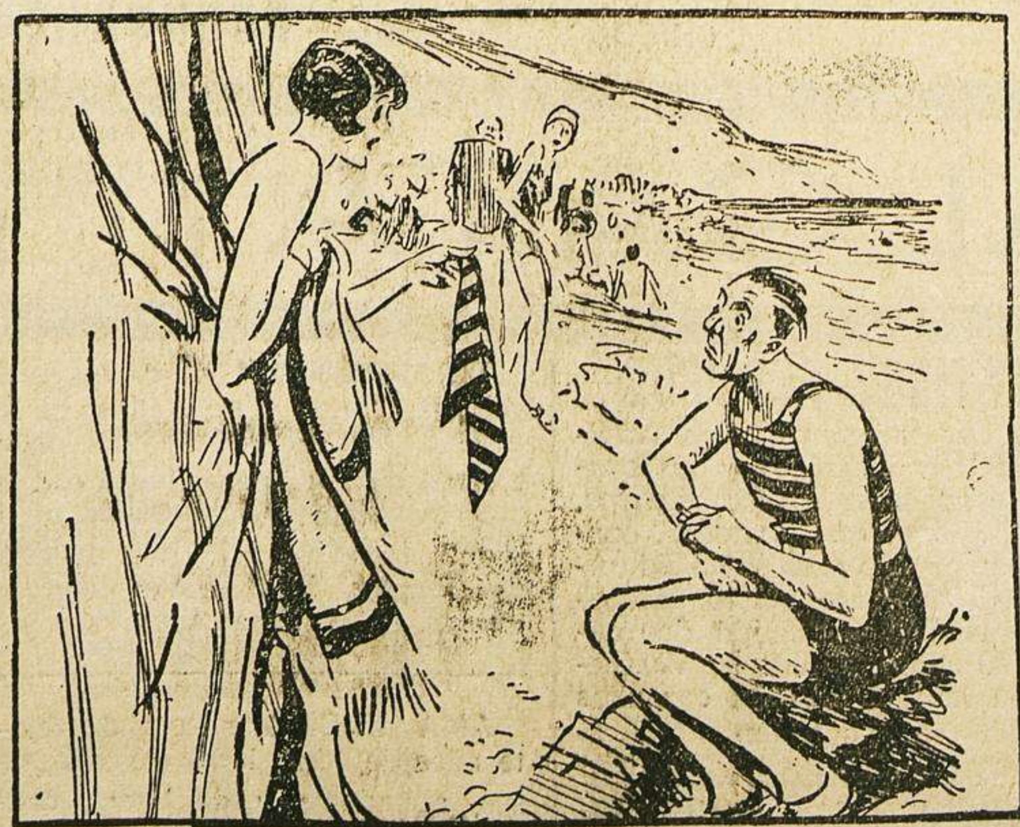
—Ella.—Oh, Jonge, cómo eres tan distraído! Me has metido una de tus corbatas en lugar de mi maillot de baño.

Se hizo igualmente labor eficazísima para la resolución de otros proyectos de obras de la provincia, siendo de señalar especialmente que la carretera de Encina de Abajo a Cantalapiedra, está informada favorablemente su inclusión en el plan general. La carretera de Valdecarras a Anaya de Alba, será subastada con cargo al primer trimestre del presupuesto de 1934 y la Sección de Anaya de Alba a la presa del pantano de La Maya, la tiene ya en estudio la Mancomunidad del Duero,