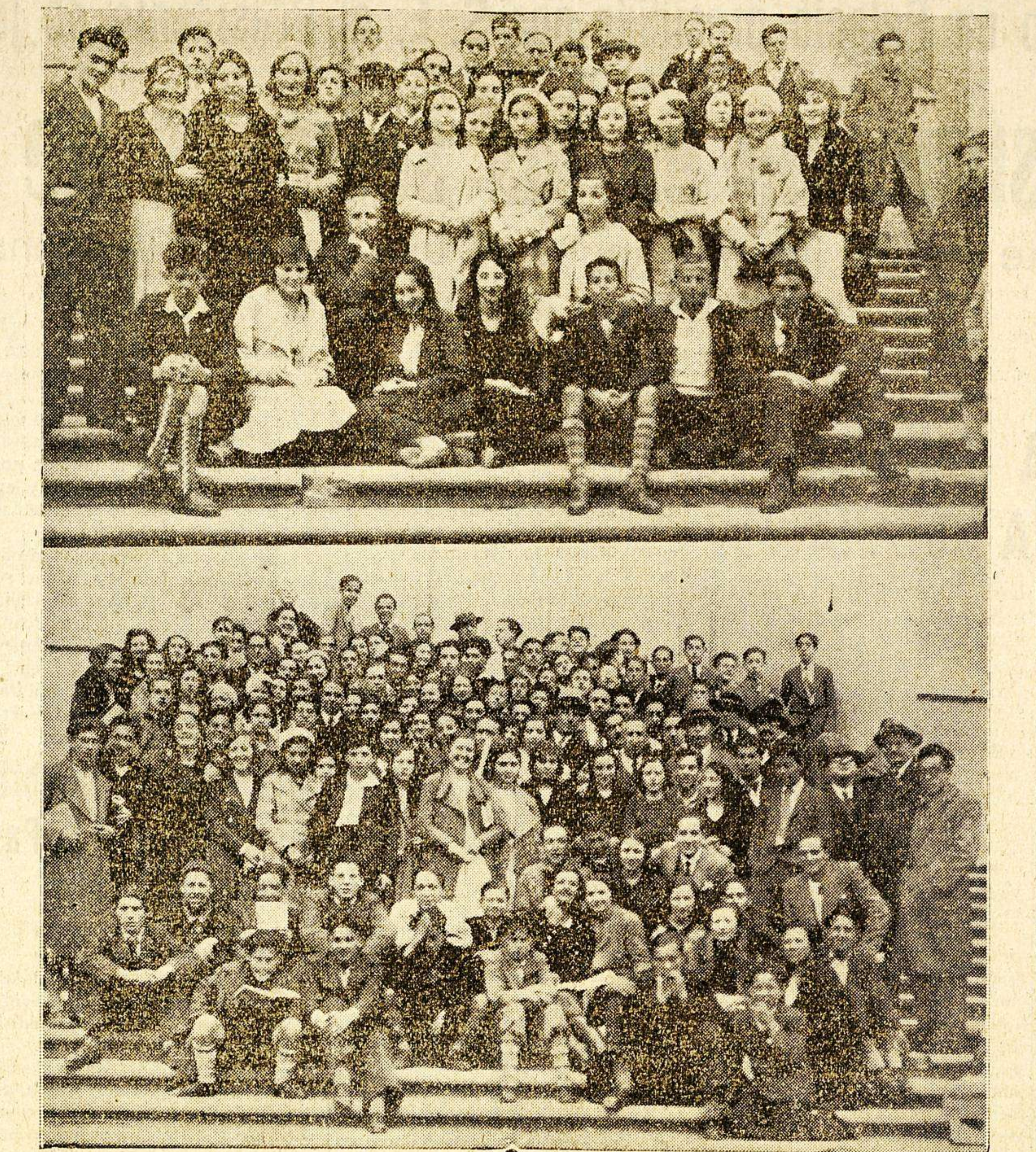
Parte superior: Los escolares del Instituto de Segovia con sus profesores... Parte inferior: Los escolares del Instituto de Segovia con sus compañeras del de Salamanca...