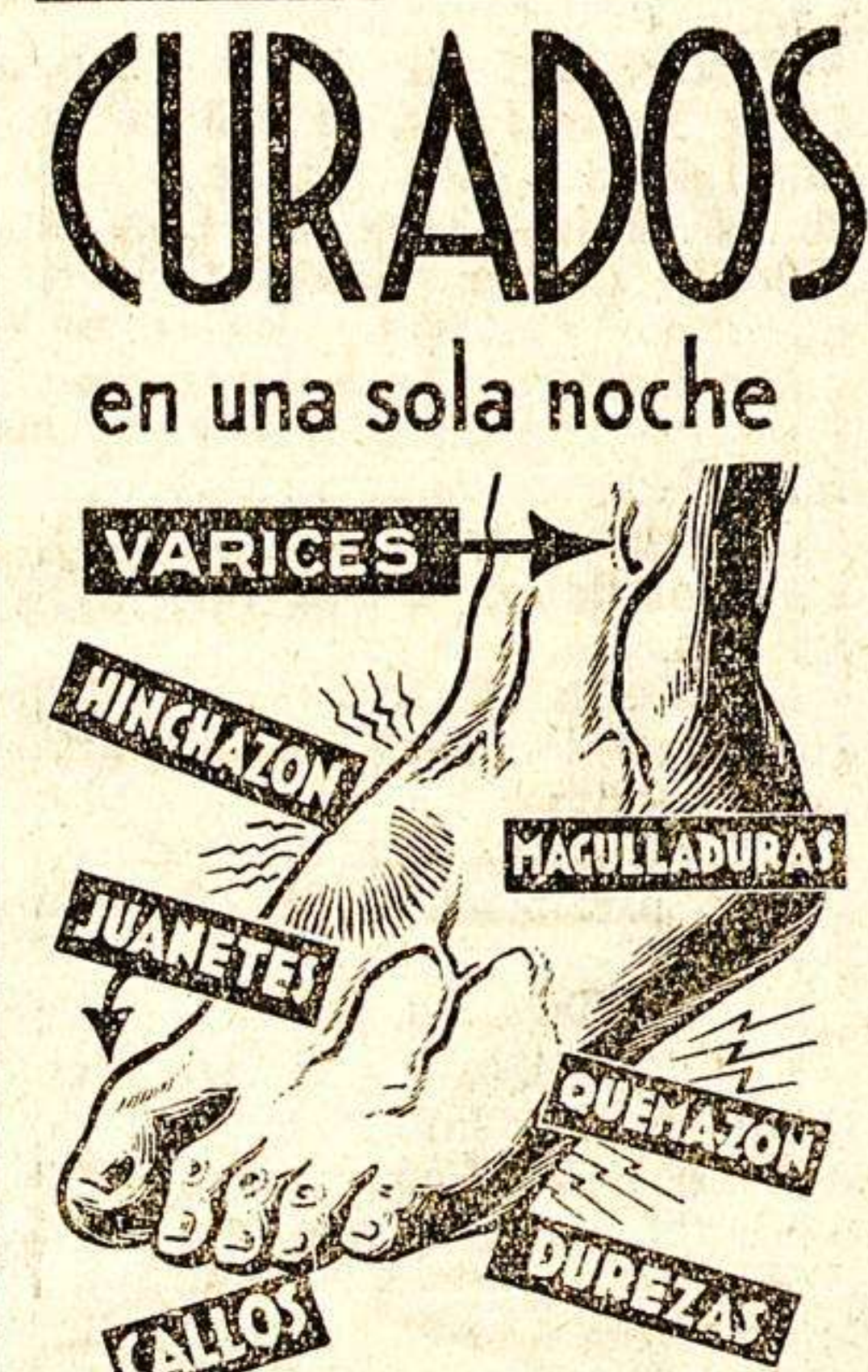
todos los males de pies

Puedes hacerlo, acogíendote a los beneficios del Decreto de 16 del pasado Marzo. Infórmate y otorga: ATENEOS SARMANTINO. PLAZA COLON, 7. TELEFONO 1.178. SALAMANCA