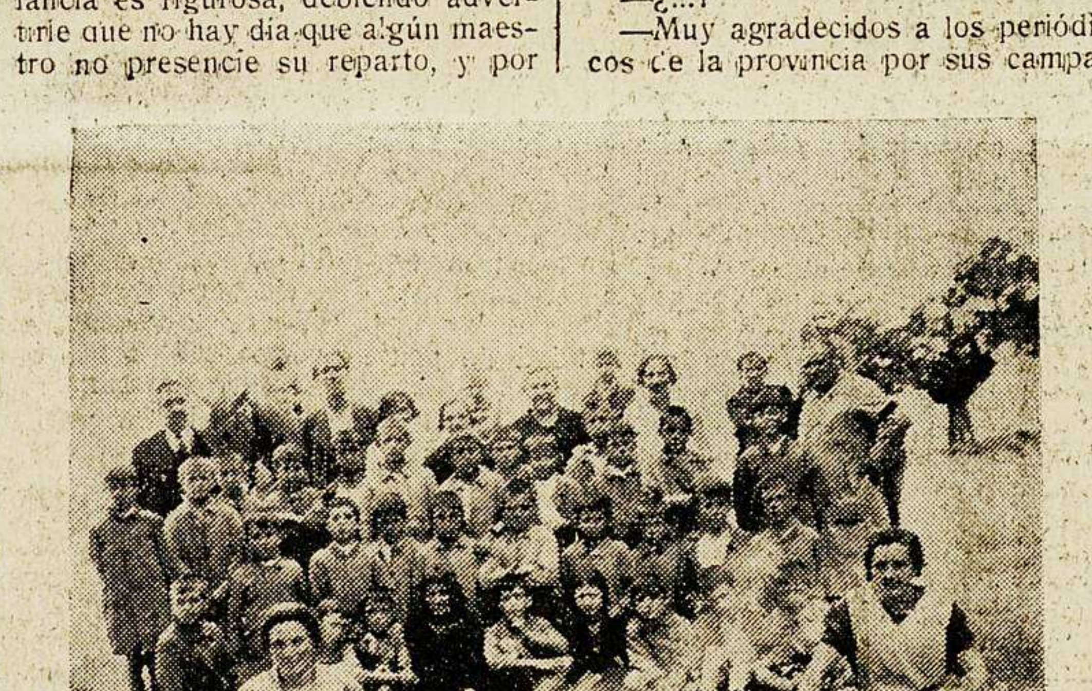
De una tarde agradable en el Castañar, de Béjar

El director señor Mezquita, culto maestro nacional, director de la Colonia y de la Cantina, es alma de estas simpáticas instituciones, y a nuestras preguntas contesta, poco mas o menos, en esta forma clara y precisa, que el periodista le sirve, lector, con la máxima competencia: —En primer lugar, debo advertirle que si llevo dos años al frente de la Cantina escolar, no es por ningún mérito personal mio, sino por una deferencia (inmerecida, desde luego) de mis queridos compañeros y señores que forman el Consejo local de Primera enseñanza, atención que yo agradezco en cuanto vale y significa, procurando desempeñar lo mejor que puedo mi cometido, correspondiendo de esta manera a la confianza en mi depositada.