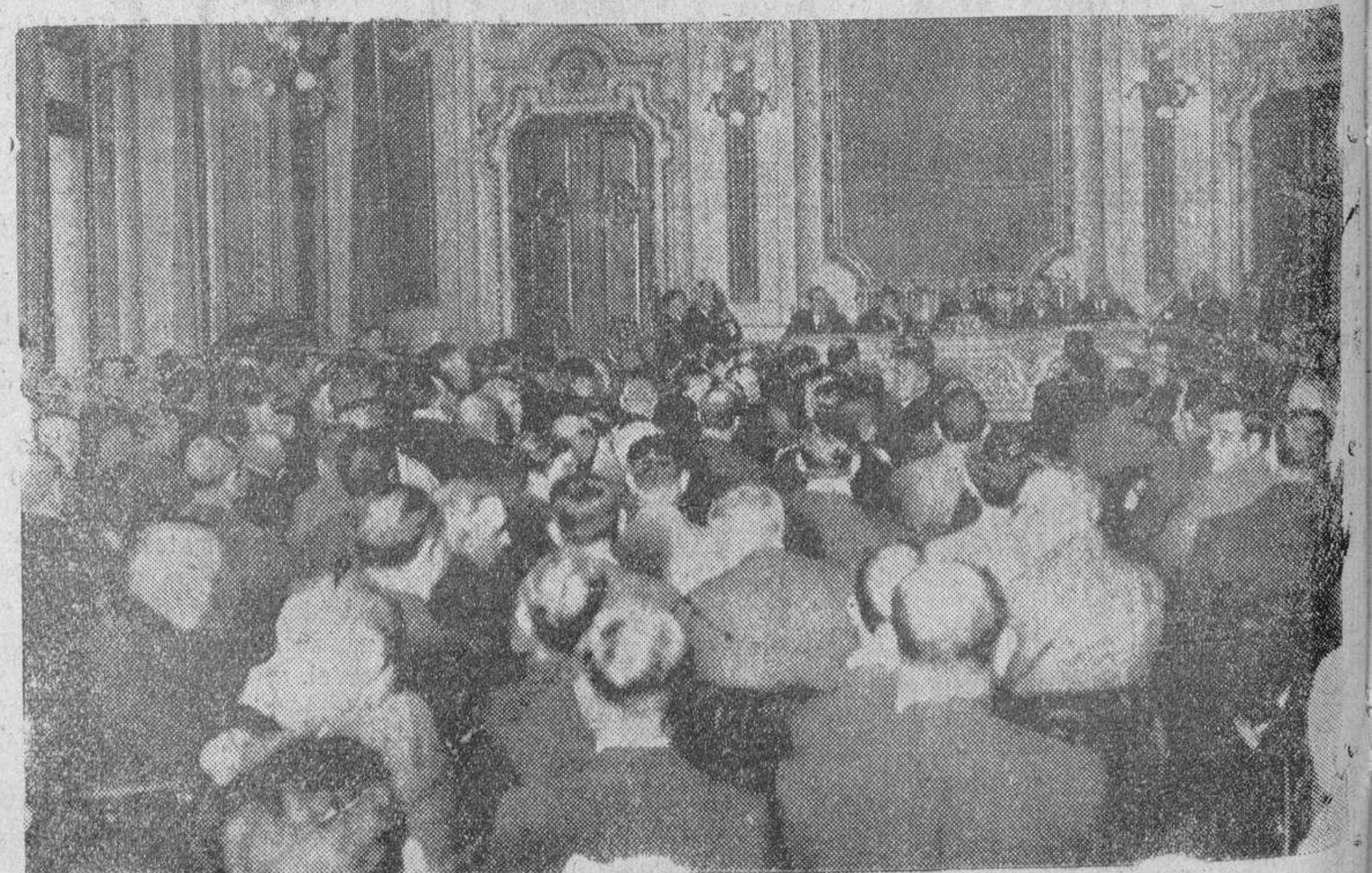
Organizada por la Federación Patronal Agrícola, y para tratar de asuntos relacionados con los problemas del campo, se celebró el martes una asamblea de agricultores y ganaderos, en Madrid. Un aspecto del salón