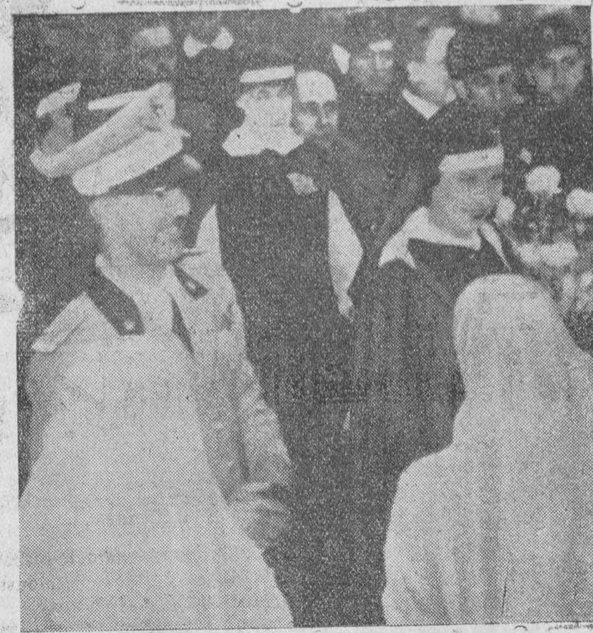
La Princesa de Piemonte ha embarcado para Etiopía, en calidad de enfermera de la Cruz Roja. En la fotografía aparece junto a su esposo, en el muelle de Nápoles.