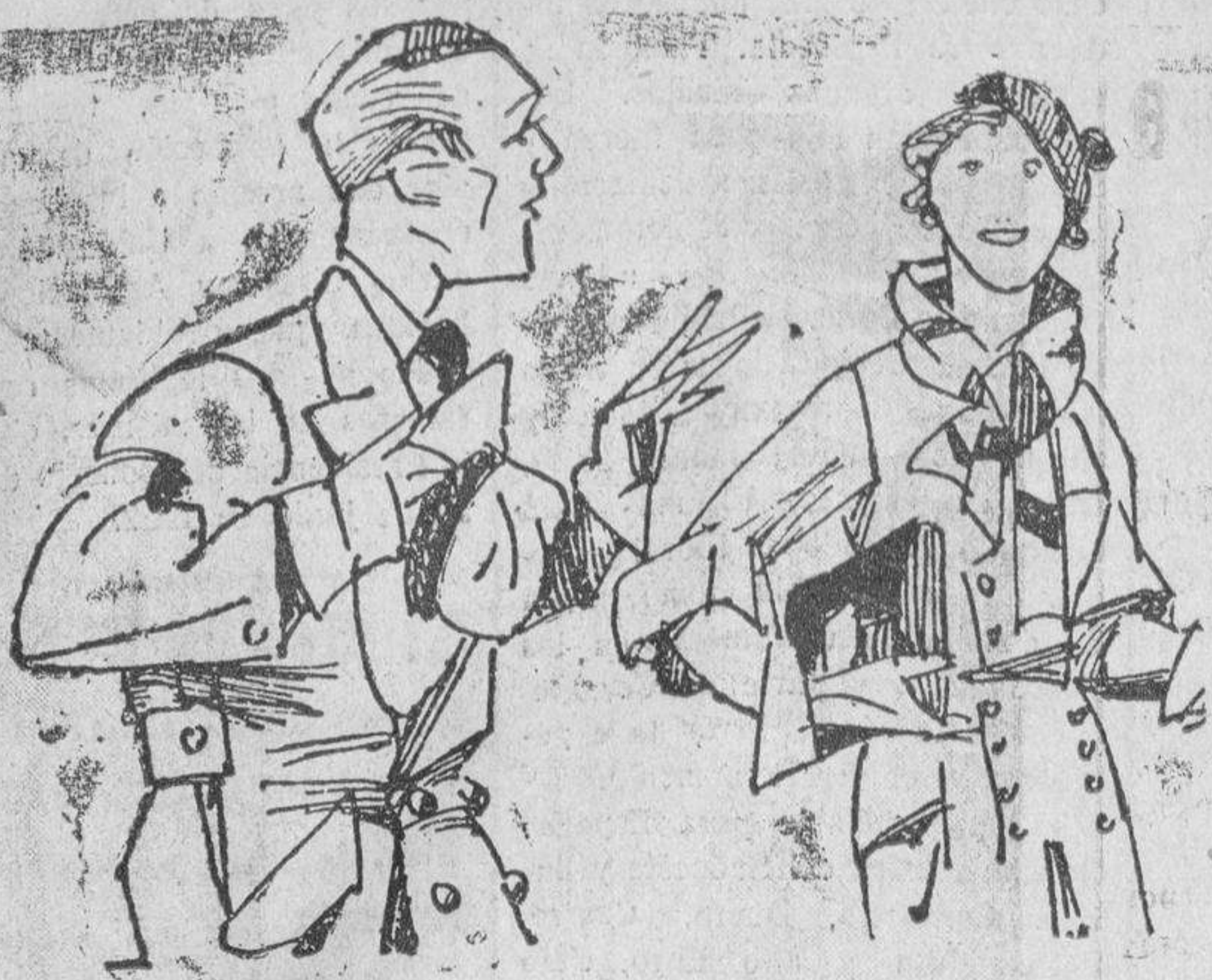
VOZ DE ALARMA

—No se hace usted un seguro de accidentes? —Por qué? —Porque va a tomar parte en el campeonato de fútbol.