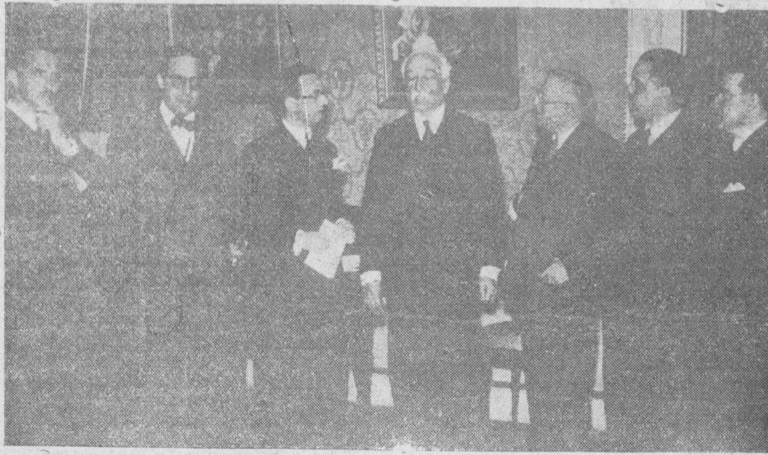
La Directiva de la Unión de Informadores Gráficos de Prensa han hecho una visita de cumplimiento al Presidente de la República. Hélos aquí con el señor Alcalá Zamora durante su estancia en el despacho del Jefe del Estado