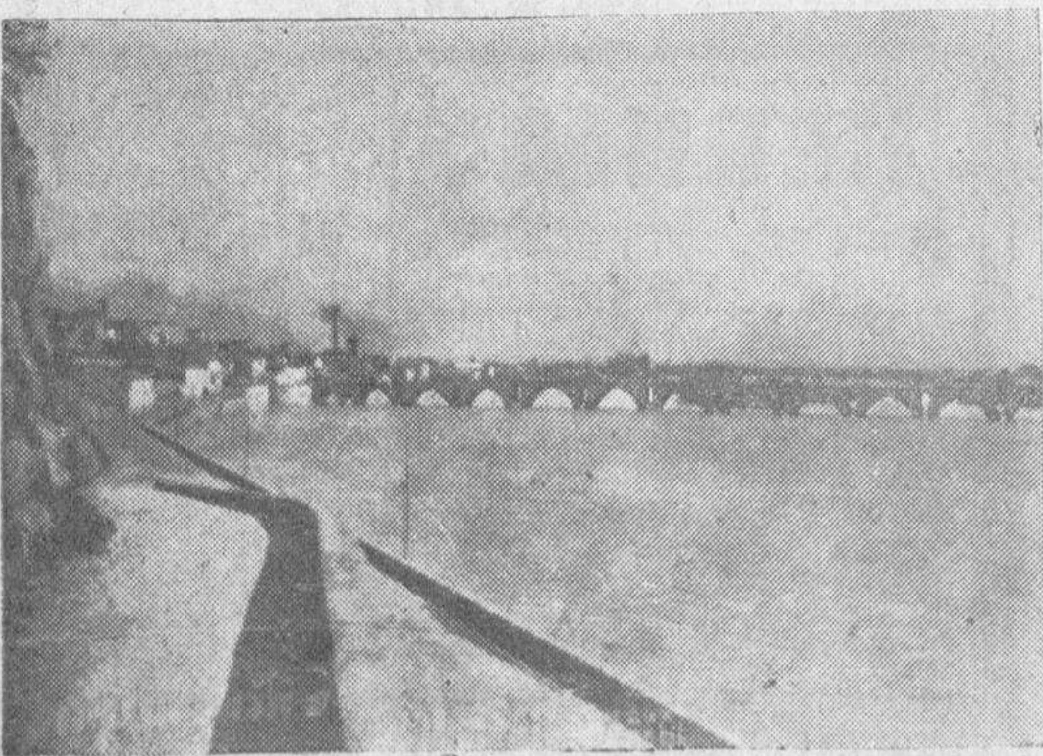
Aspecto del río Duero, en Zamora, durante las últimas crecidas.—Foto Duero.