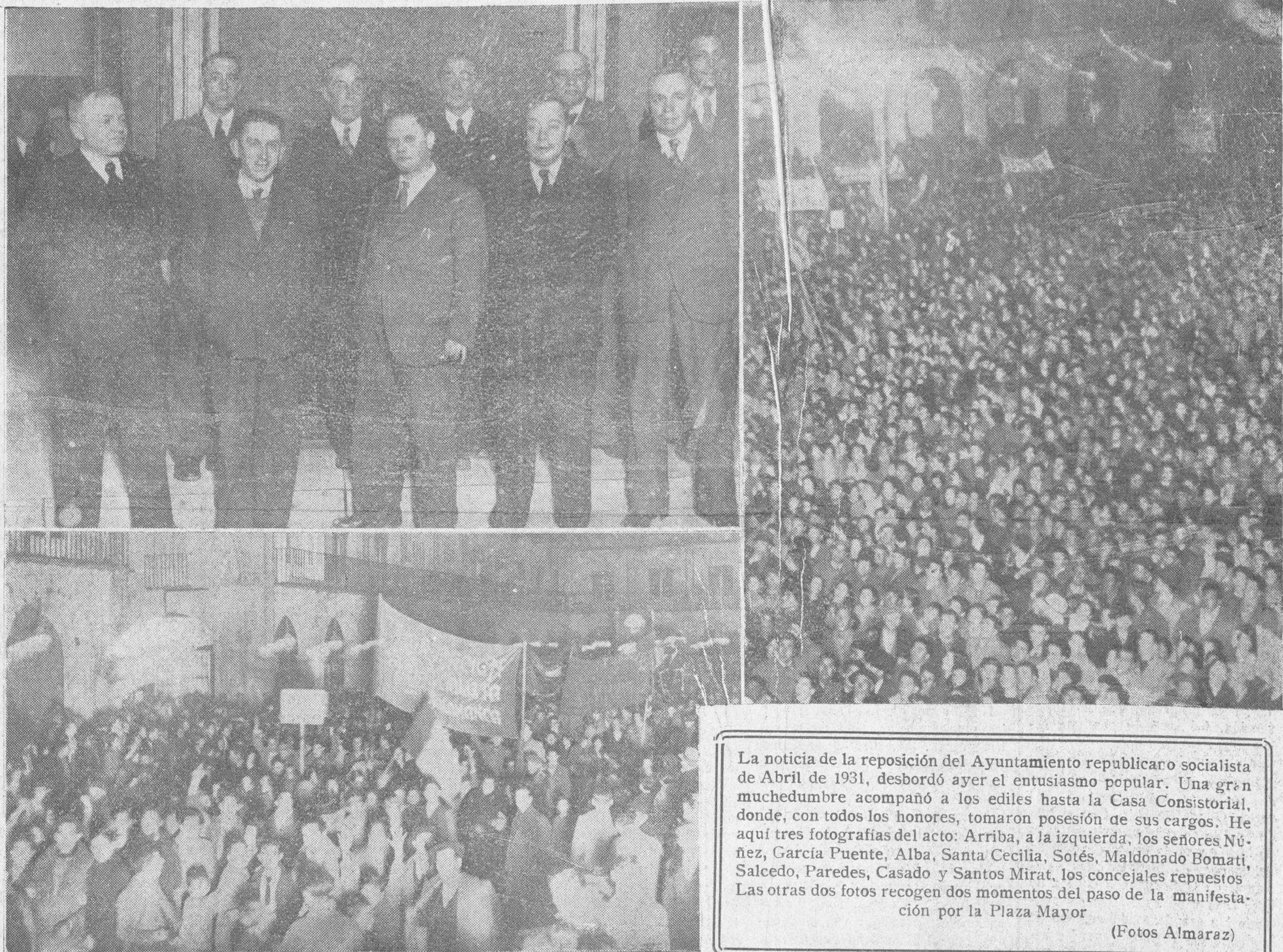
La noticia de la reposición del Ayuntamiento republicano socialista de Abril de 1931, desbordó ayer el entusiasmo popular. Una gran muchedumbre acompañó a los ediles hasta la Casa Consistorial, donde, con todos los honores, tomaron posesión de sus cargos.

5.ª Revisión inmediata de todos los desahucios de fincas rústicas llevados a cabo con motivo de la aplicación de la última Ley de Arrendamientos rústicos y aplica-