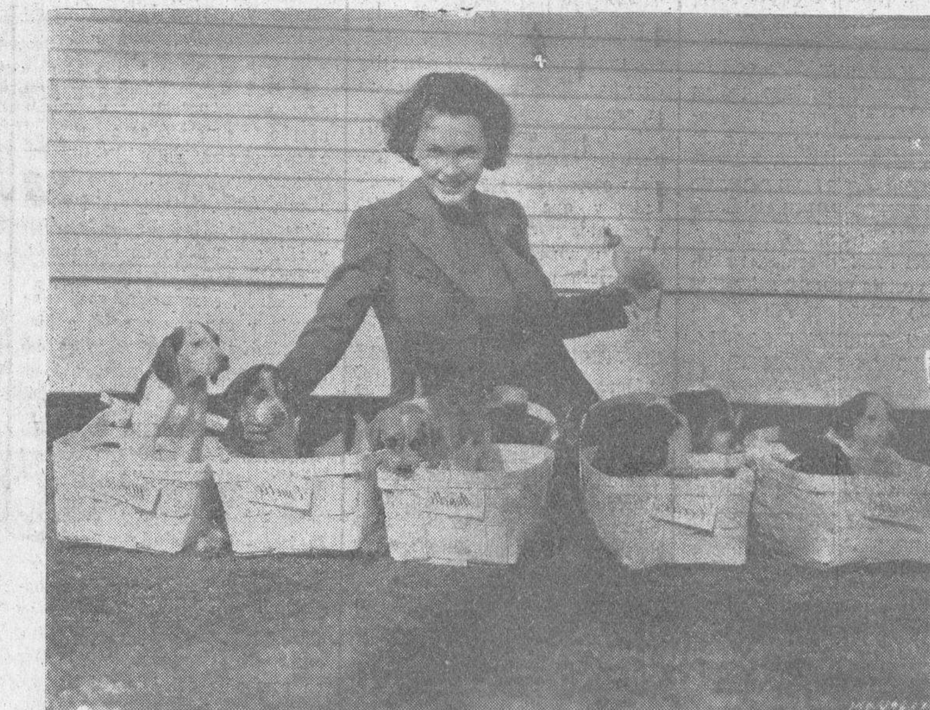
Maureen O'Sullivan, con cinco cachorros nacidos en los estudios de la Metro durante la producción de una película en que aparece la madre