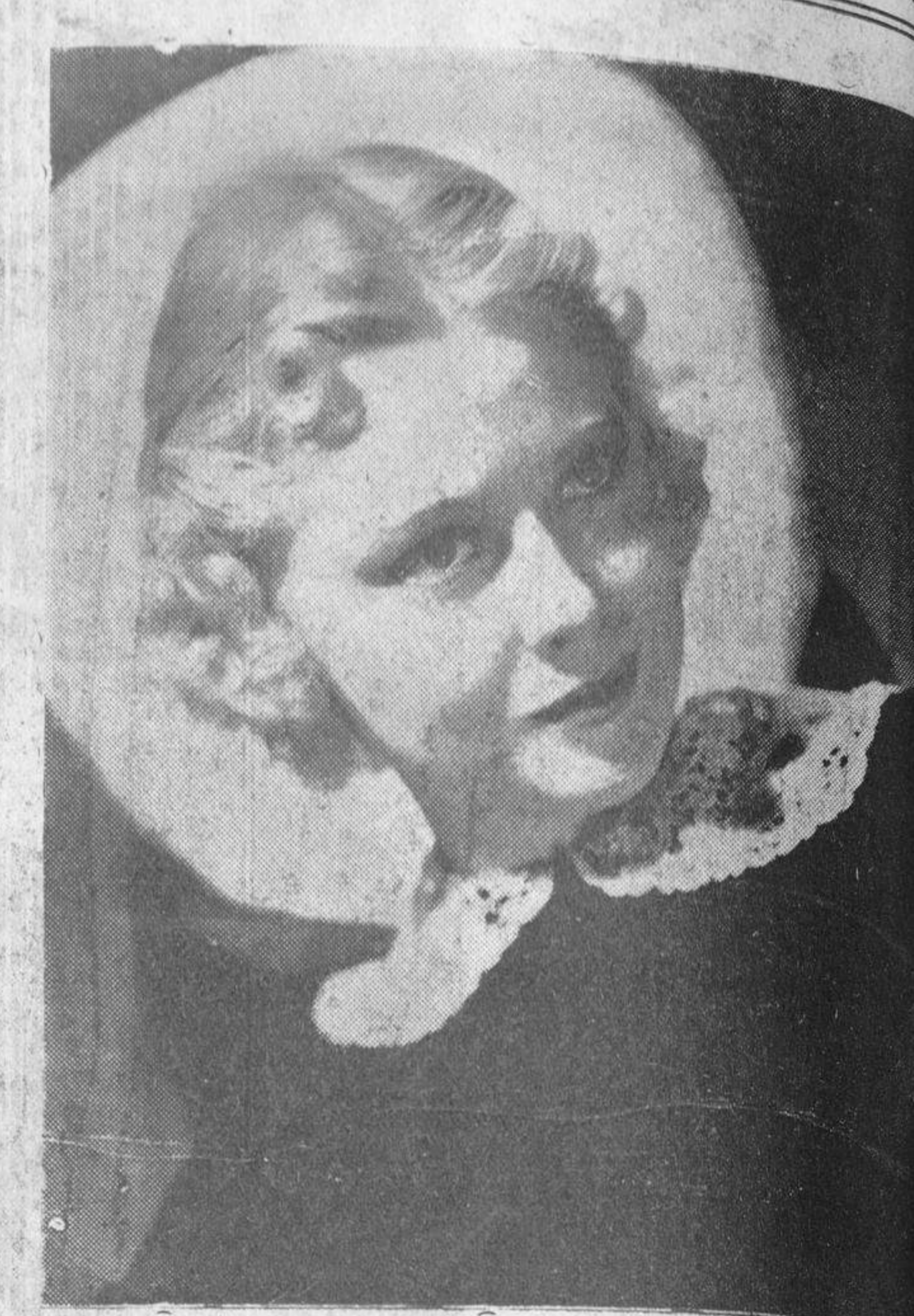
Mary Carlisle, encantadora actriz de la pantalla

“La Cifesa—ha dicho el crítico de “Diario de Madrid”—con una generosidad que le honra, de la mano de una de nuestros mejores directores—Benito Perojo—y de uno de los literatos madrileños más dados a lo castizo y menos da-