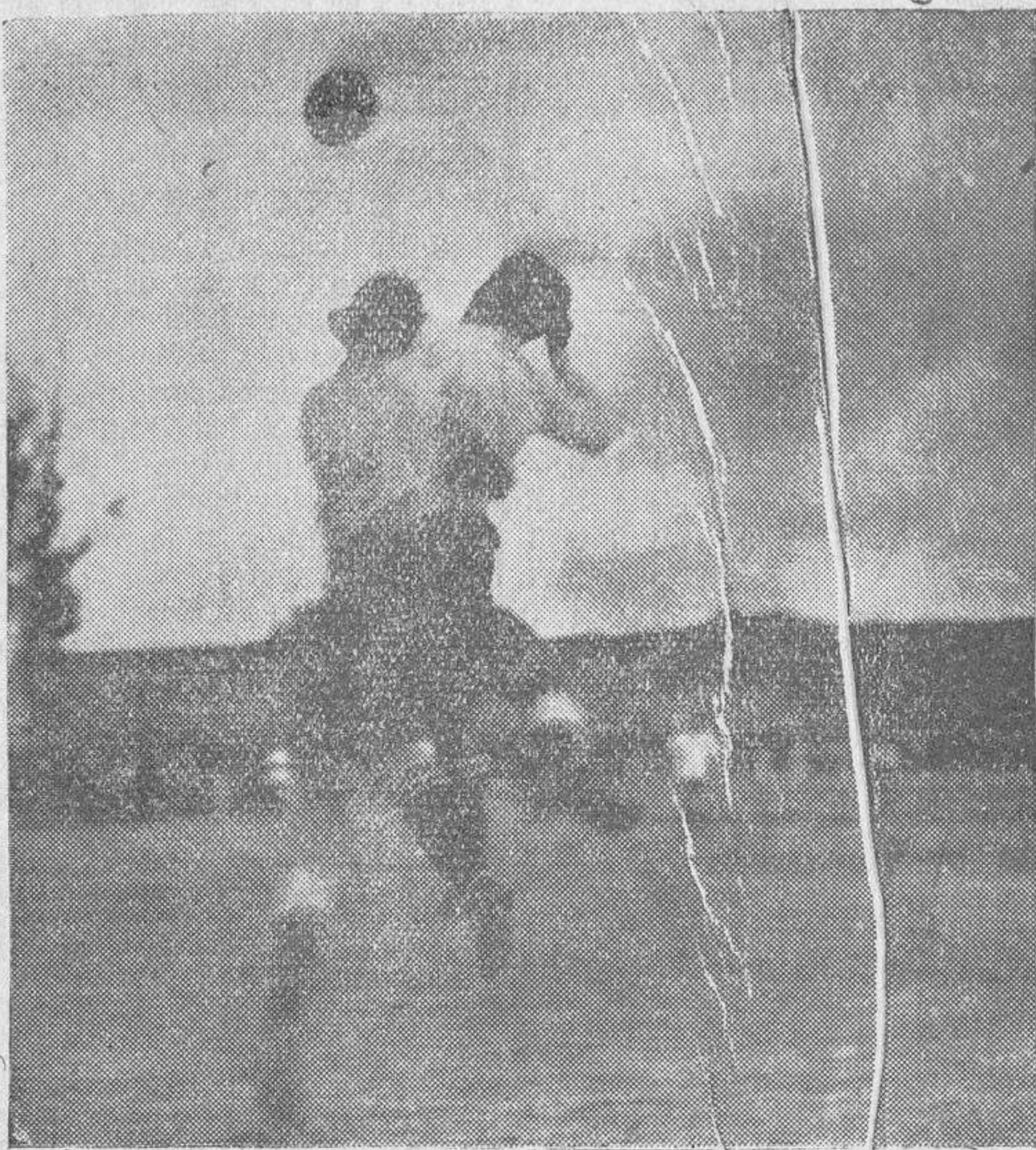
El portero del equipo madrileño, al despejar un balón