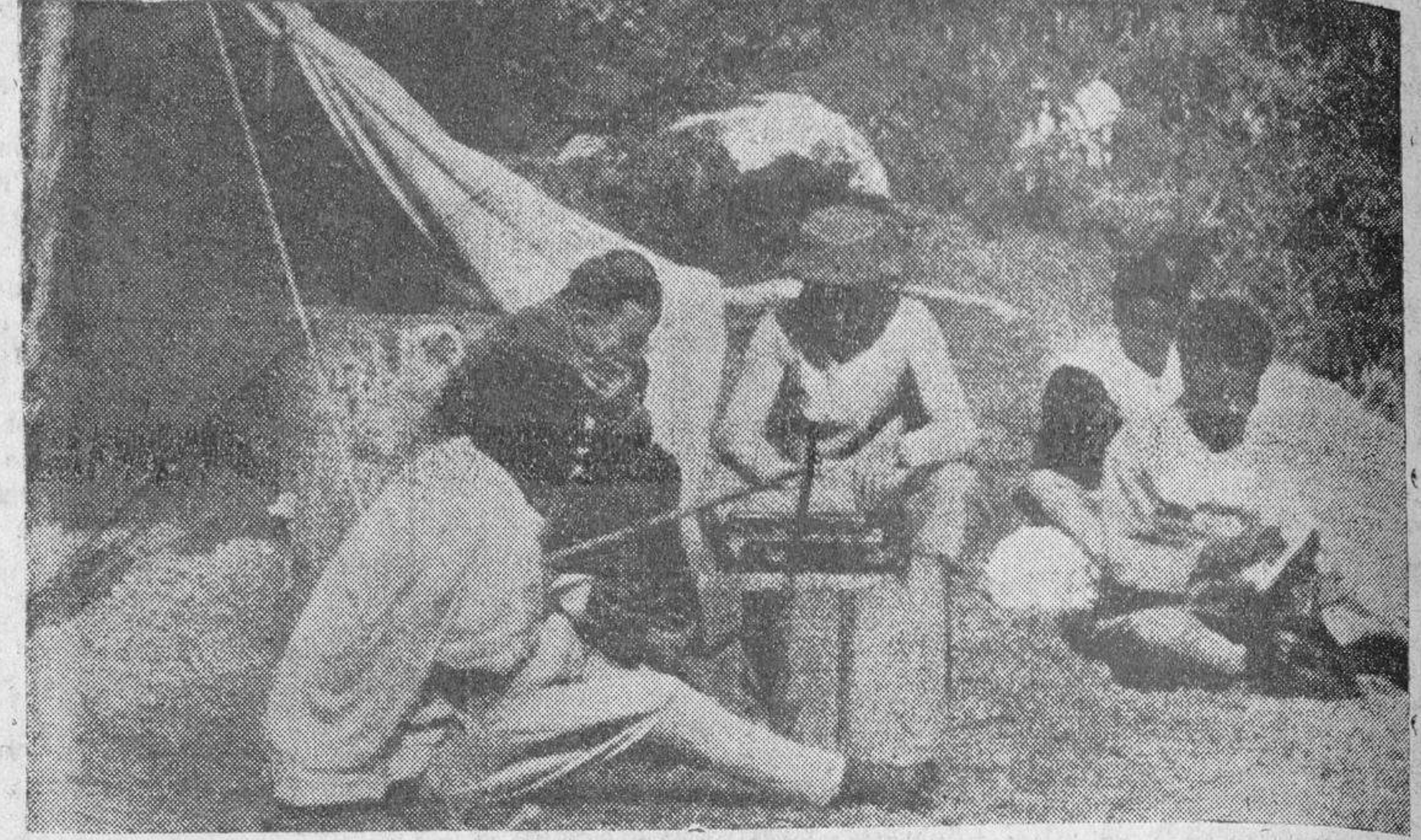
Ante la escasez de alojamientos, los corresponsales de guerra se ven obligados a instalarse en tiendas de campaña