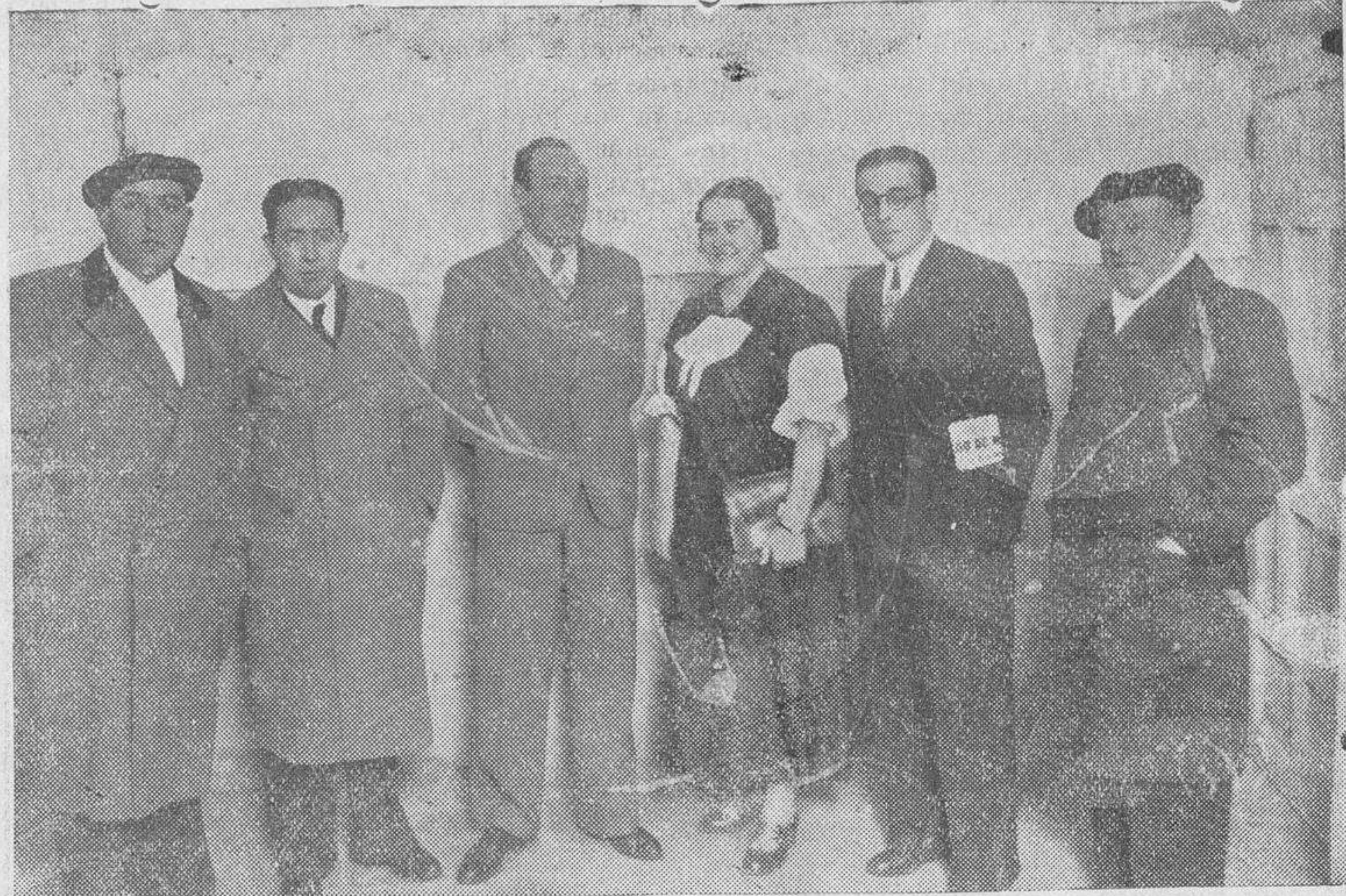
Los oradores que intervinieron en el mitin del teatro Bretón y varios directivos de la Agrupación Socialista

Comienza expresando su satisfacción por ser el primer diputado catalán que viene a tierra castellana para traer la expansión del sentir de Cataluña. Y esta interven-