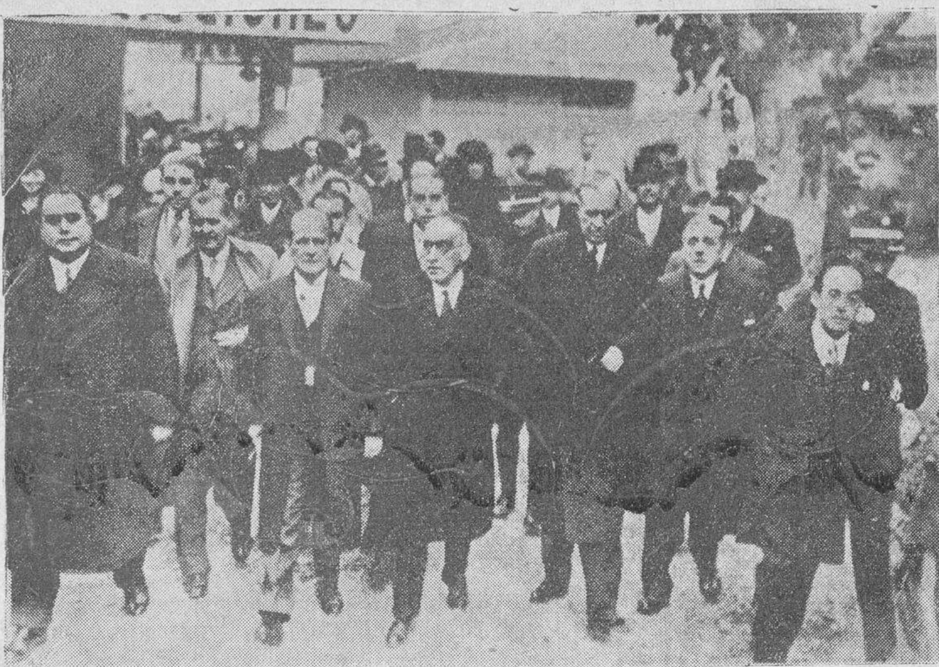
El ministro de Agricultura e Industria, señor Martínez de Velasco, con el Gobernador civil de Zaragoza y otras autoridades, recorriendo el recinto de la II Feria de Muestras, cuya clausura se verificó el domingo