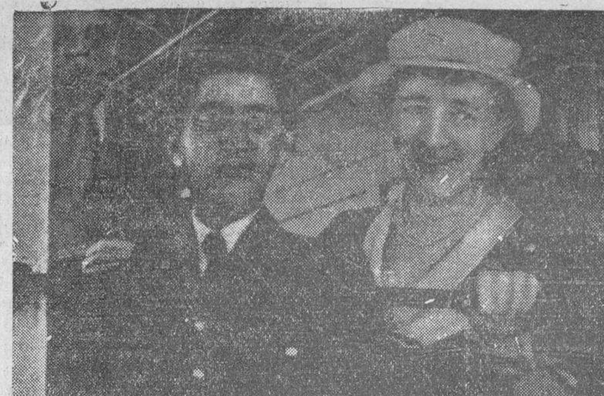
El duque de Harrar, segundo hijo del Negus, en el momento de emprender, con su institutriz, el viaje hacia el refugio que le ha sido habilitado en lugar desconocido