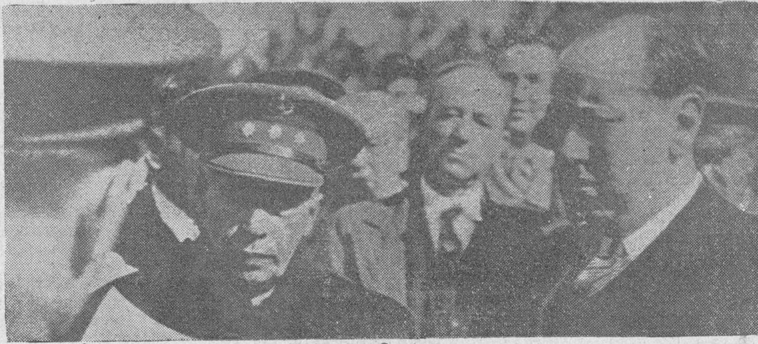
En El Escorial ha sido colocada la primera piedra para la construcción de un sanatorio antituberculoso para militares. He aquí al ministro de la Guerra, señor Gil Robles, escuchando la lectura del acta correspondiente