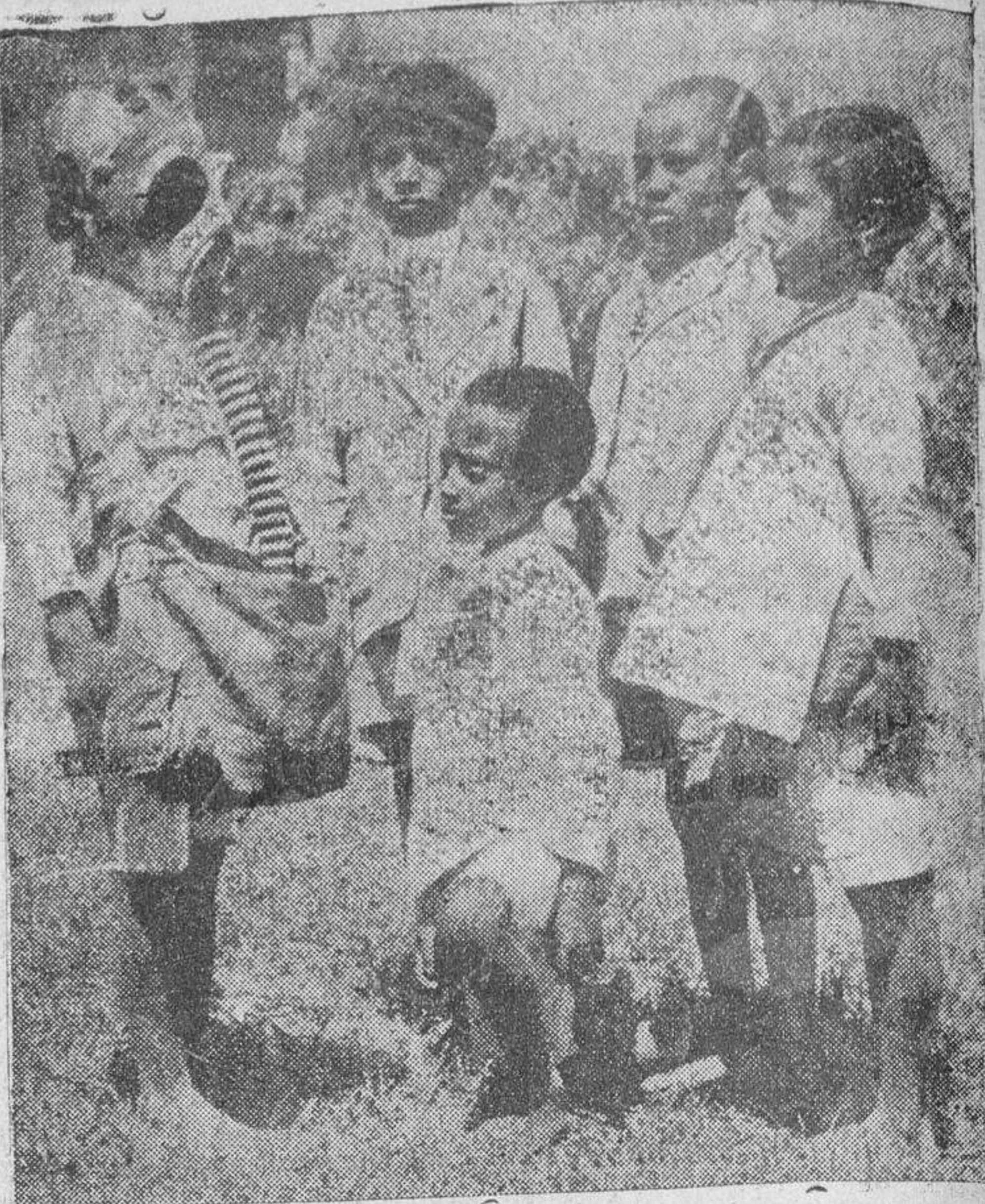
En Addis Abeba los niños se asustaban los primeros días al ver las caretas contra los gases asfixiantes; pero ya se van familiarizando con ellas