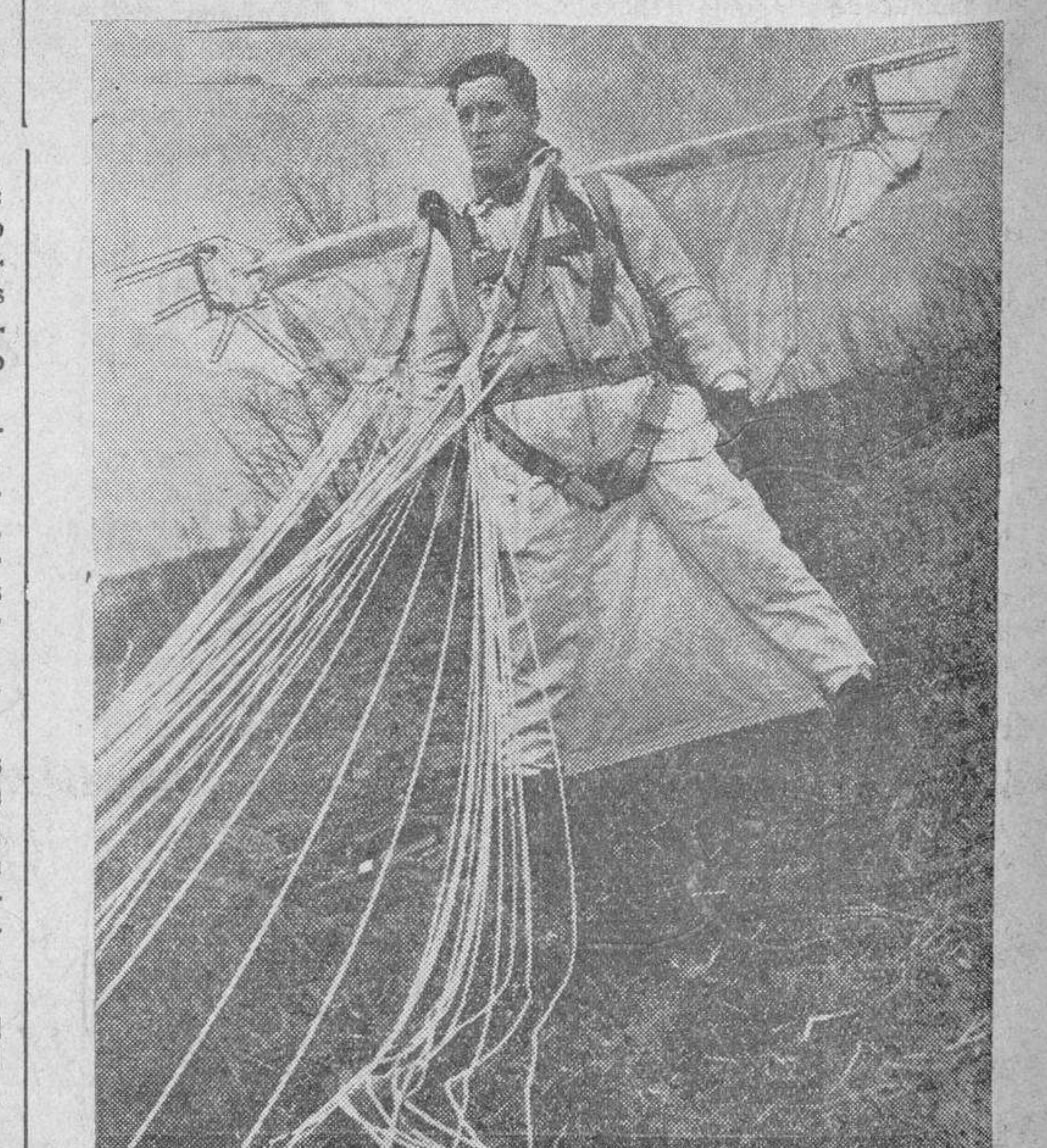
El famoso paracaidista Schmidt, provisto de unas alas de fiengo que accionaban como las de un pájaro, se ha lanzado al espacio desde un avión que volaba a 1.500 metros, tardando en un recorrido vertical de 900 metros, cuarenta y cinco segundos.