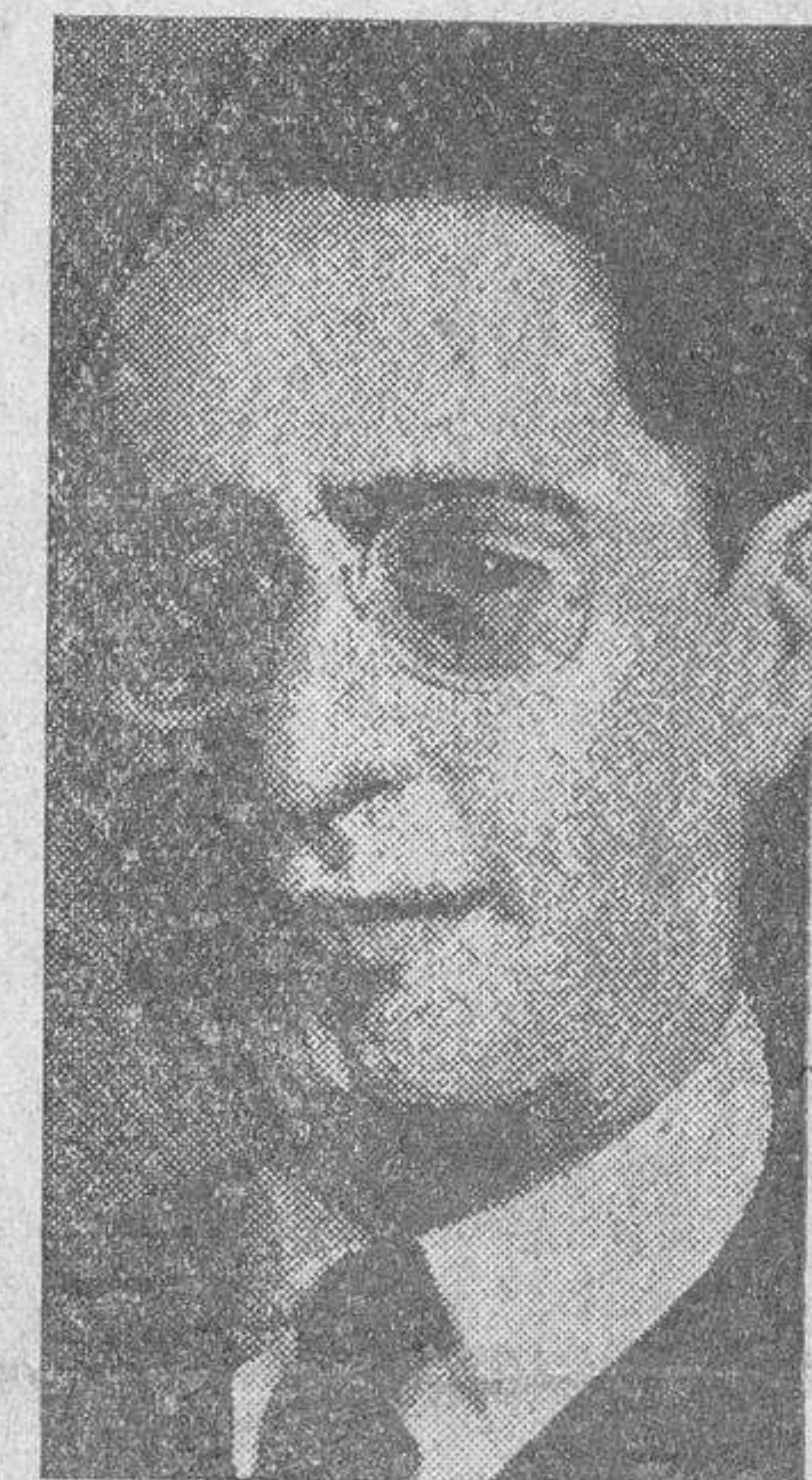
El ministro de Obras Públicas de Italia, señor Luigi Razza, que ha perecido en un accidente de aviación

Para todos, el señor Casanueva tuvo frases de consuelo, ofreciendo que en el primer Consejo que celebre el Gobierno, propondrá la concesión de un crédito, para remediar la deplorable situación en que han quedado ambos pueblos.