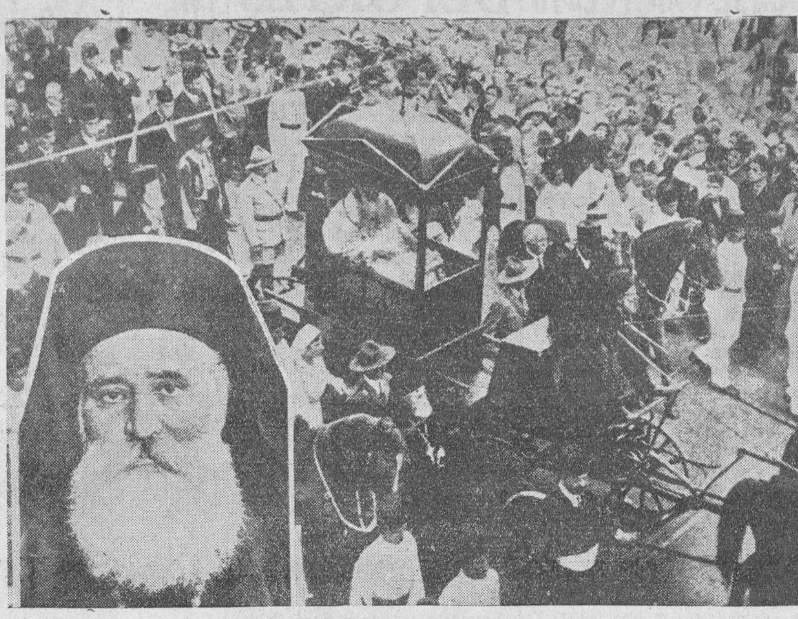
Ha fallecido el patriarca de la Iglesia griega de Alejandría, Melitos II. Como costumbre tradicional, el cadáver, embalsamado y sentado en un trono, es conducido a El Cairo, donde recibirá sepultura.

que se les han dado del Ministerio, señalan el cumplimiento en su deber, cuales son aquellas partidas que por su estado de conservación o por su falta de limpieza tienen que ser rechazadas. Nosotros hemos de encarecer a todos, que por una parte traigan los trigos perfectamente pesados y en las debidas condiciones de limpieza y en casos de duda, sobre el estado de conservación del trigo, que consulte antes de proceder a su envío. —¿Qué influencia cree usted puede tener esto en el valor de los trigos? —En primer lugar, tiene el de haber evitado que ante la necesidad de numerario y de disposición de los locales se hubieran precipitado a tratar de vender de cualquier modo todos los tenedores de trigo añejo, con lo que el precio se hubiera derrumbado en términos que no es fácil calcular. En segundo lugar, es evidente que todos aquellos a quienes alcance el beneficio de la retirada, venderán sus trigos a un precio bien remunerador, y por último, algo influirá también en la tonificación general del mercado, si bien no en aquella escala en que esto hubiera ocurrido de haberse efectuado esta operación como debió hacerse hace dos o tres meses. En este punto dió por terminada su conversación el señor Clairac, al que le mostramos nuestro agradecimiento.