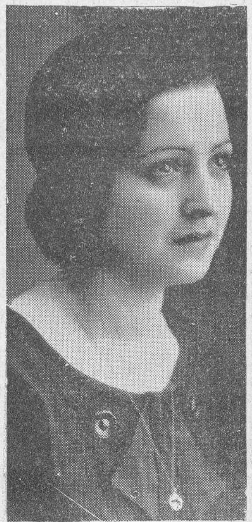
Una nueva foto de "Miss Región Leonesa". (Foto Pazos).

Pero hay que buscar a esta belleza tan lejos, que nos parece