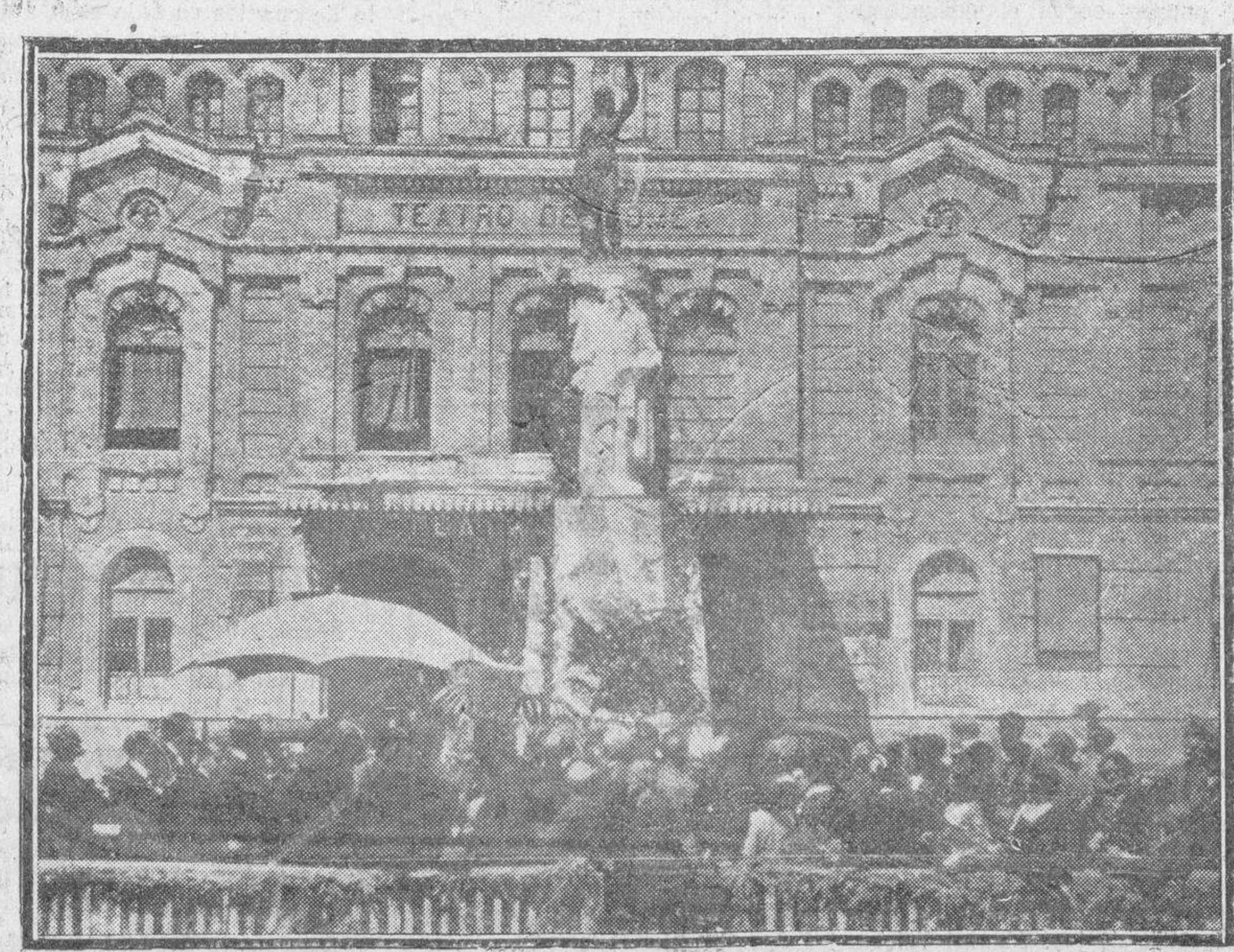
Vista del monumento al maestro Fernández Caballero, inaugurado en Murcia el pasado domingo, con asistencia del Ministro de Estado y del Director general de Bellas Artes.