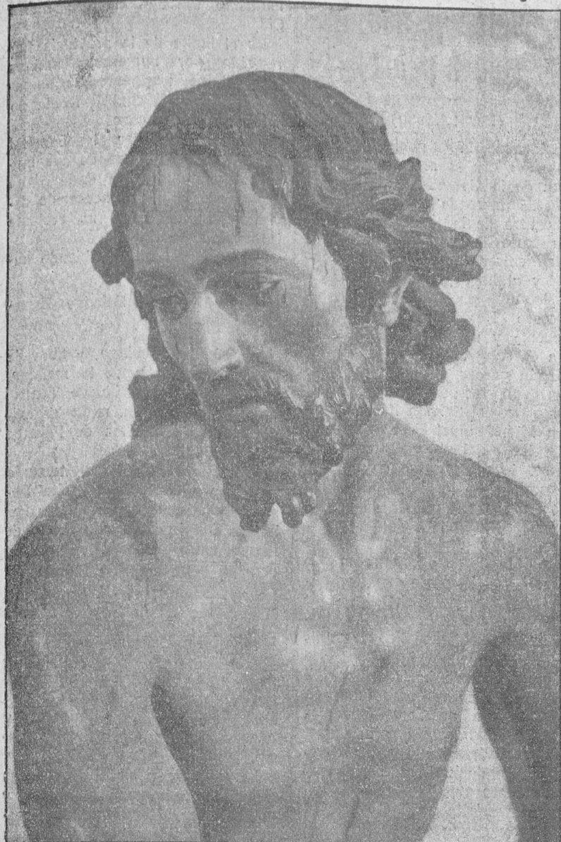
Un detalle de la Flagelación, en el que puede admirarse la maravillosa ejecución del rostro de Jesús, después de haber sido azotado bárbaramente.

preocupa, de la producción, que era el fenómeno de hace unos años. Pero ha surgido otro que el conferenciante olvidaba o desdénaba. El de la distribución. Para el aspecto productivo, sus teorías son impecables. La ley de la oferta y la demanda es, en efecto, una ley natural, y nada regula mejor la actividad productora y los afanes creadores de la Humanidad. Pero la distribución tiene un matiz social que no se puede dar de lado. Cuando hay millares de hombres que ven pasar cada día una hora y otra, y así hasta veinticuatro, sin jornal y sin pan, no se puede teorizar solamente desde el emplazamiento de una iniciativa privada y del interés que debe recoger el capital invertido. Hay que pensar en los que no trabajan porque no pueden trabajar; La Ley distributiva de la riqueza y de la producción no es más fuerte y tiene más valor que la del nacimiento de esa misma riqueza. Y si el Estado puede inhibirse en la segunda y se puede admitir que la iniciativa privada que se basa en la libertad económica, fecunda más rápidamente la riqueza y la prosperidad de la vida industrial, en la primera esa inhibición es criminal. No puede el Estado oponerse a las corrientes de justicia distributiva. Y como no puede oponer, ha de intervenir. He aquí como la participación directa de los gobiernos en la economía de los países tiene una razón fundamental de existencia.