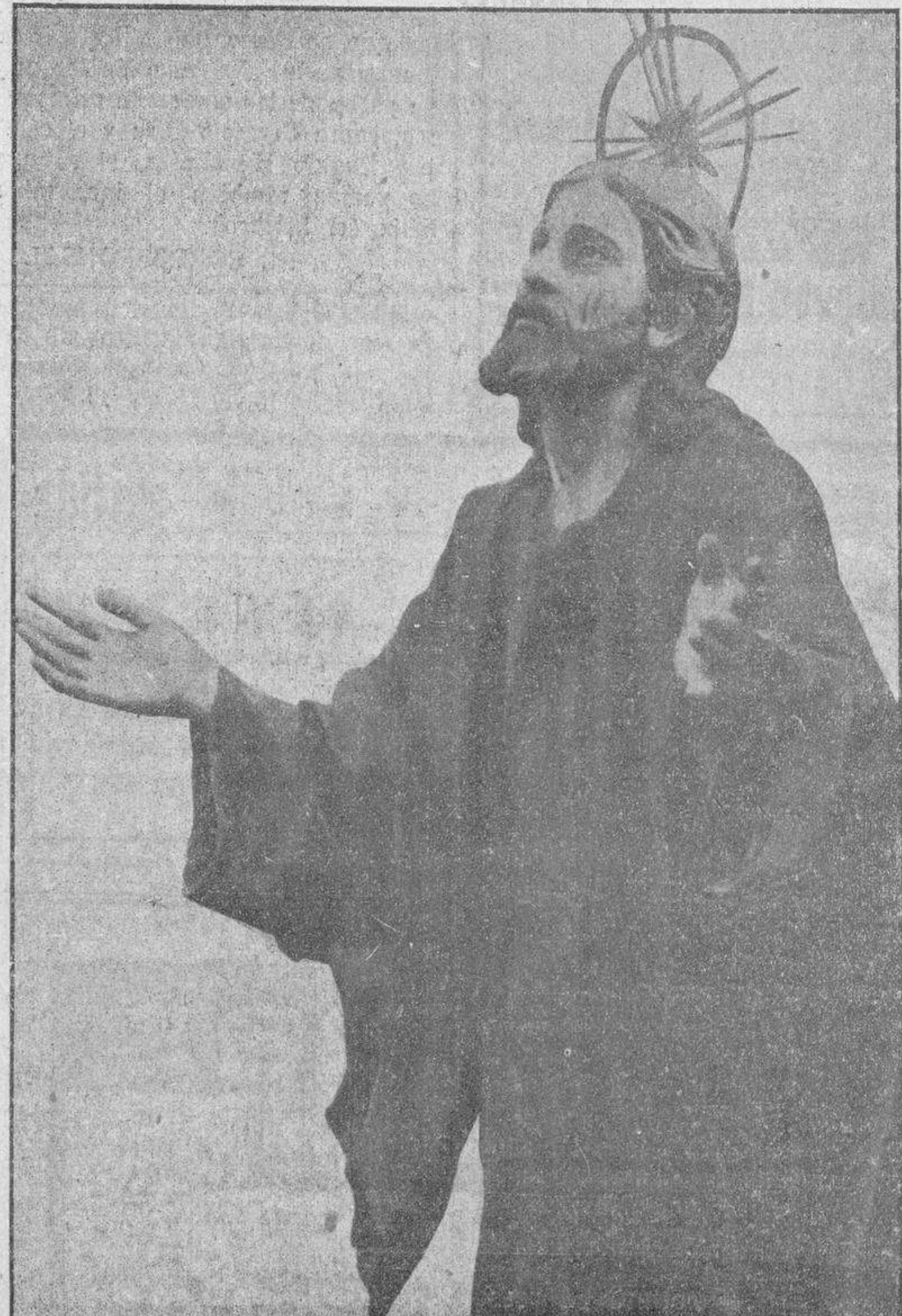
JESUS ORANDO.—Detalle del «paso» La Oración del Huerto.