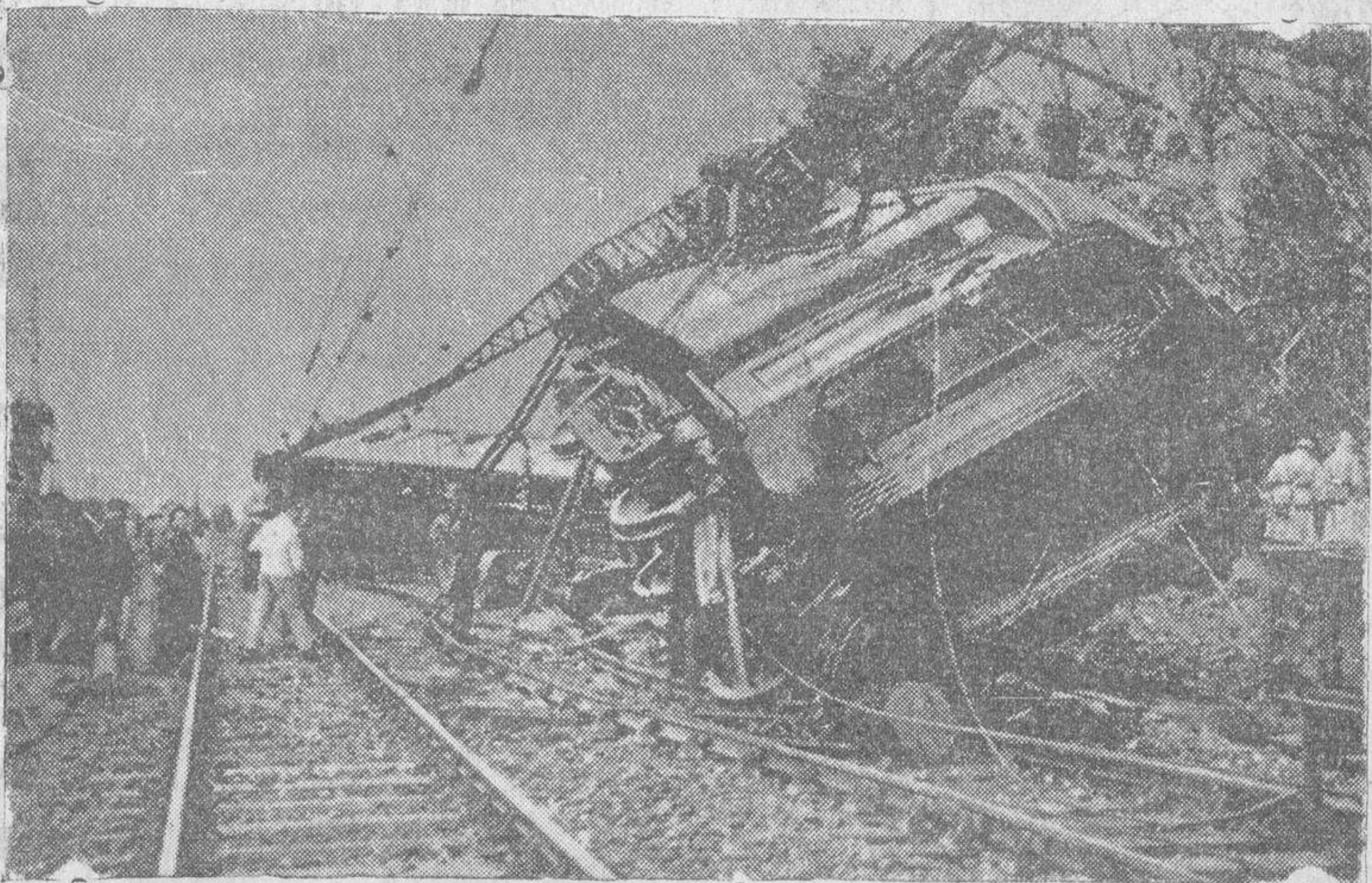
Estado en que quedaron algunas unidades del rápido Bayona-París, que descarriló hace unos días, pereciendo en el accidente tres viajeros