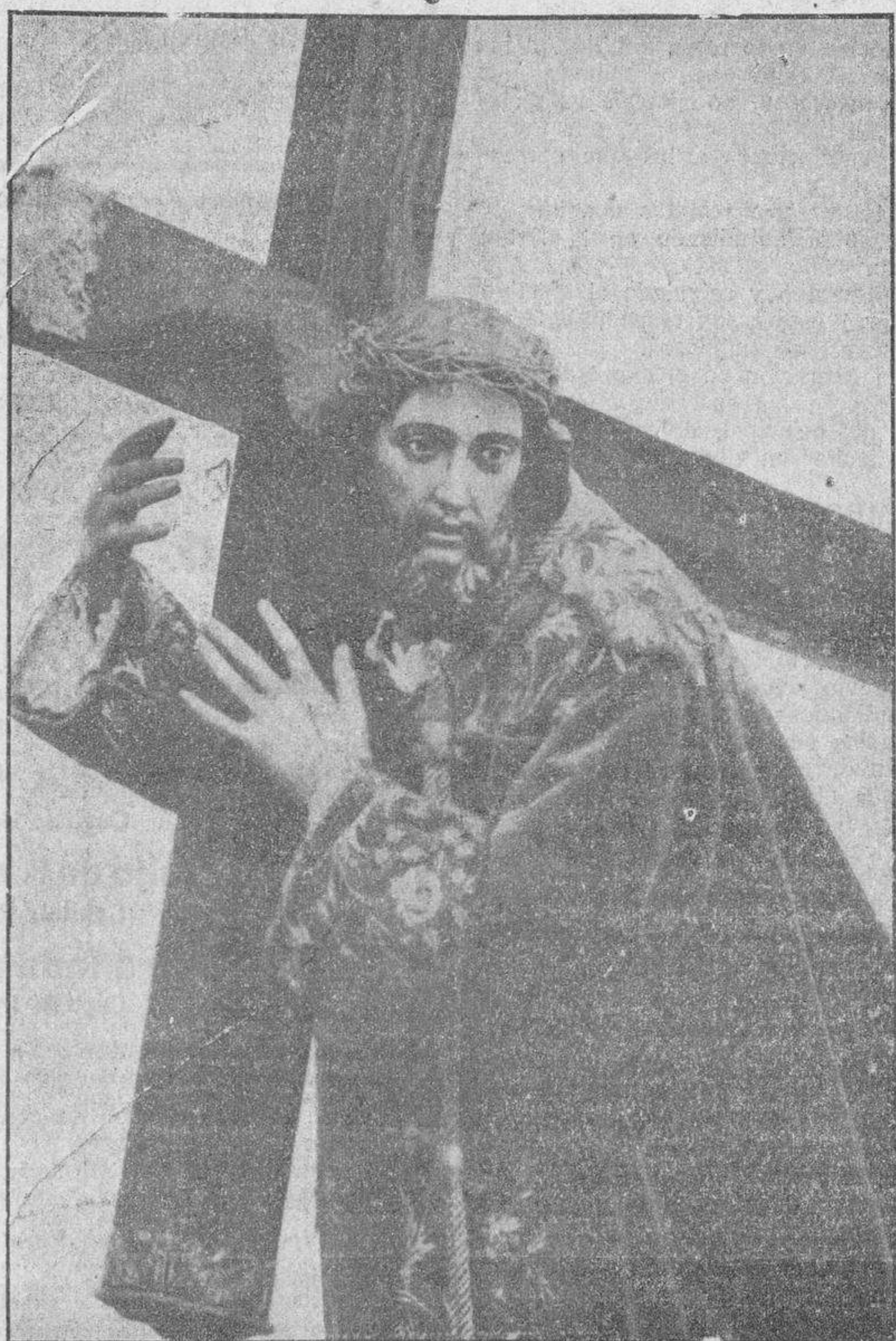
Un detalle de El Encuentro.—El Divino rostro de Jesús, que tantísimos admiradores tiene.