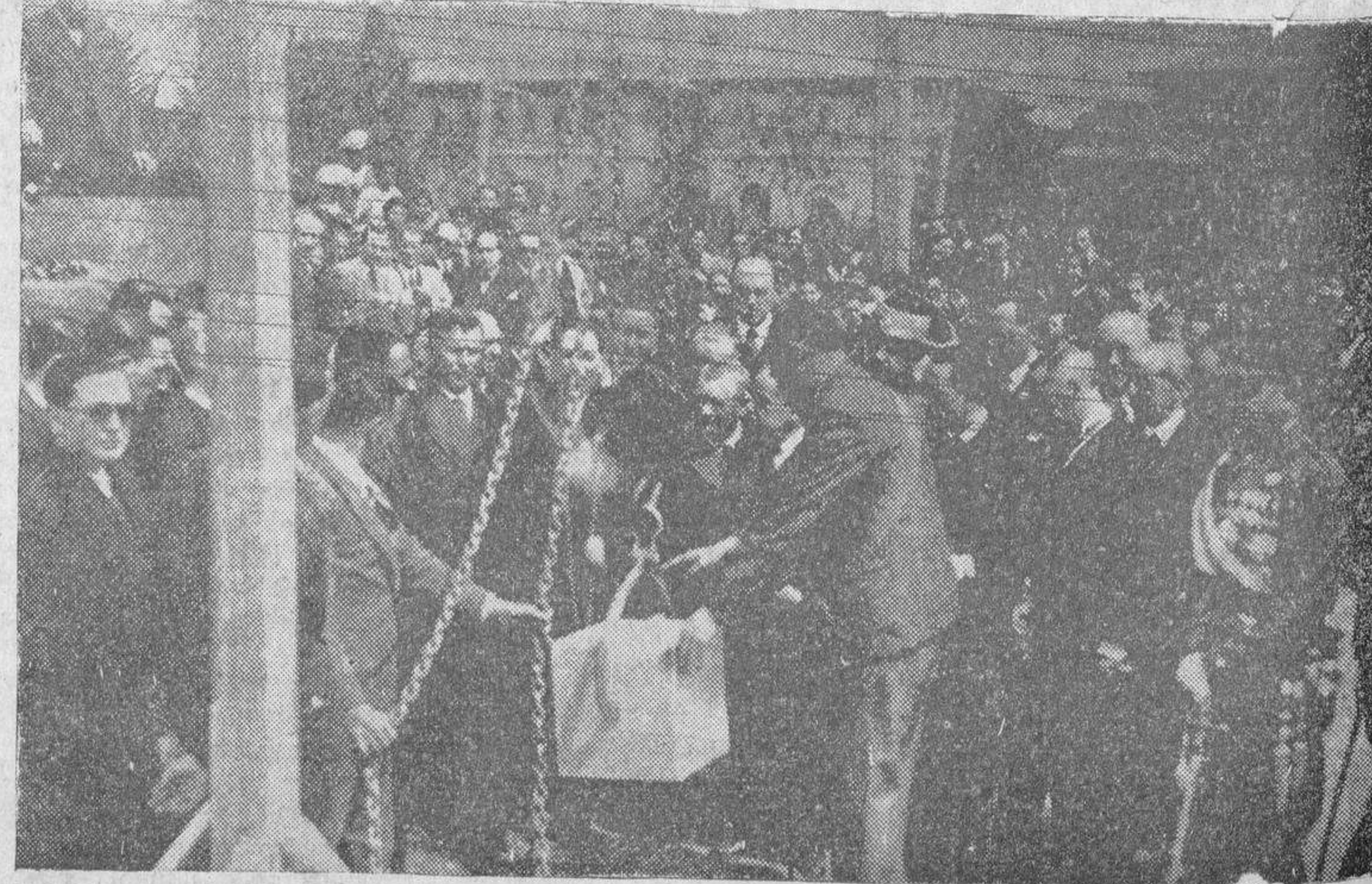
Momento de la colocación de la primera piedra del monumento a Galán y García Hernández que se erigirá en Huesca