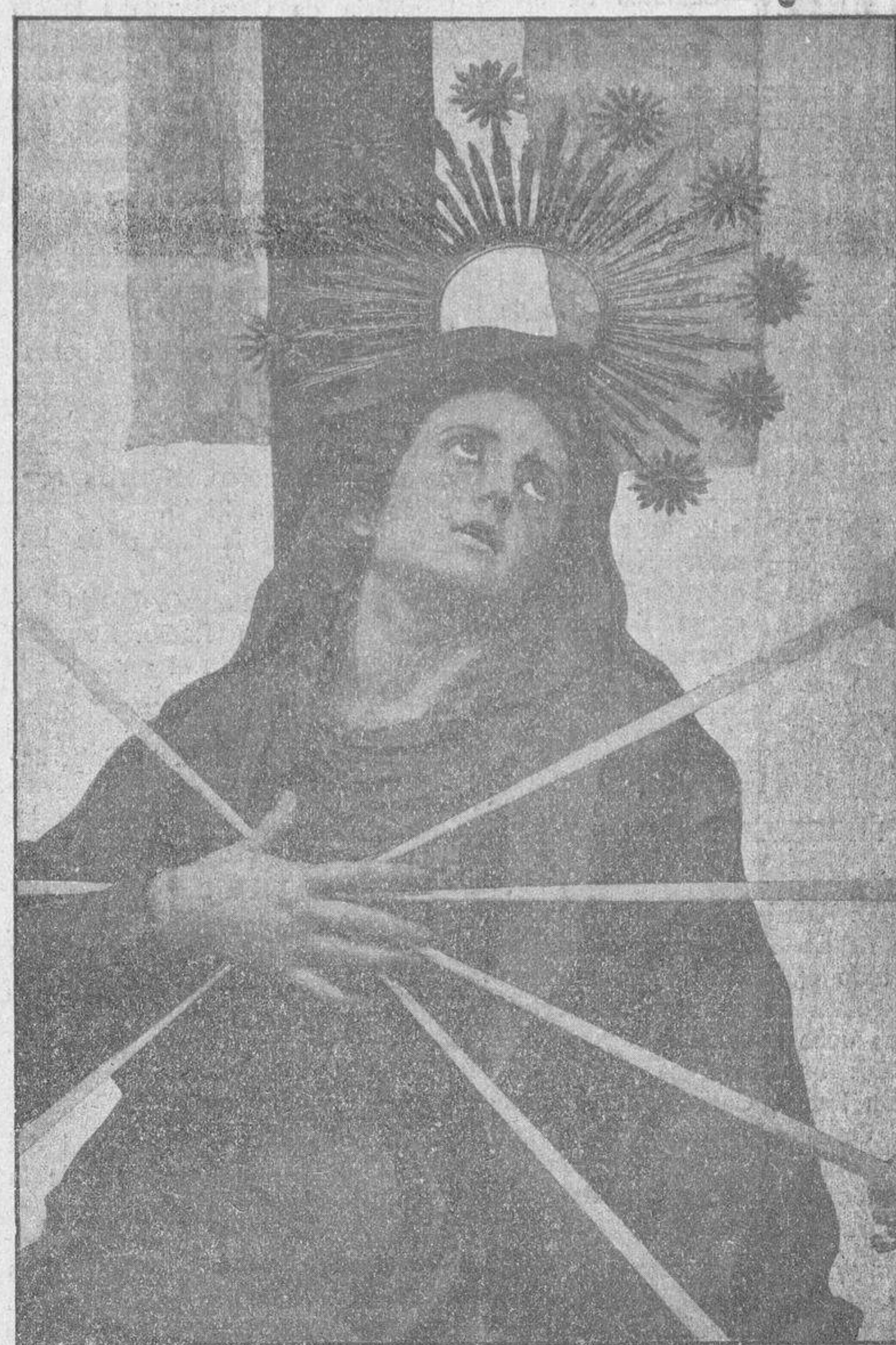
Un detalle de la Dolorosa para demostrar que la expresión de esta cara ha sido felizmente lograda. Con este "paso" termina la procesión del Viernes Santo por la tarde. (Foto Ansede).