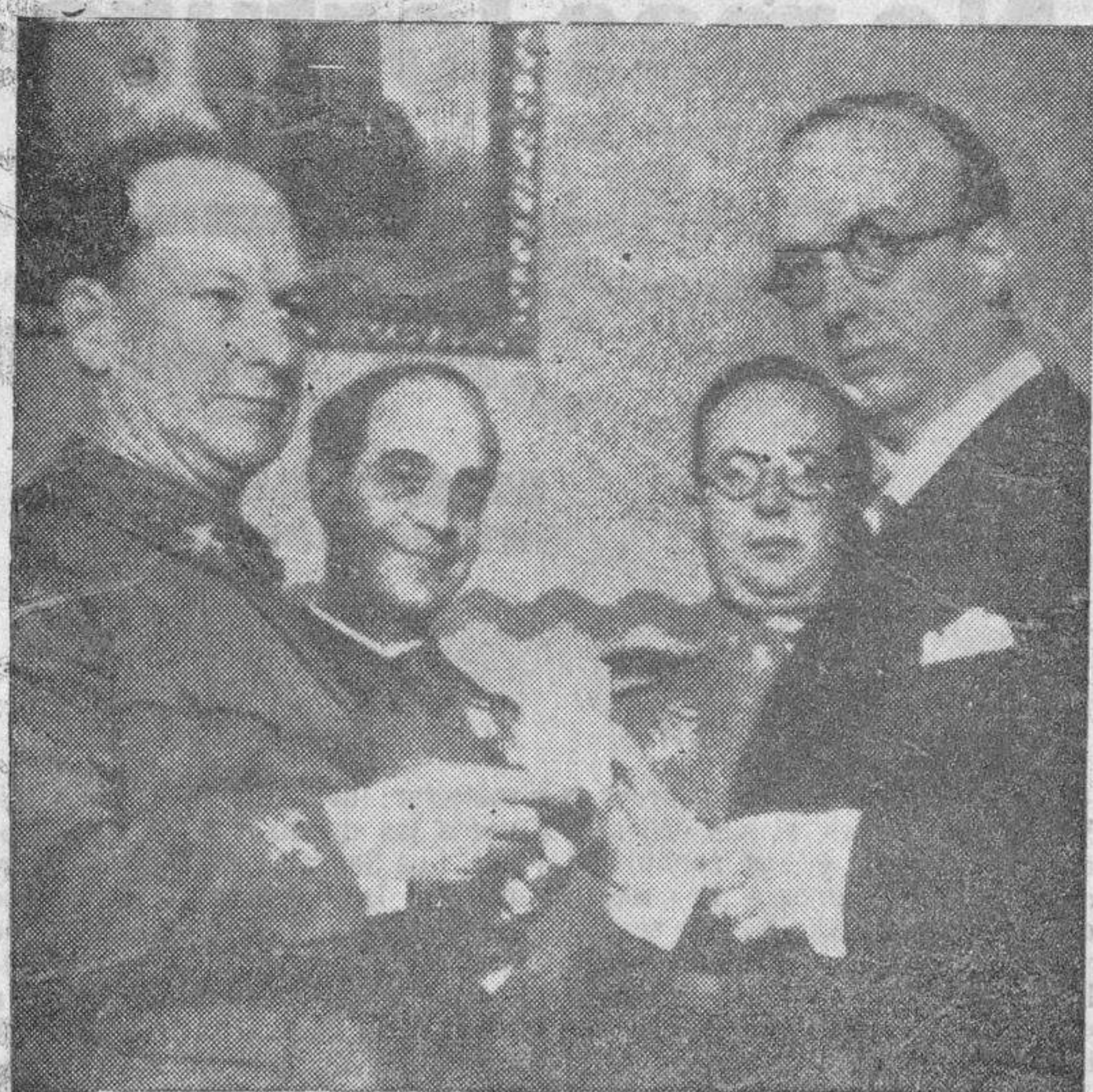
El general López Ochoa, recibiendo de manos del secretario del Ayuntamiento de Avilés la medalla de oro creada por aquella Corporación para recompensar a los defensores del orden durante el movimiento revolucionario