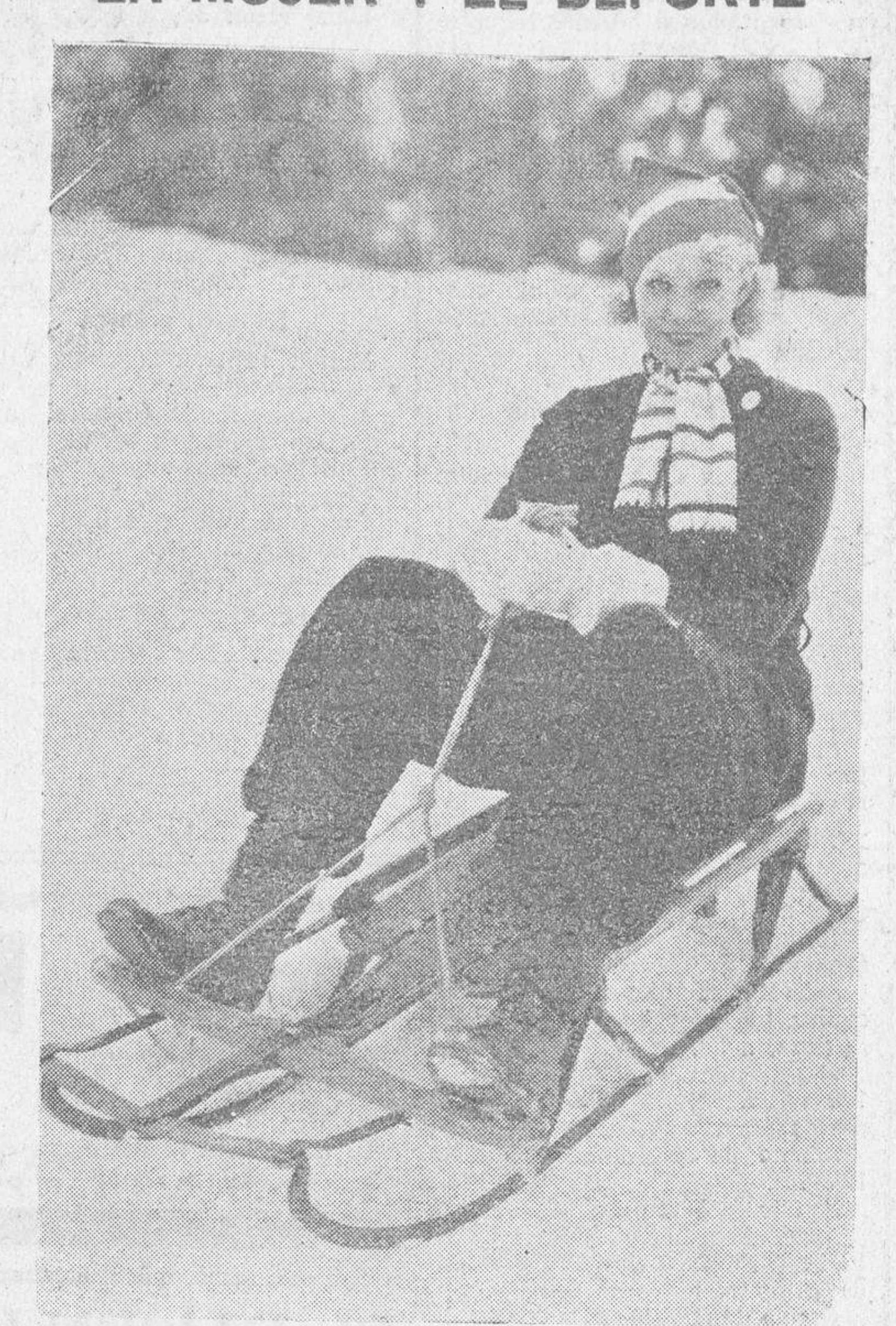
June Knight, artista del cine, lista para tomar parte en la carrera de trineos que se celebró en el lago Arrowhead.