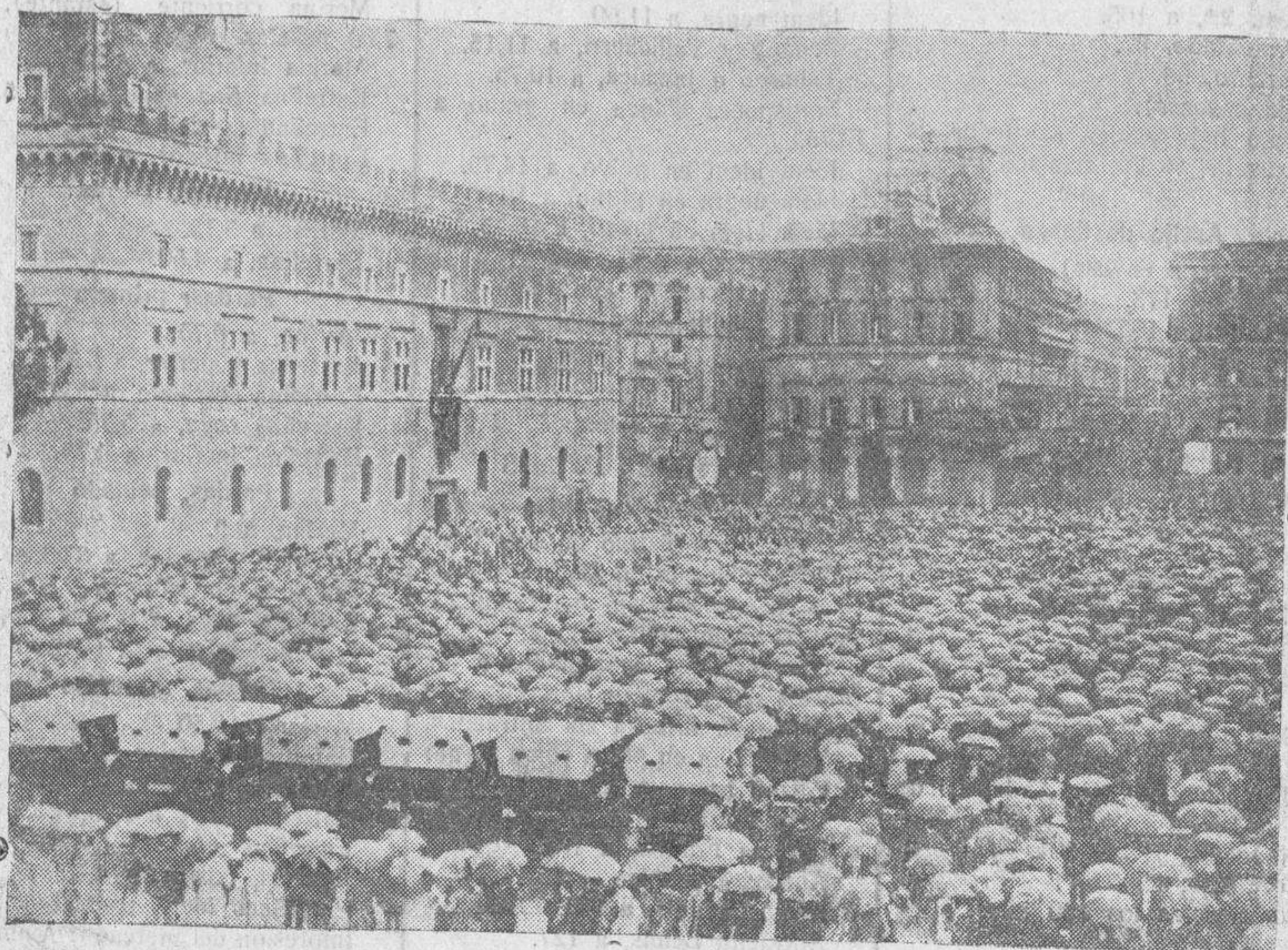
Una vista de la multitud de antiguos combatientes italianos, en la Plaza de Venecia, en Roma, donde Mussolini les arengó, con motivo del diez y seis aniversario de la gran victoria italiana, Vittorio Veneto.—(Foto Llompart).

Necesitan los timoneles prevenirse para sortear las amarguras de la represión. En Francia lo intentan. Inglaterra nos brinda su ejemplo, acreciendo y vigorizando las leyes