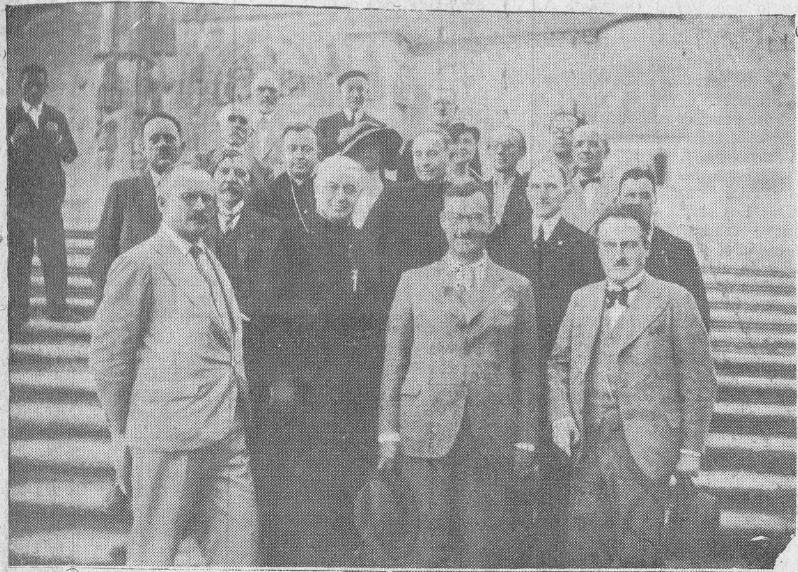
Un grupo de peregrinos franceses