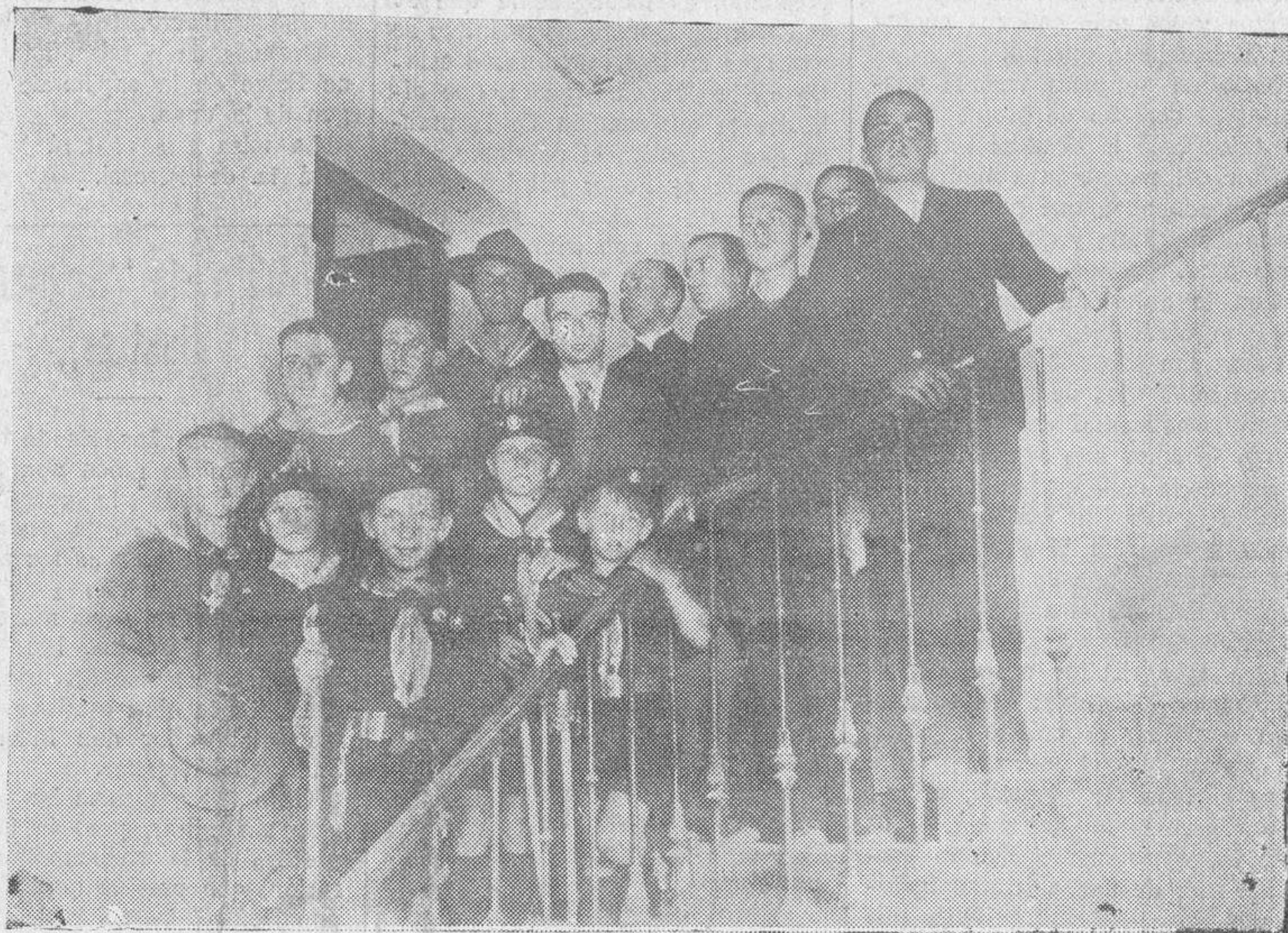
Un grupo de peregrinos españoles