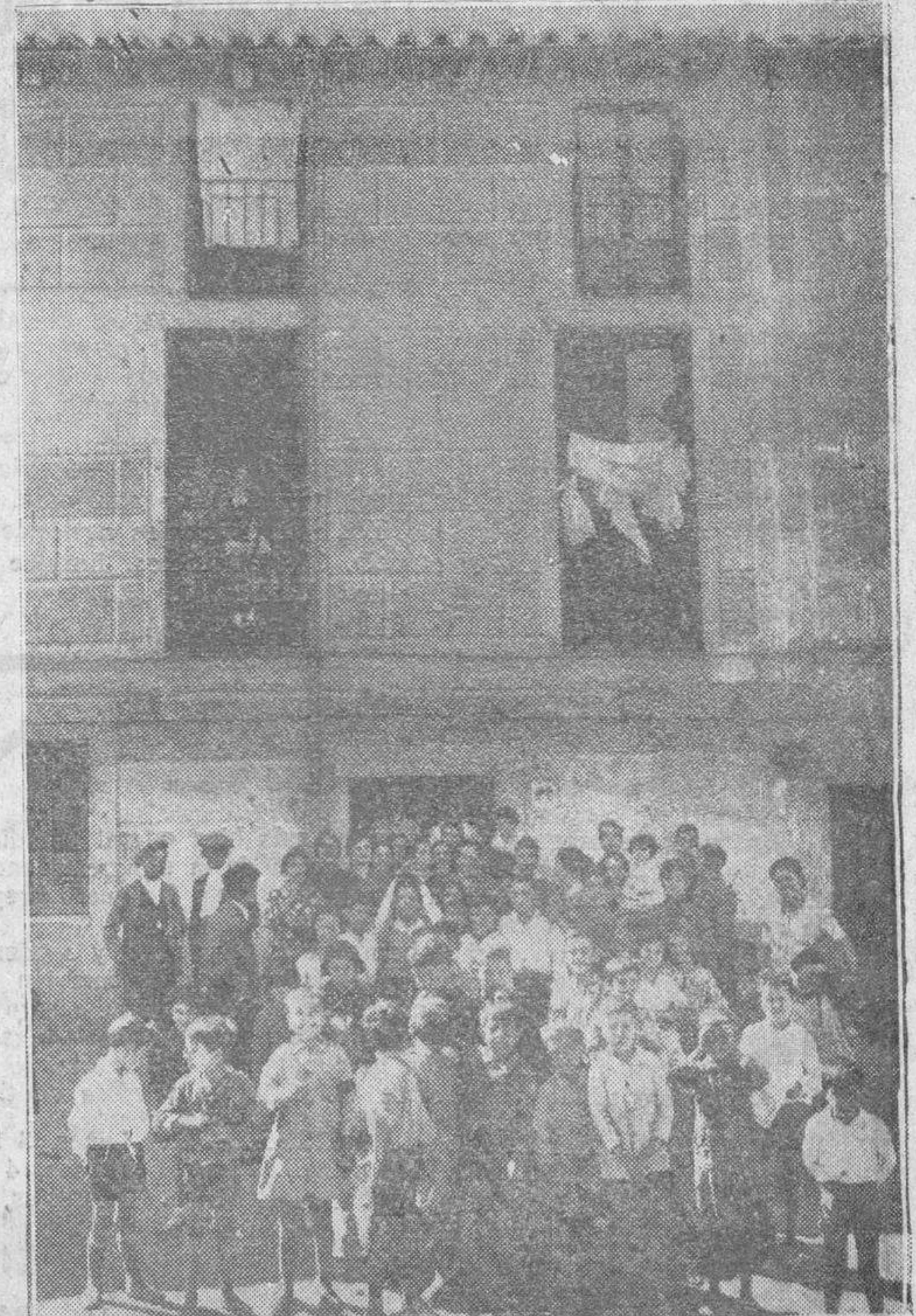
La casa número 6 de la plazuela del Pozo del Campo, en cuya puerta explotó el petardo, cuando jugaban con él unos niños

El agente de Policía, señor Rodríguez, y los guardias municipales, se personaron en la Comisaría,