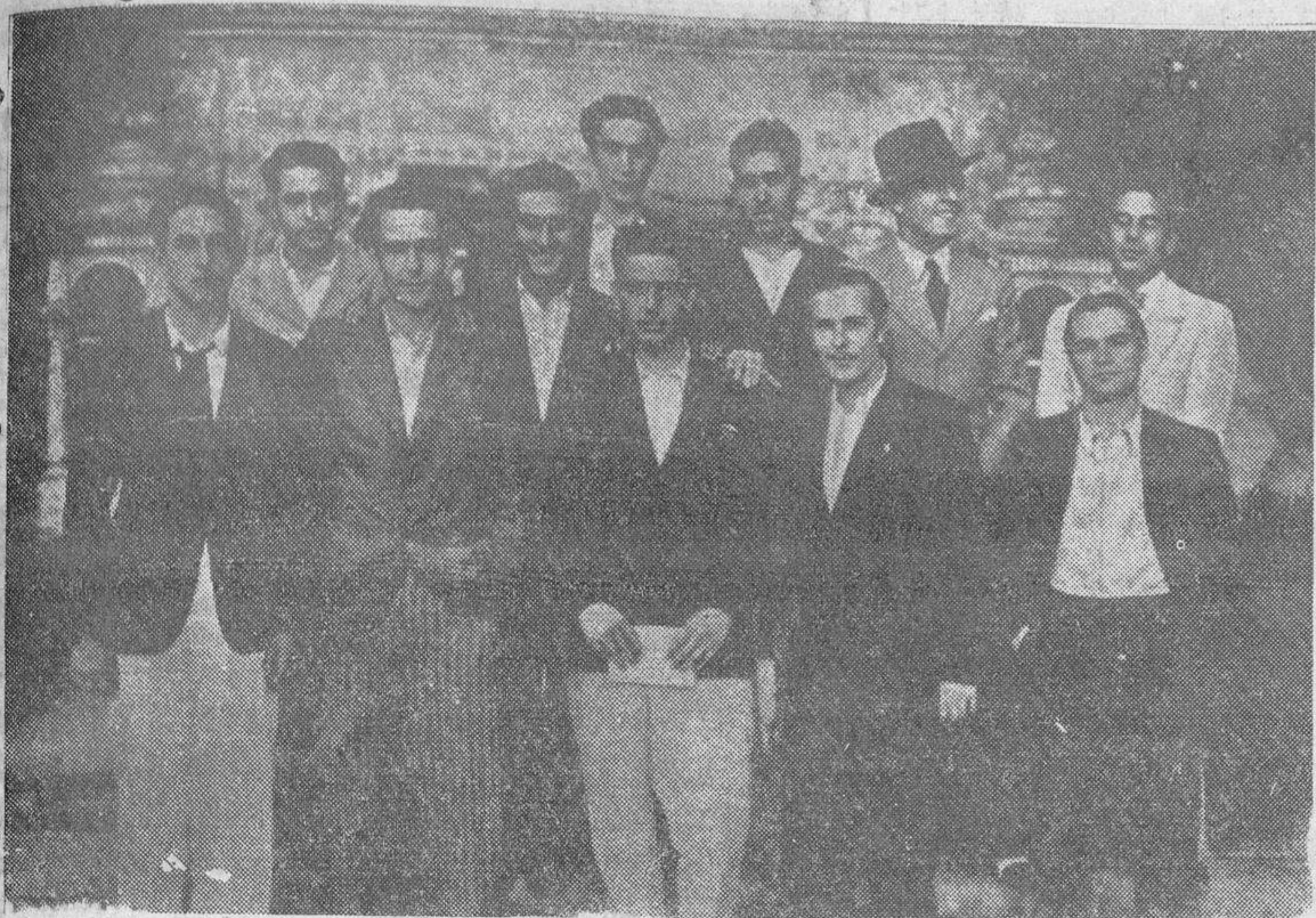
He aquí el grupo de estudiantes sevillanos que han emprendido el camino a Madrid a pie... y sin dinero