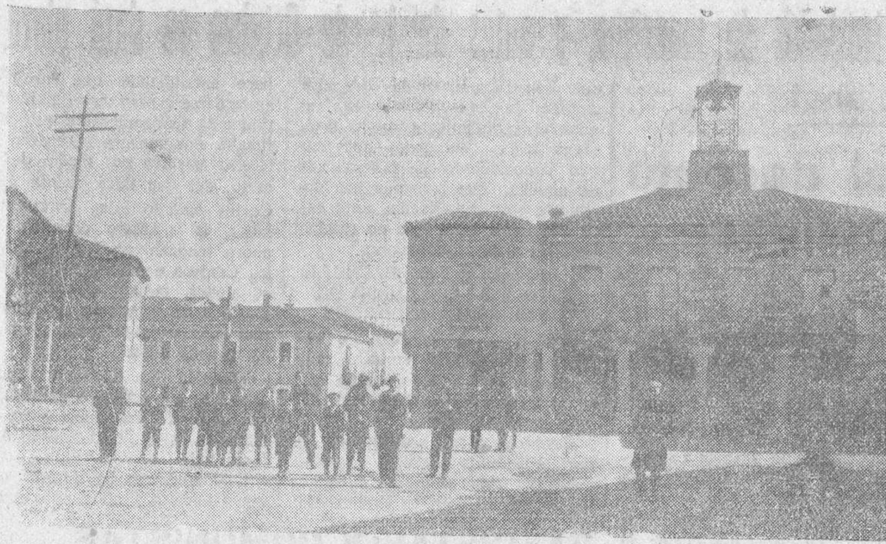
Una vista de la Plaza Mayor de Fuente de San Esteban.

Para embarque de ganados existe toda clase de comodidades en la Estación del Ferrocarril.