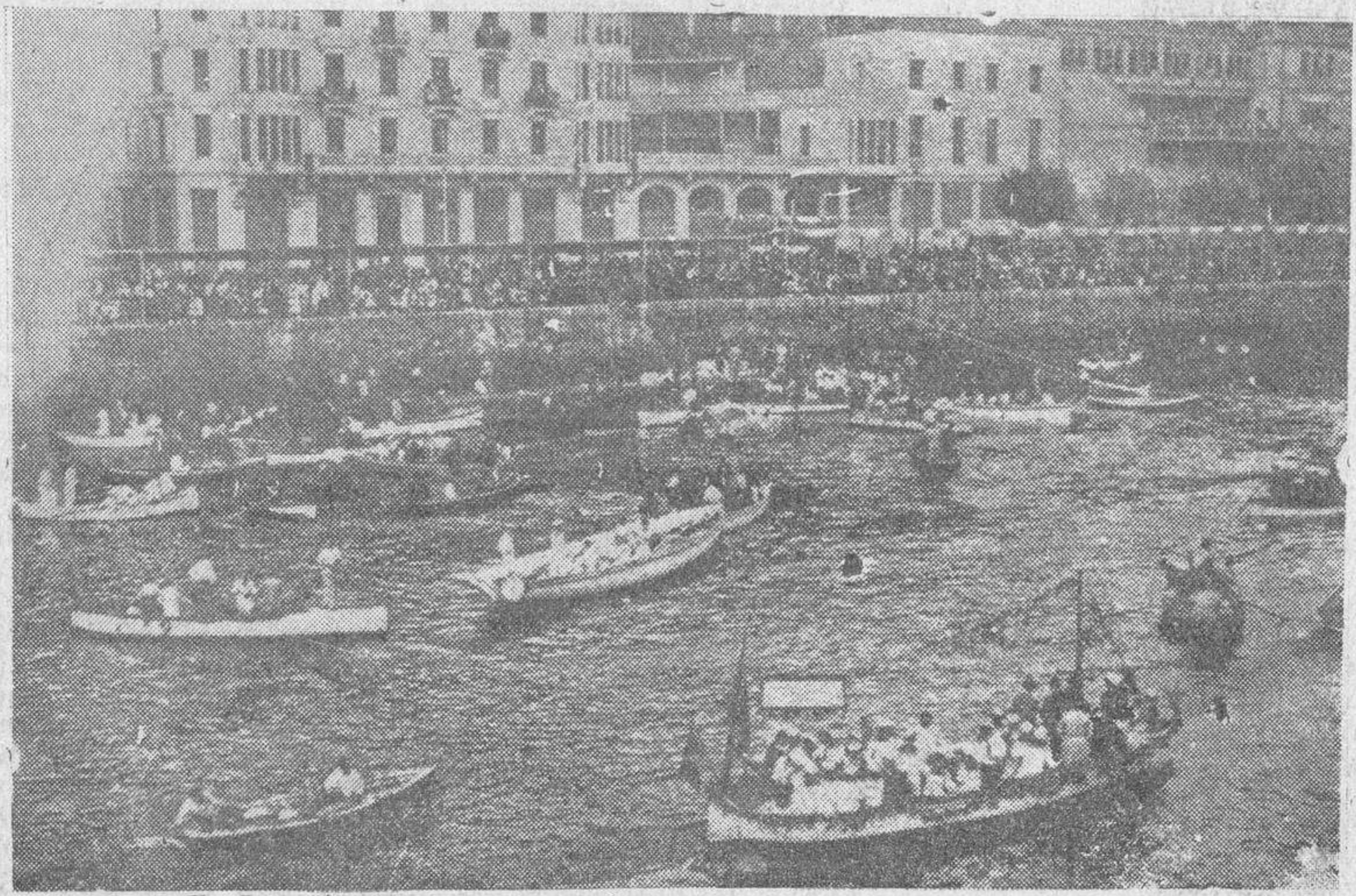
Aspecto que ofrecía la ría de Bilbao, durante la fiesta náutica y la batalla de flores, que tuvieron lugar el domingo con gran éxito