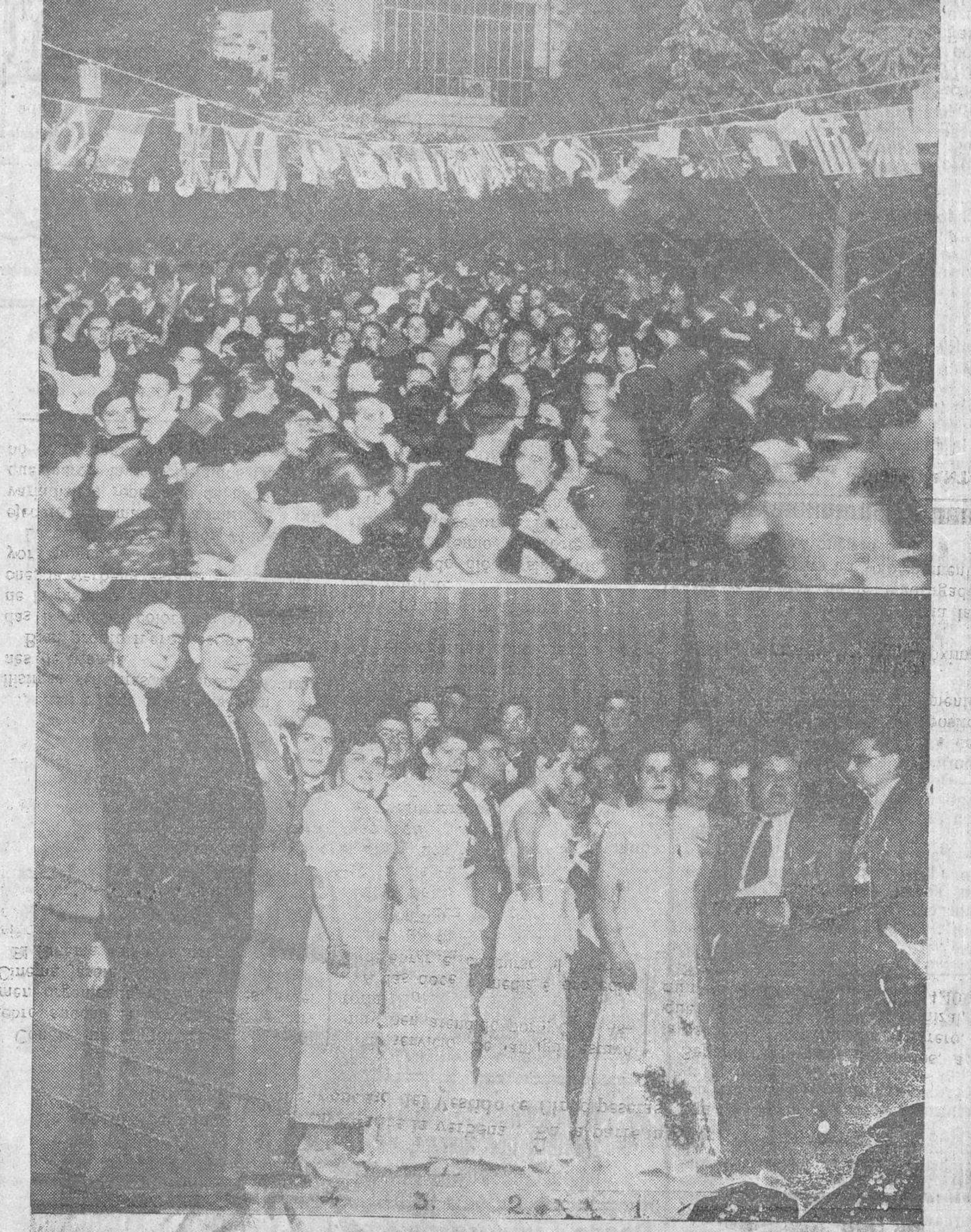
Un aspecto del Cinema Jardín durante la verbena: En la parte inferior, las cuatro señoritas premiadas en el concurso del Vestido de Cinco pesetas, con el Jurado

Elección de «Miss Cinema» y concurso del vestido de cinco pesetas