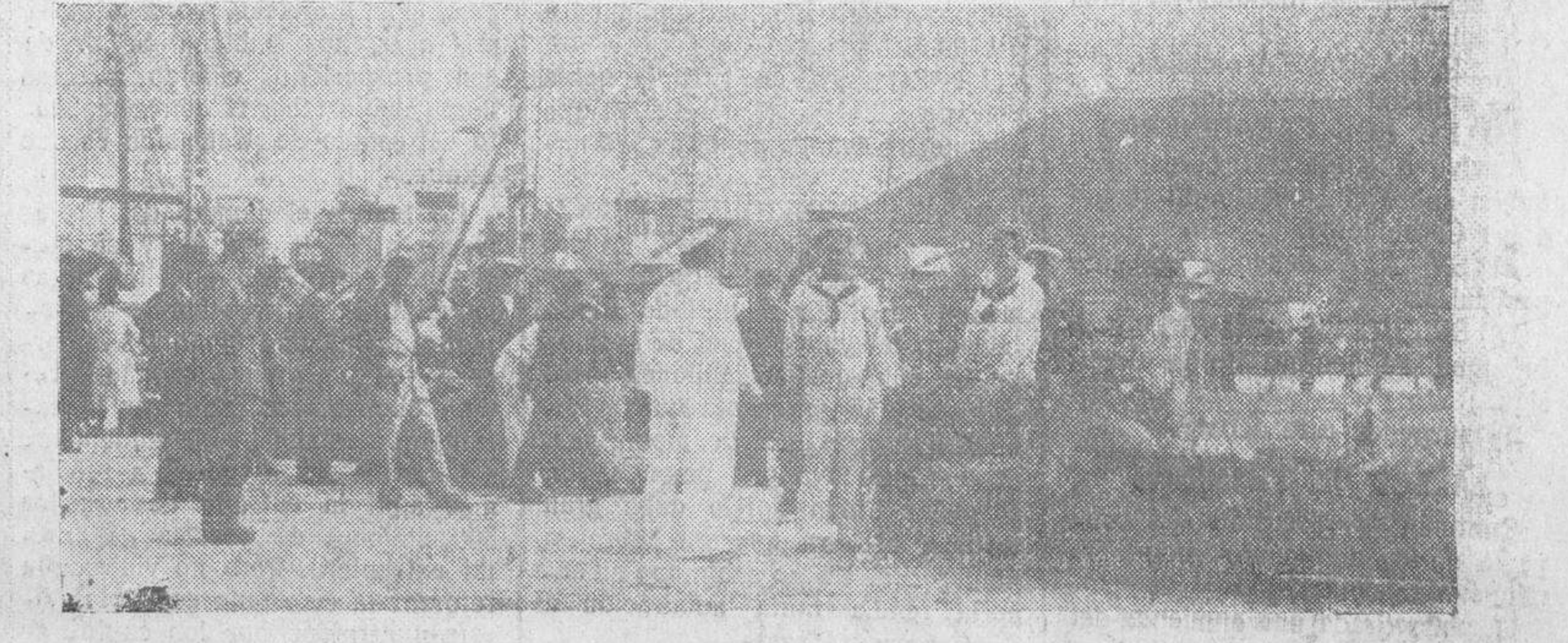
Los marineros y obreros del puerto de Catagenna, acumulando en los muelles los víveres para el abastecimiento de la Escuadra, antes de dar comienzo a las maniobras