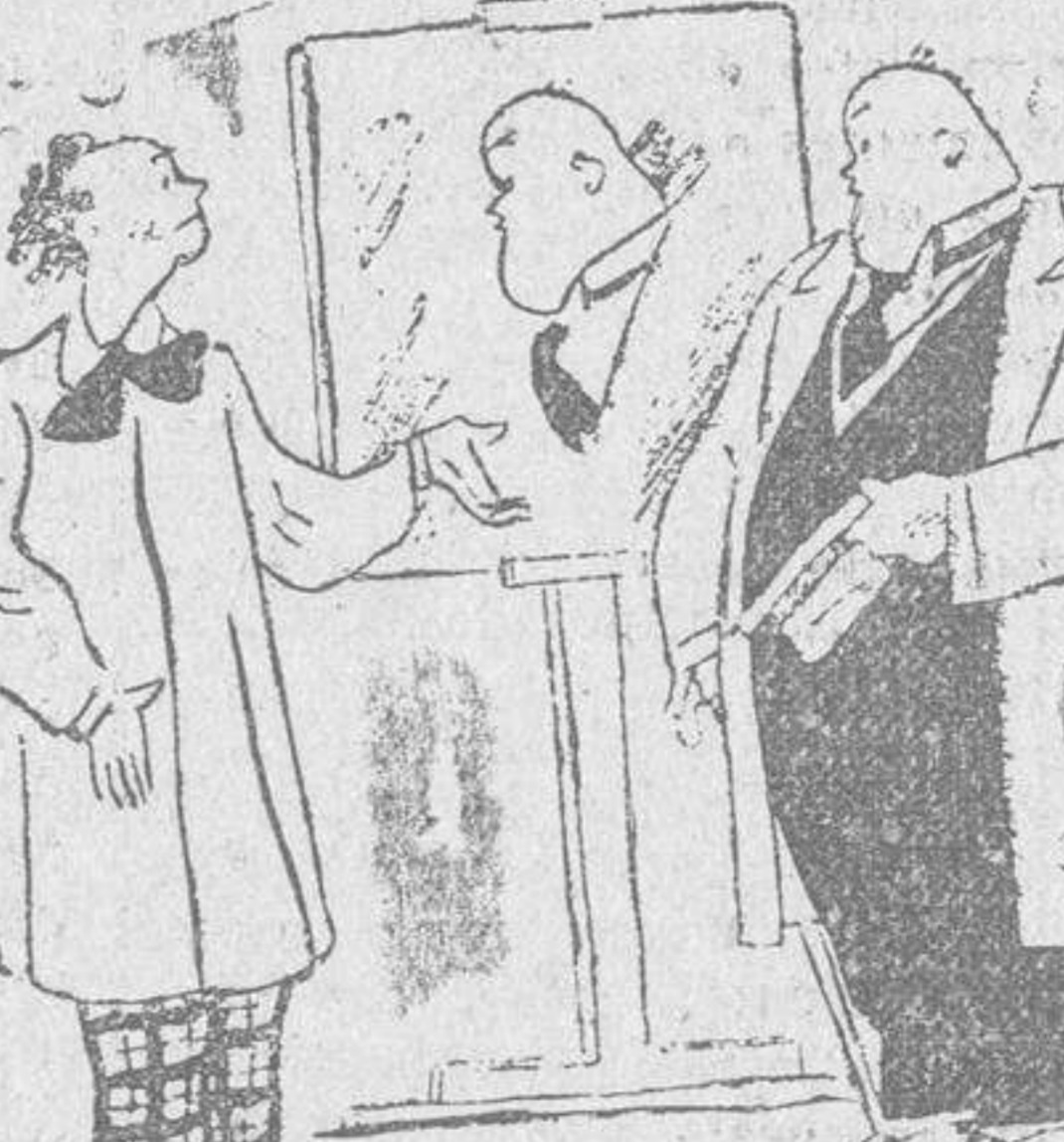
—Si; convengo en que me ha hecho usted mi retrato con gran parecido. Pero le falta vida.

—Entonces, señor mío, si quiere usted vida, son 3.000 pesetas más, ¡La vida está tan cara!