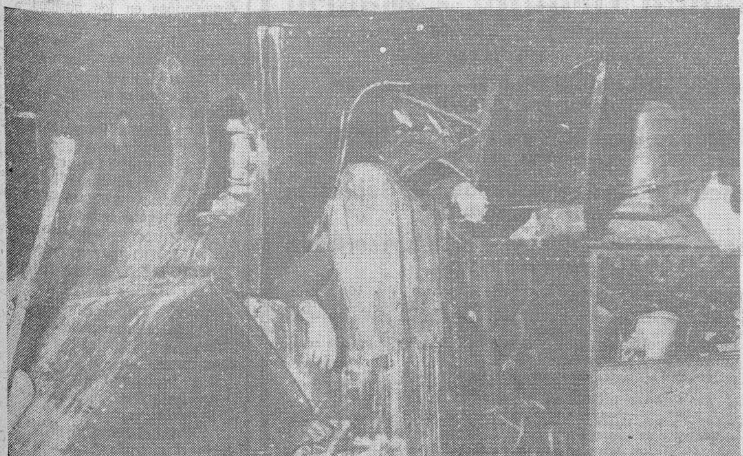
Todo el horror del accidente ferroviario de San Baudilio de Llobregat, en el cual resultaron 12 muertos y 20 heridos gravísimos, aparece en esta fotografía del ténfer de una de las máquinas del cual, al cabo de muchas horas, no había podido retirarse el cadáver del maquinista, aprisionado entre los hierros.