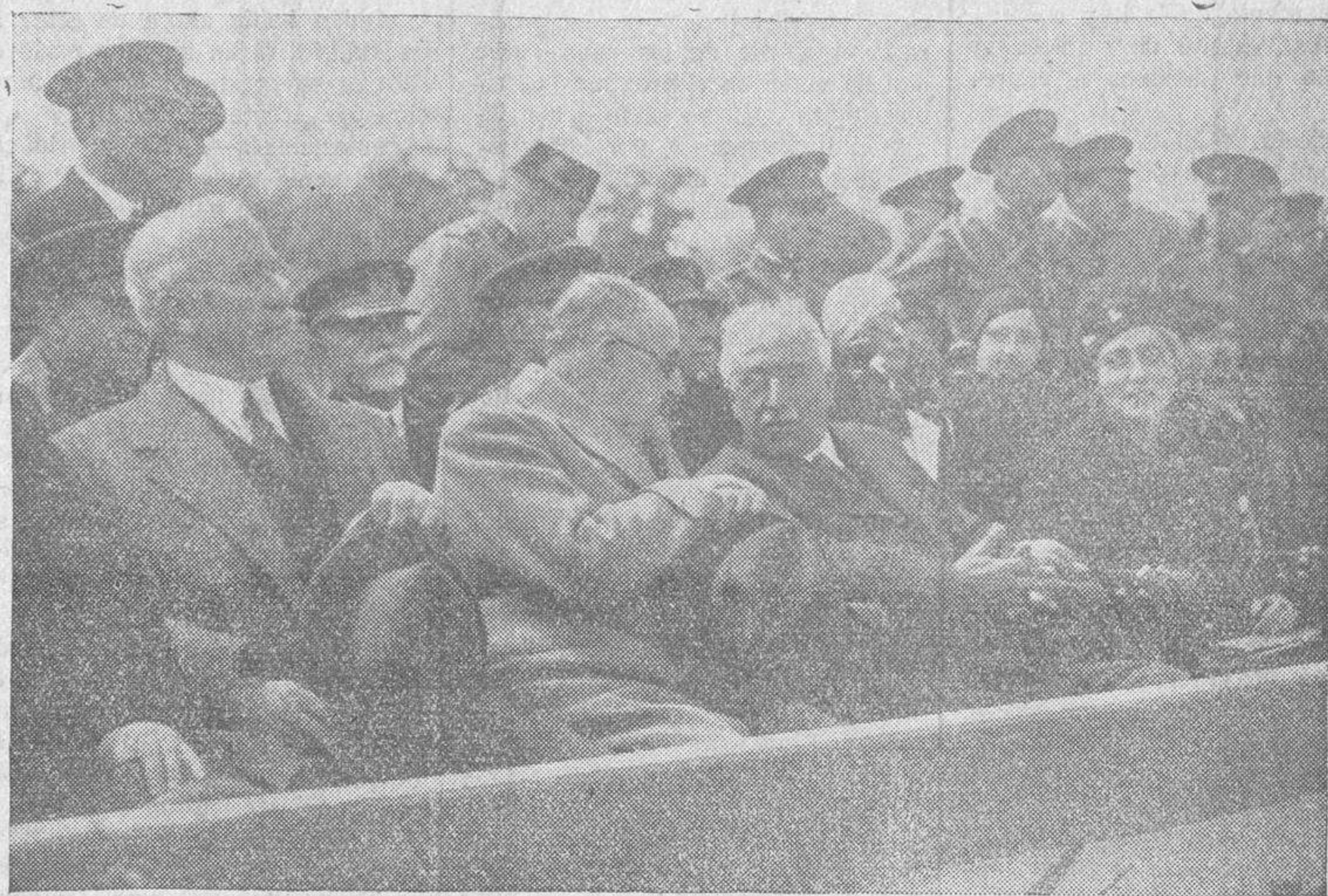
Entrega del "guion" de la escolta presidencial por su donante y madrina, la señora de Alcalá Zamora, con asistencia del Presidente de la República, Gobierno y autoridades militares. El Presidente, su señora y los ministros, presenciando la fiesta desde la tribuna.