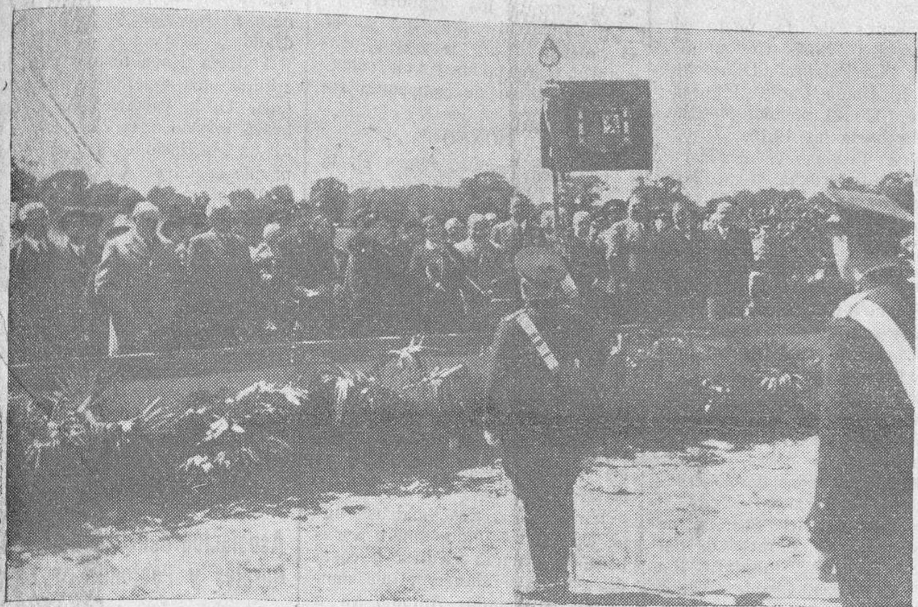
Entrega del "guion" de la escolta presidencial por su donante y madrina, la señora de Alcalá Zamora, con asistencia del Presidente de la República, Gobierno y autoridades militares. El Jefe de la Escolta Presidencial con el "guion" recibido de manos de la señora del Presidente Alcalá Zamora.

Se admiten esquelas hasta las TRES de la madrugada NUMERO SUELTO: DIEZ CENTIMOS