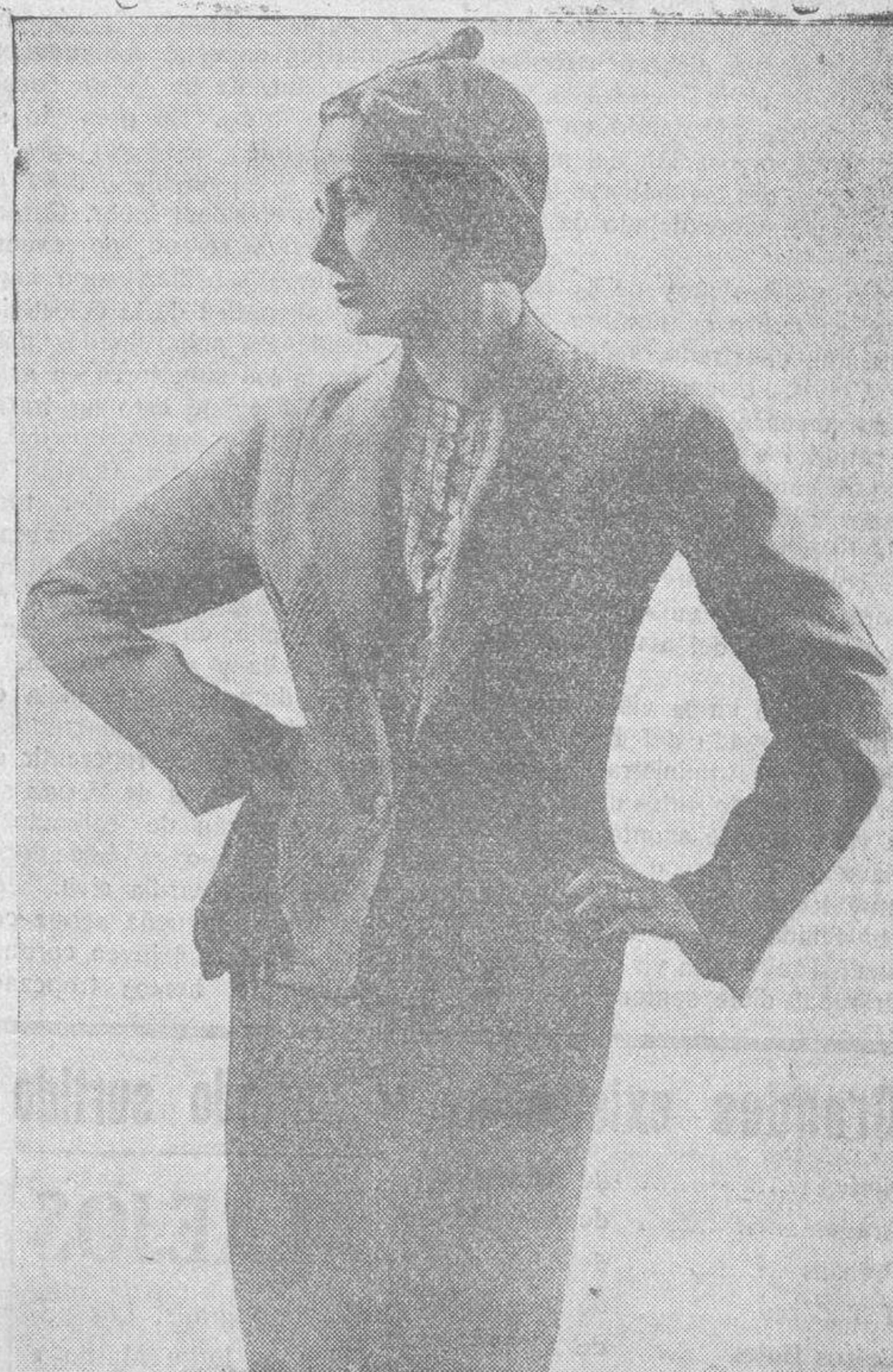
Un bello modelo "tailleur" que une a sus características tradicionales, la de una gracia auténticamente nueva y primaveral

Las conferencias telefónicas diarias de EL ADELANTO con Madrid, tienen, según contrato delabono con la Compañía Nacional Telefónica, un mínimo de duración de UNA HORA, prorrogable.