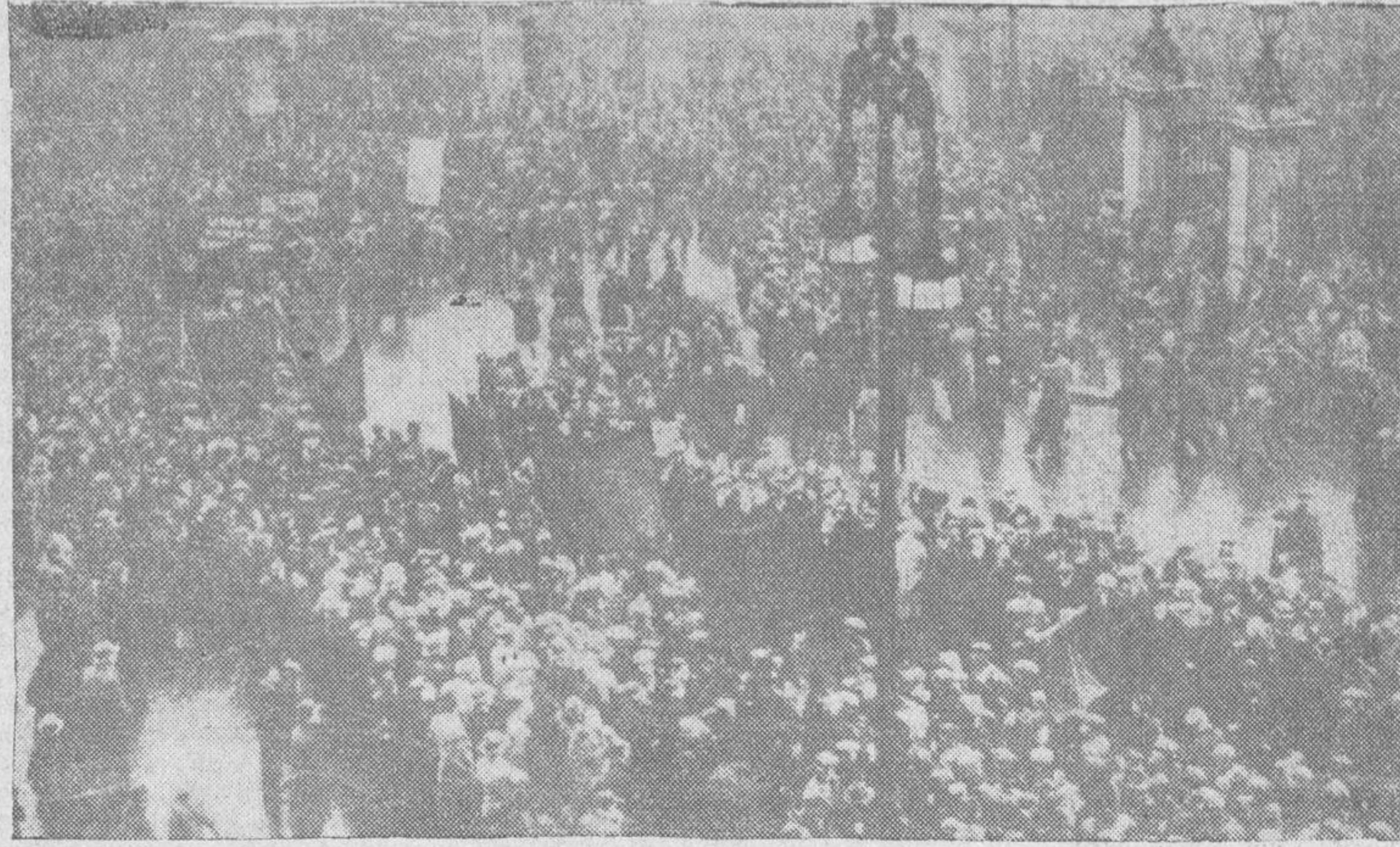
He aquí varios grupos de los "peregrinos del hambre" que, en actitud pacífica, han llegado a Londres, donde trataron de entrevistarse con el jefe del Gobierno, señor Macdonald, el cual les prometió ocuparse de su situación en la Cámara de los Comunes.

que barcos, alguien de la familia dijo: "Los buques son su pasión favorita... una "mania", a lo que el autor de la ley de relatividad, que no sabe inglés, como mister Roosevelt ignora el alemán, hubo de contestar, ingenuamente, por medio de su esposa, que oficiaba de intérprete: —Pues a mí me ocurre lo mismo. Eso de navegar a la vela es mi mayor encanto; una verdadera "mania" como la del Presidente.