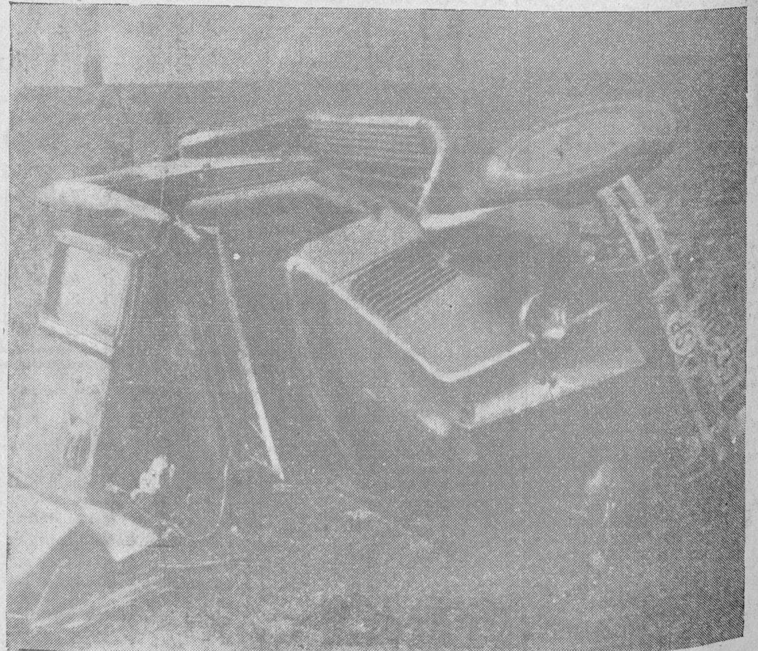
Estado en que quedó un automóvil que cayó por un terrapién de cinco metros, en la carretera de Badajoz a Madrid, y cuyos ocupantes resultaron gravemente heridos.