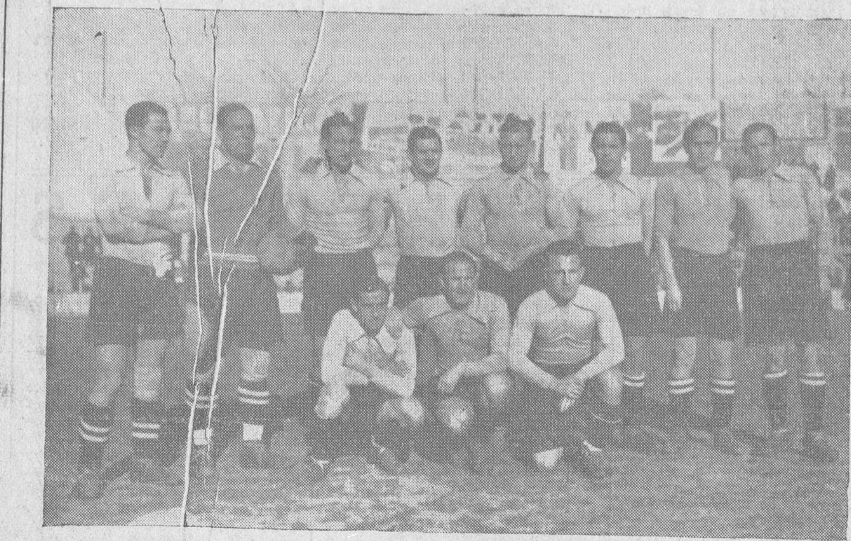
La selección española que jugará contra Portugal el 11 de Marzo, en Madrid, la Copa del Mundo.

Suponiendo que España no fuera, como es, país productor de plata, y que pudiera, como parece que puede, traer mineral del Brasil, propiedad de capitalistas españoles, y desplatarlo en España con beneficio, acontecería siempre que un yanqui, para comprar una moneda de un duro en España, necesitaría pagar a su cambista o banquero girador 66,0663 centavos. Como el duro, convertido en mercancía plata, y arrojado al crisol, no le valdría más que 46,575 centavos, es evidente que perdería en cada duro que importara, una suma cuantiosa: 19,4913 centavos por cada duro, o sea 190.000 dólares en cada millón de duros importados en los Estados Unidos, aparte los gastos de conducción, de comisionaje y de giro.