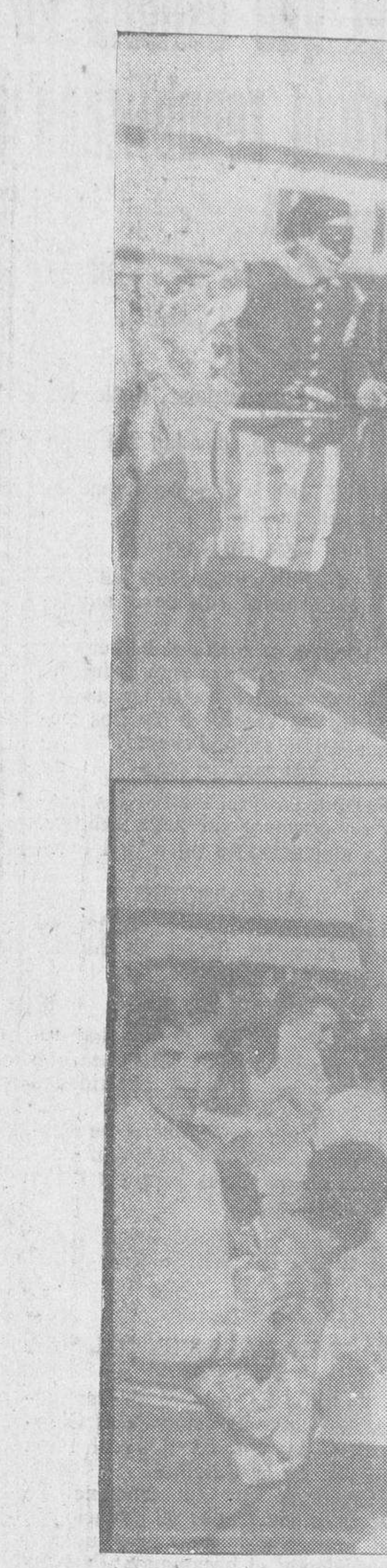
Dos aspectos del Carnaval en Salamanca

La fiesta más brillante de Carnaval, fué desde luego, la gran cena americana, celebrada anoche en nuestro primer Centro de Sociedad,