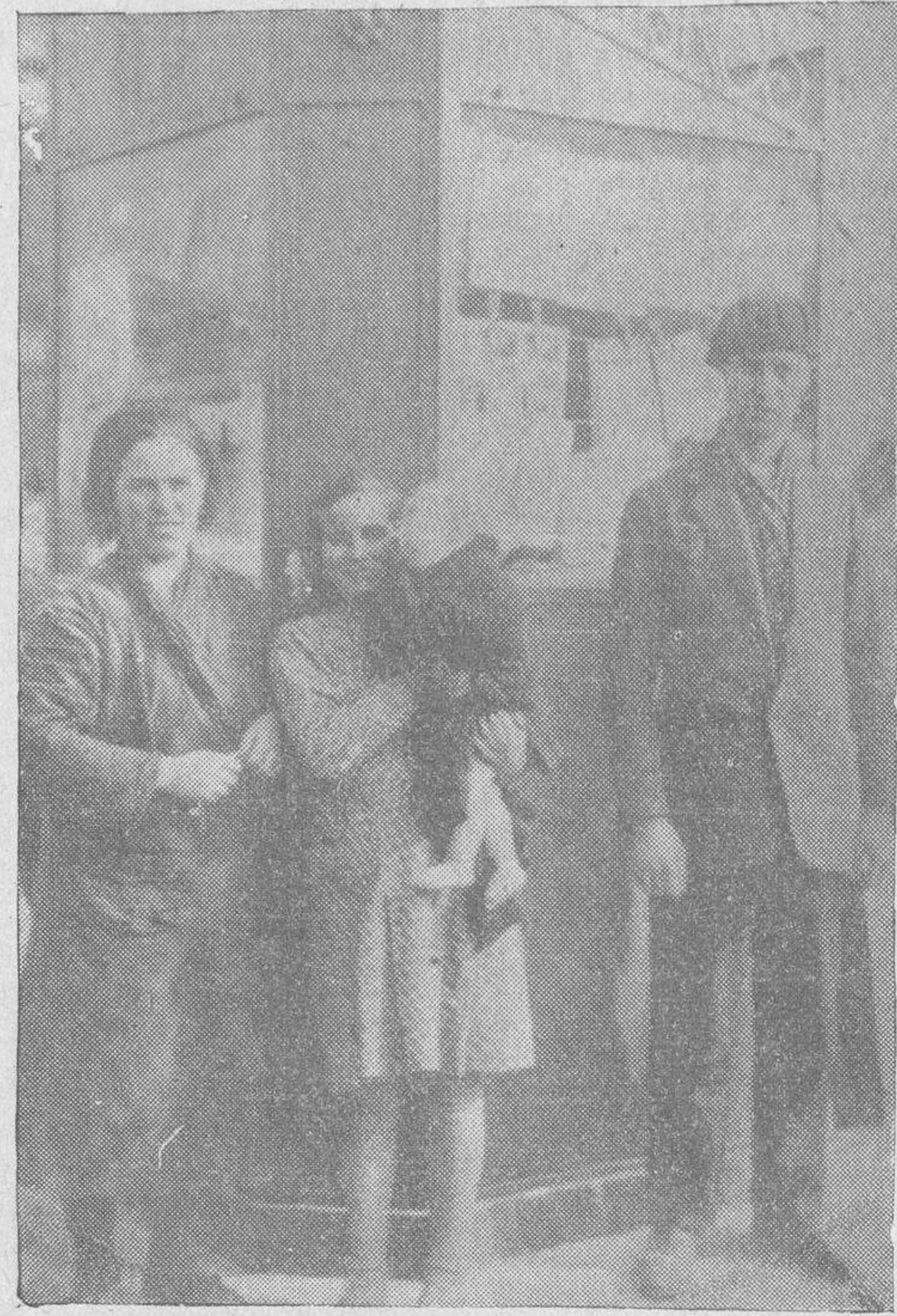
El kiosco donde ha sido vendido el premio segundo y los vendedores del mismo