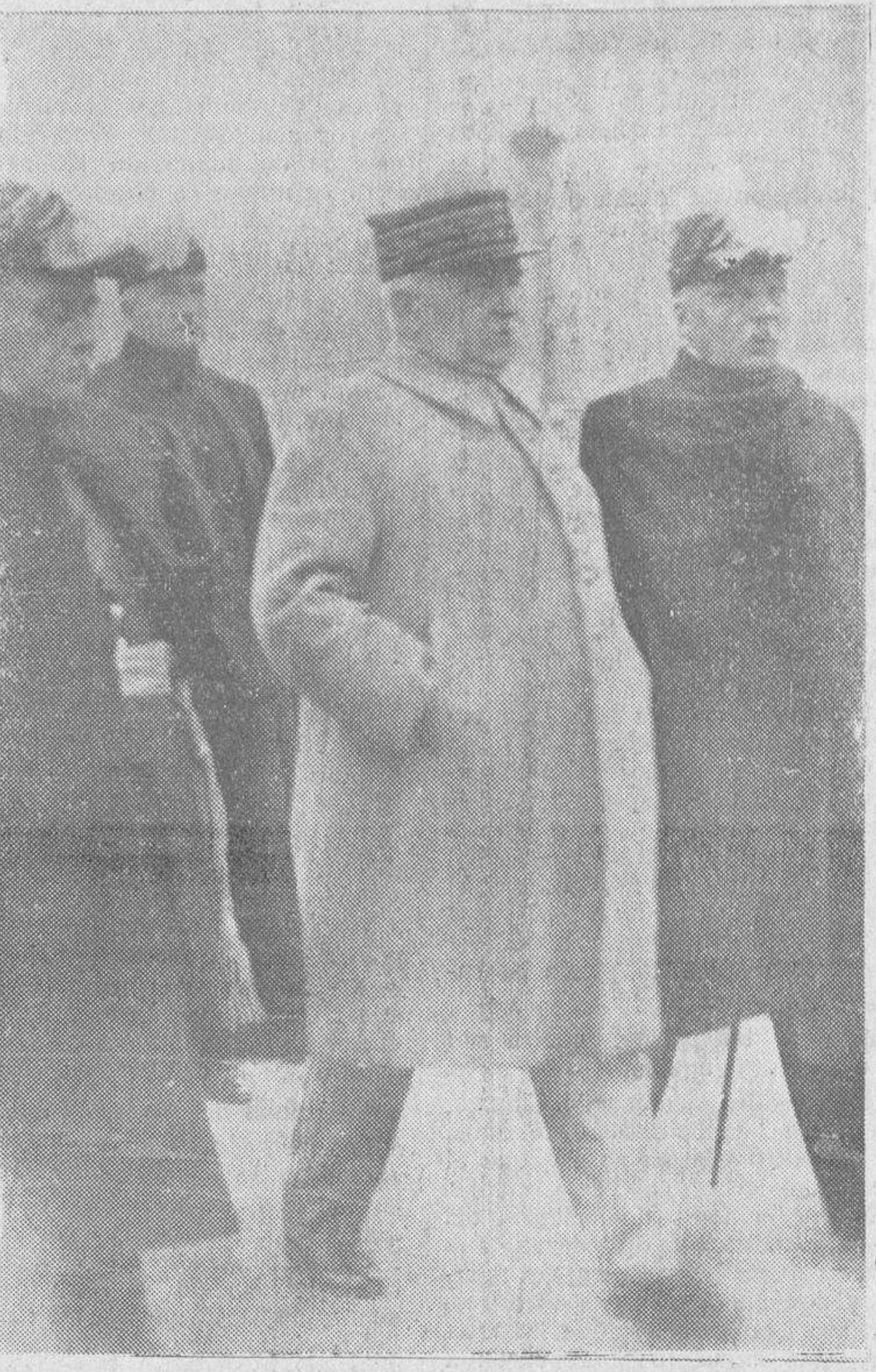
Ha sido nombrado Gran Canciller de la Legión de Honor, el general Nollet (en el centro), antiguo jefe de los ejércitos aliados en Rhenania, retratado cuando está en los funerales de su predecesor el general Dubail