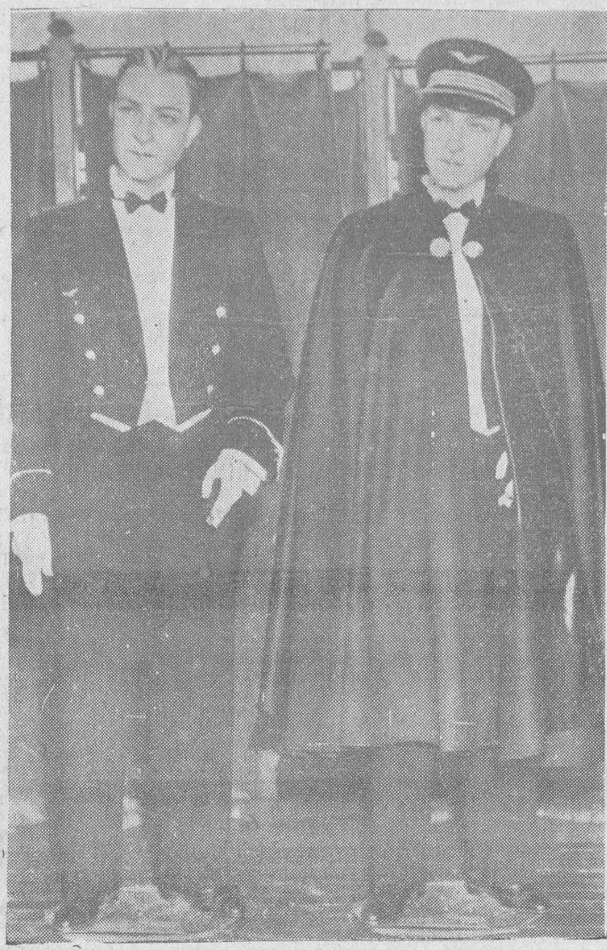
Los oficiales de la aviación francesa, tienen un nuevo uniforme de gala, que no tenían hasta ahora. Llevarán el traje de forma recta, de color azul y el chaleco blanco cruzado. Este traje es completado con una capa de paño azul marino

—Pero hay otra obra en puerta. —¿Cuál es? —Una gran estación, garage para los coches de línea.