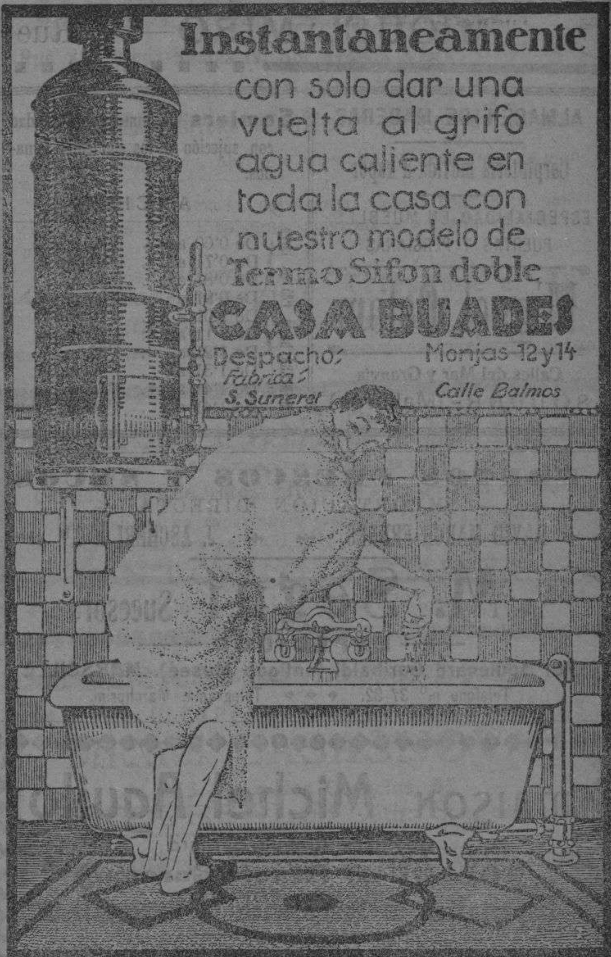
ARTE GRAFICO - PALMA