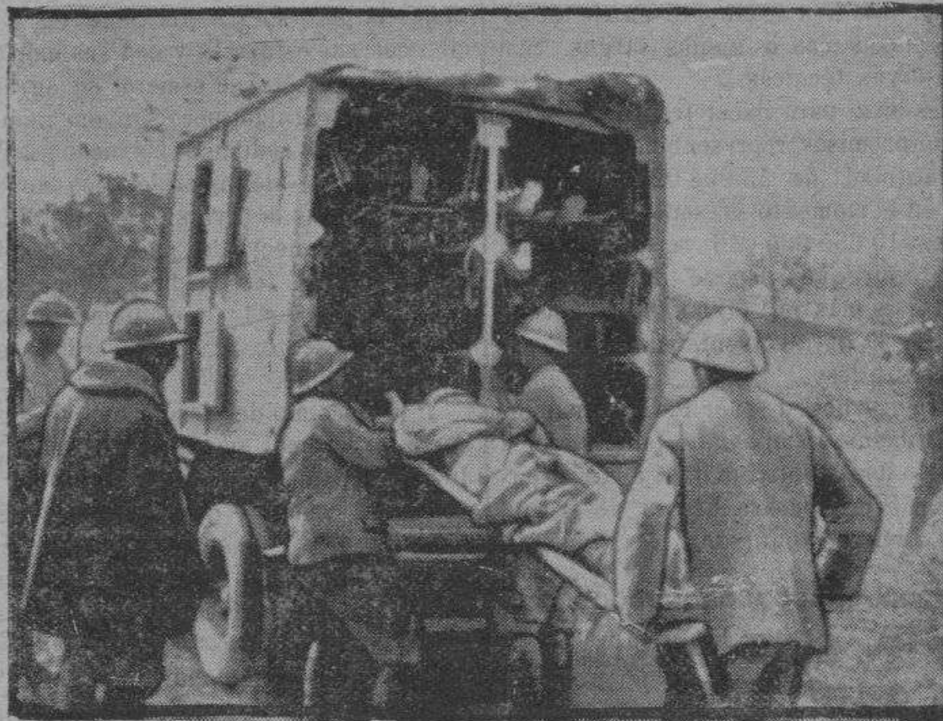
Transporte de heridos por ambulancias automóviles

expone lo que hace al caso, para que ella juntamente con sus padres decidan lo que crean oportuno.