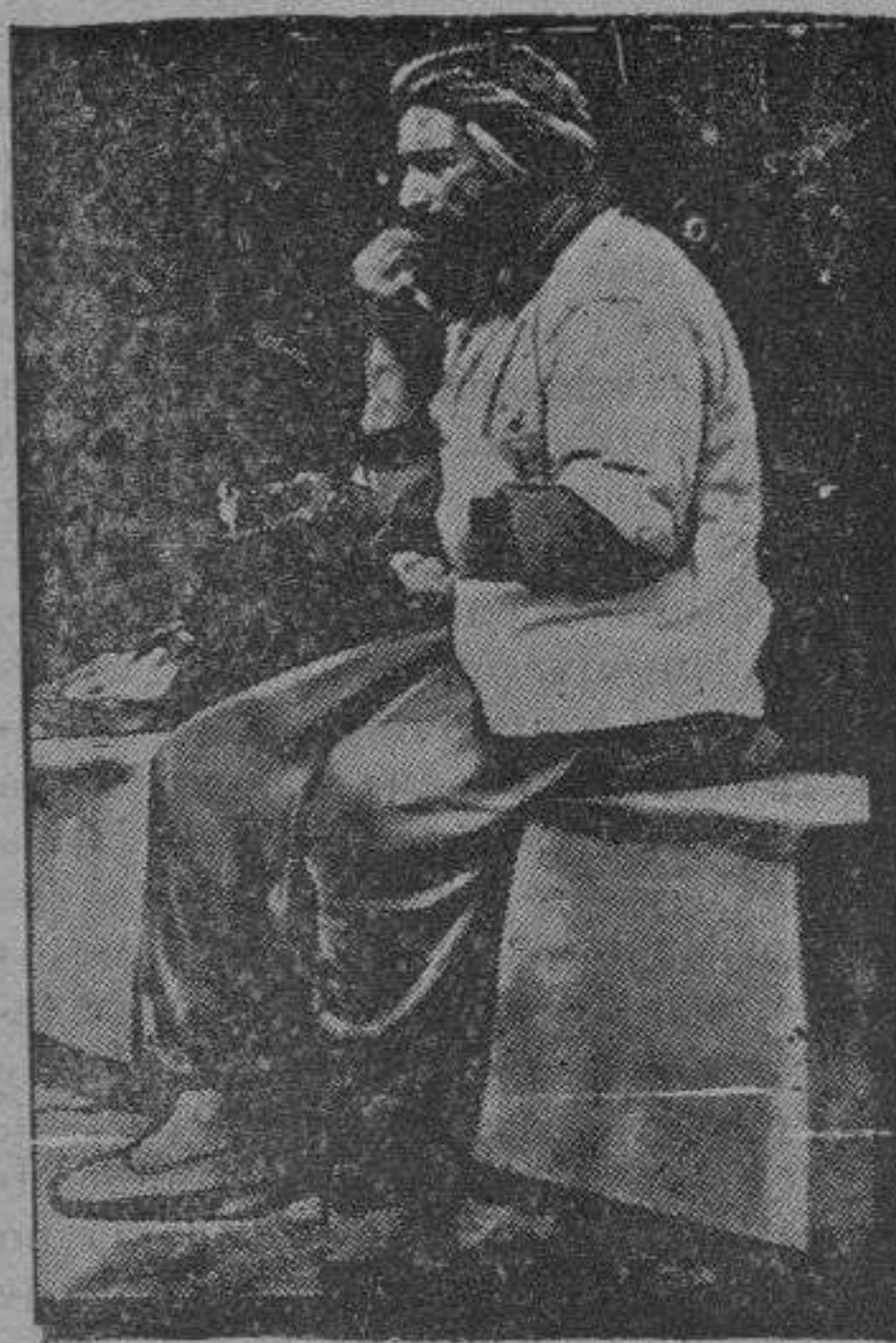
La bandera servia marcha hacia Servia