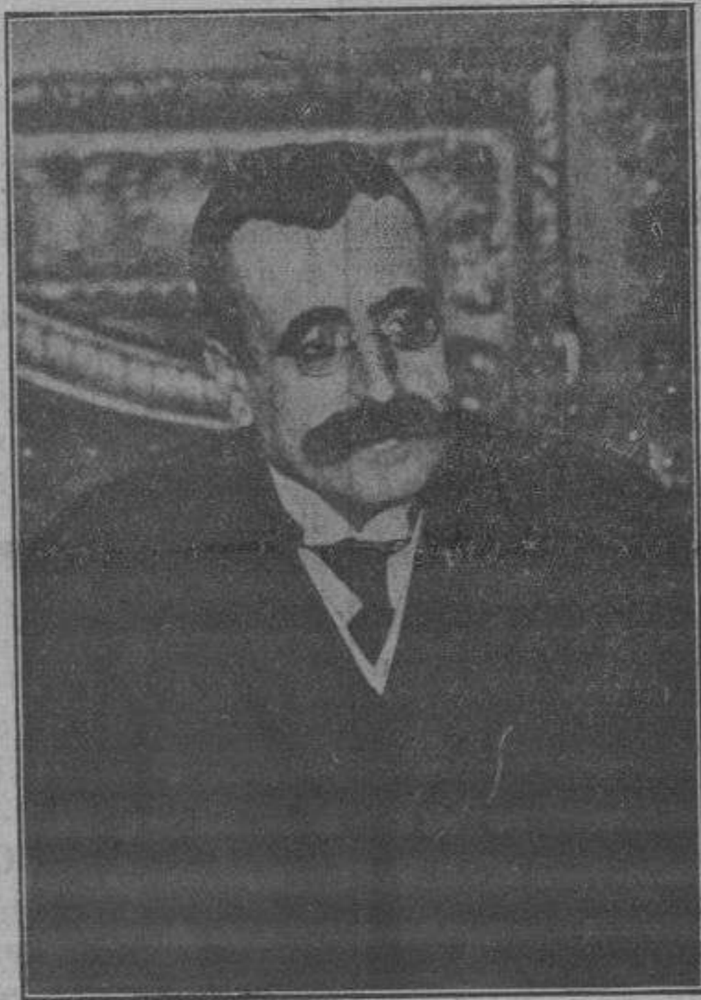
Excmo. Sr. D. José Canalejas y Méndez