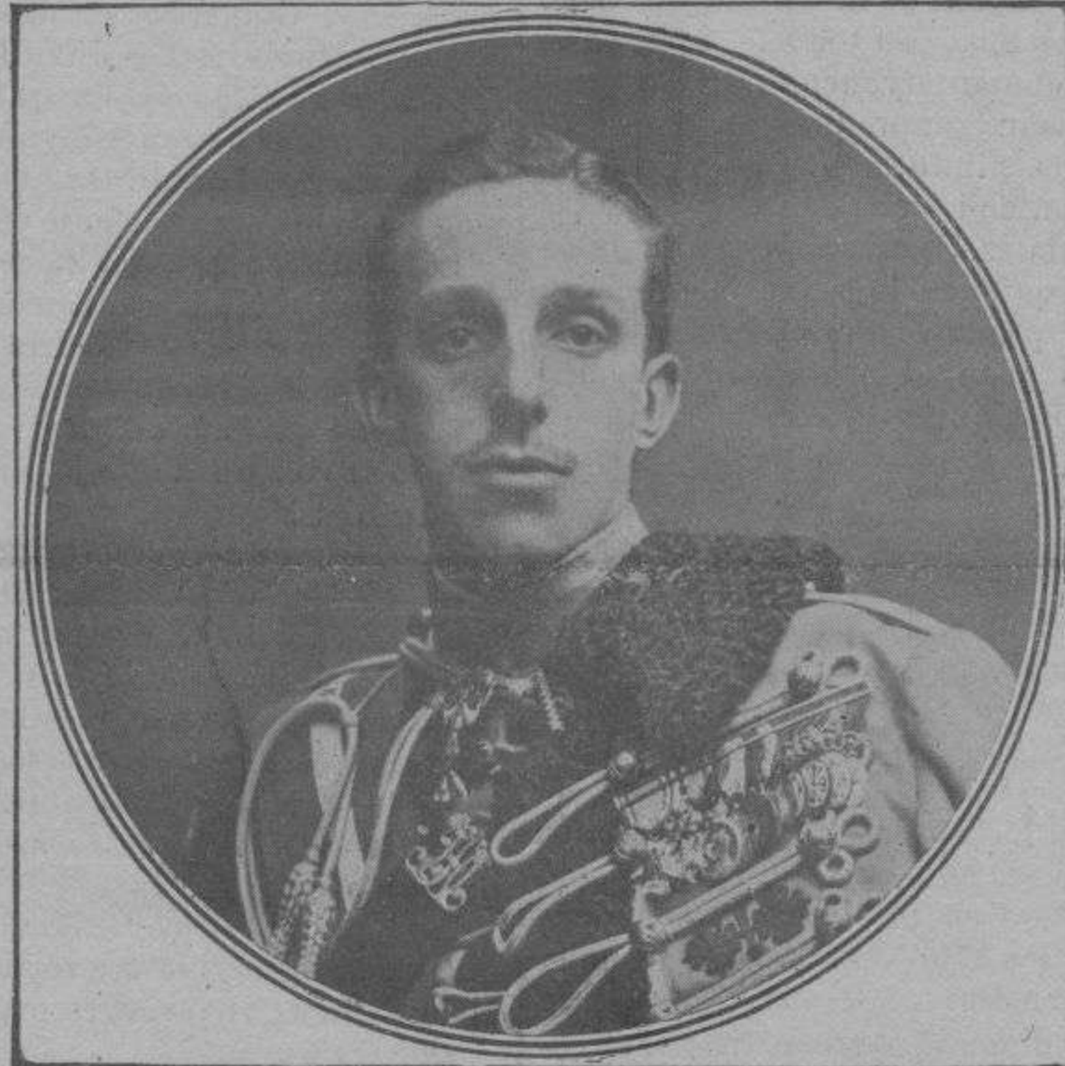
S. M. EL REY D. ALFONSO XIII, cuyo generoso rasgo de piedad ha conmovido a España entera.

Estando, pues, uno de los jilgueros en la copa del pino, vió de pronto, allá a lo lejos, que el sol se reflejaba con chispazos de plata en una porcióncita de agua límpida y tentadora. Por más que alambicara mis palabras, no podría dar idea exacta de como debió brincar de alegría el corazoncillo del avecica, ni de como temió después que sus compañeros le quitaran el usufructo de su agua, fresquita y clara. Afortunadamente, no sucedió así. Los demás jilgueros se encaminaron al charco para saciar su sed y para refocilarse entre los escaramujos. Entonces nuestro pajarillo clavó sus ojuelos en el agua lejana, y, extendiendo sus alitas, que abiertas parecían dos diminutos abanicos de oro y carbón, empezó a volar con todas sus fuerzas. Más de cuatro veces tuvo que detenerse para cobrar aliento, y si él tratara de negarlo, ya se encargarían de desmentirlo las vi-