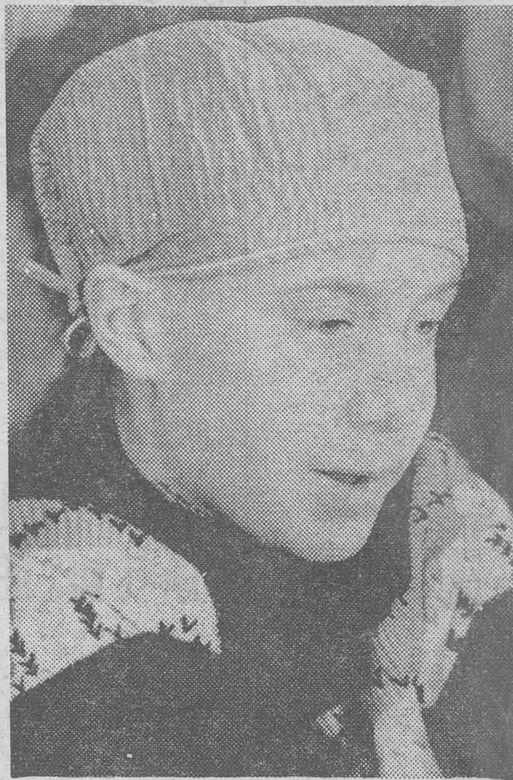
Tras una difícil operación de psicocirugía, en la que fue necesario extirpar parte del cráneo, esta joven norteamericana puede sonreír con confianza.