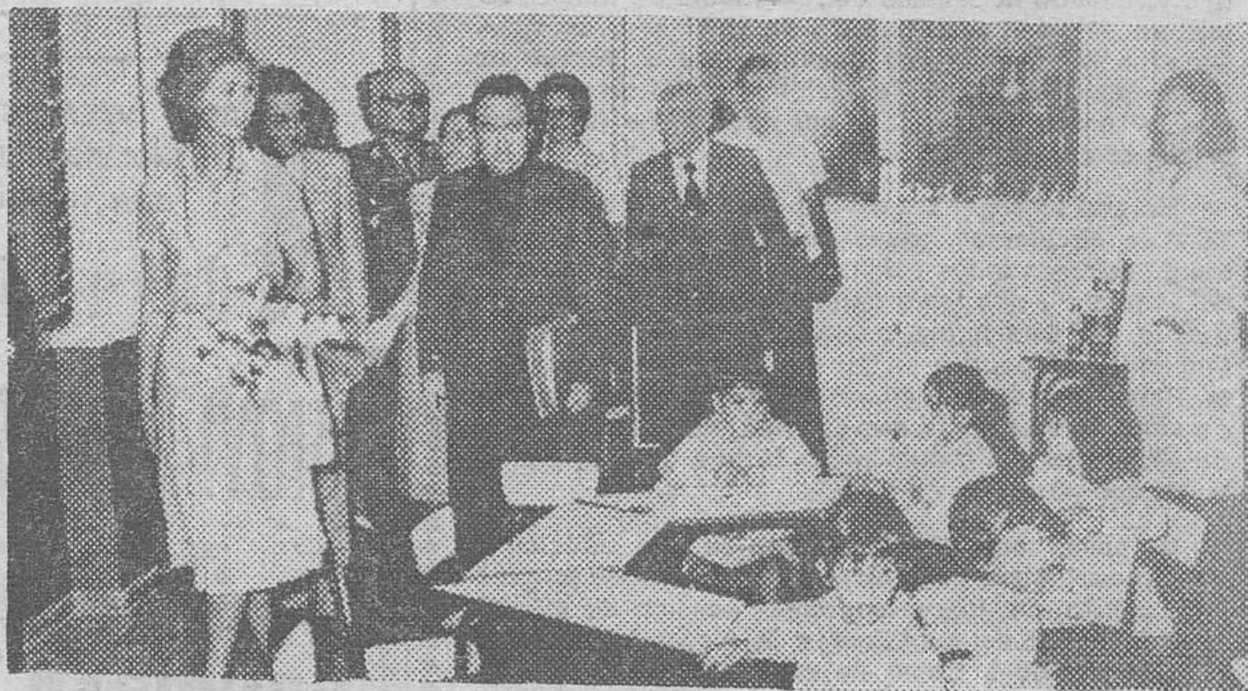
Palma de Mallorca. — Su Majestad la Reina, doña Sofía, inauguró en Palma de Mallorca la guardería infantil "Son Gotleu". En la foto, la Reina visita las instalaciones, tras la inauguración.