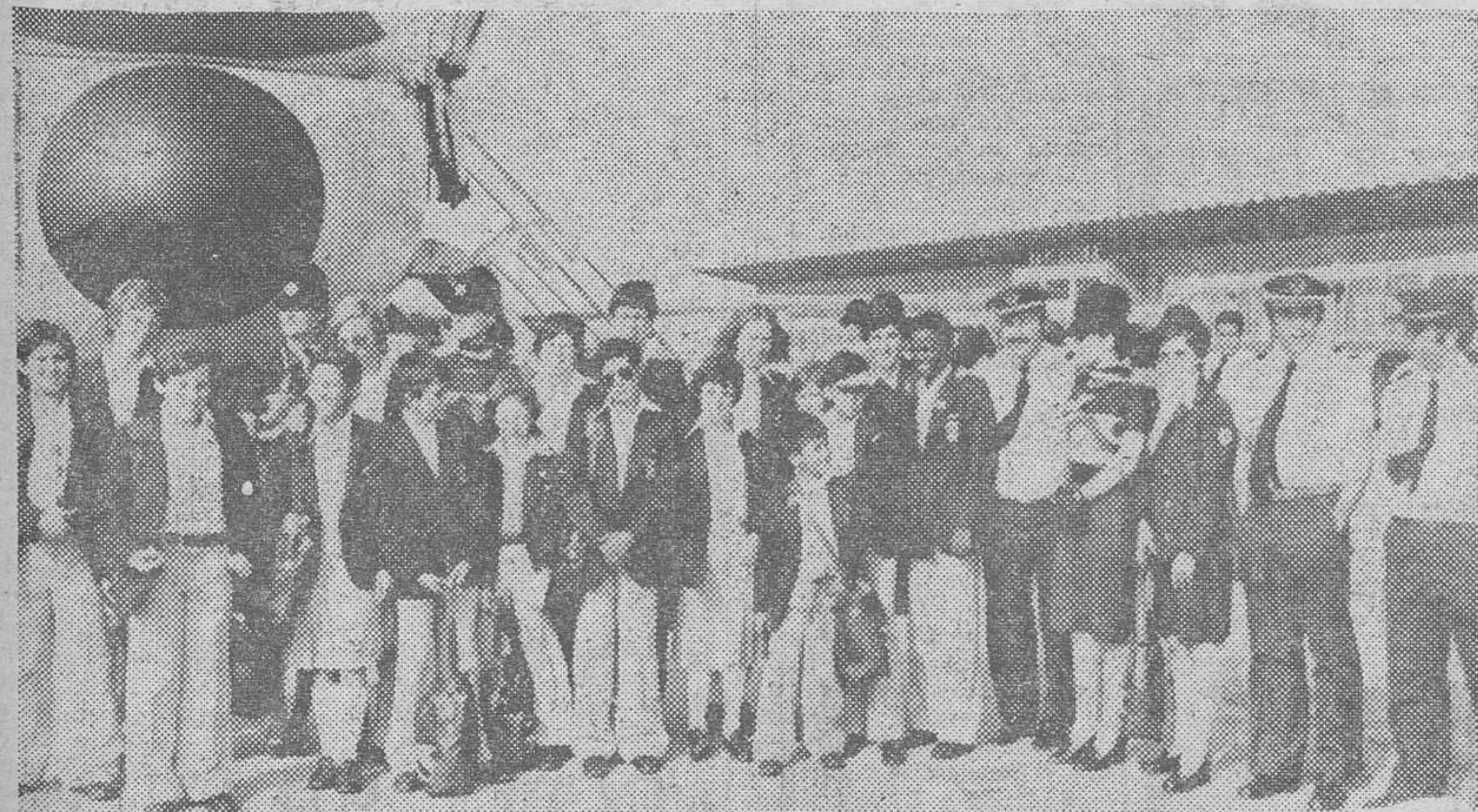
Barcelona. — Los pequeños que toman parte en la «Operación Plus Ultra» 1976, fotografiados a su llegada al aeropuerto barcelonés de Prat del Llobregat. — (Telefoto CIFRA GRAFICA).

EMPRESA IMPORTANTE DE PORTEROS AUTOMATICOS. PRECISA REPRESENTANTE