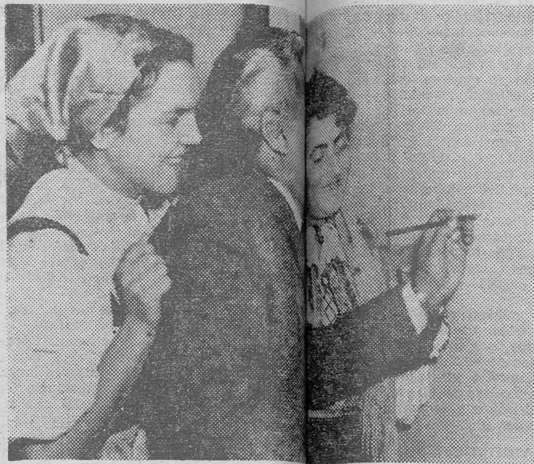
El poeta cubano Nicolás Guillén dibuja en la pared de un Instituto de la izquierda, una figura autógrafa.

Cinco escritores latinoamericanos figuran como candidatos al Premio Miguel de Cervantes, el mejor dotado en todo el ámbito geográfico de nuestra lengua, con cinco millones de pesetas. Se trata de Eduardo Carranza, presentado por la Academia de la Lengua de Colombia; Jorge Carrera Andrade, por la Academia Ecuatoriana; José del Carmelo Saavedra Espino, por la Academia Panameña; Juana de Ibarburu, por la Academia Uruguaya, y Jorge Guillén, que ha sido presentado por dos Academias, la Española y la Argentina, colocándose como el más firme candidato al premio.