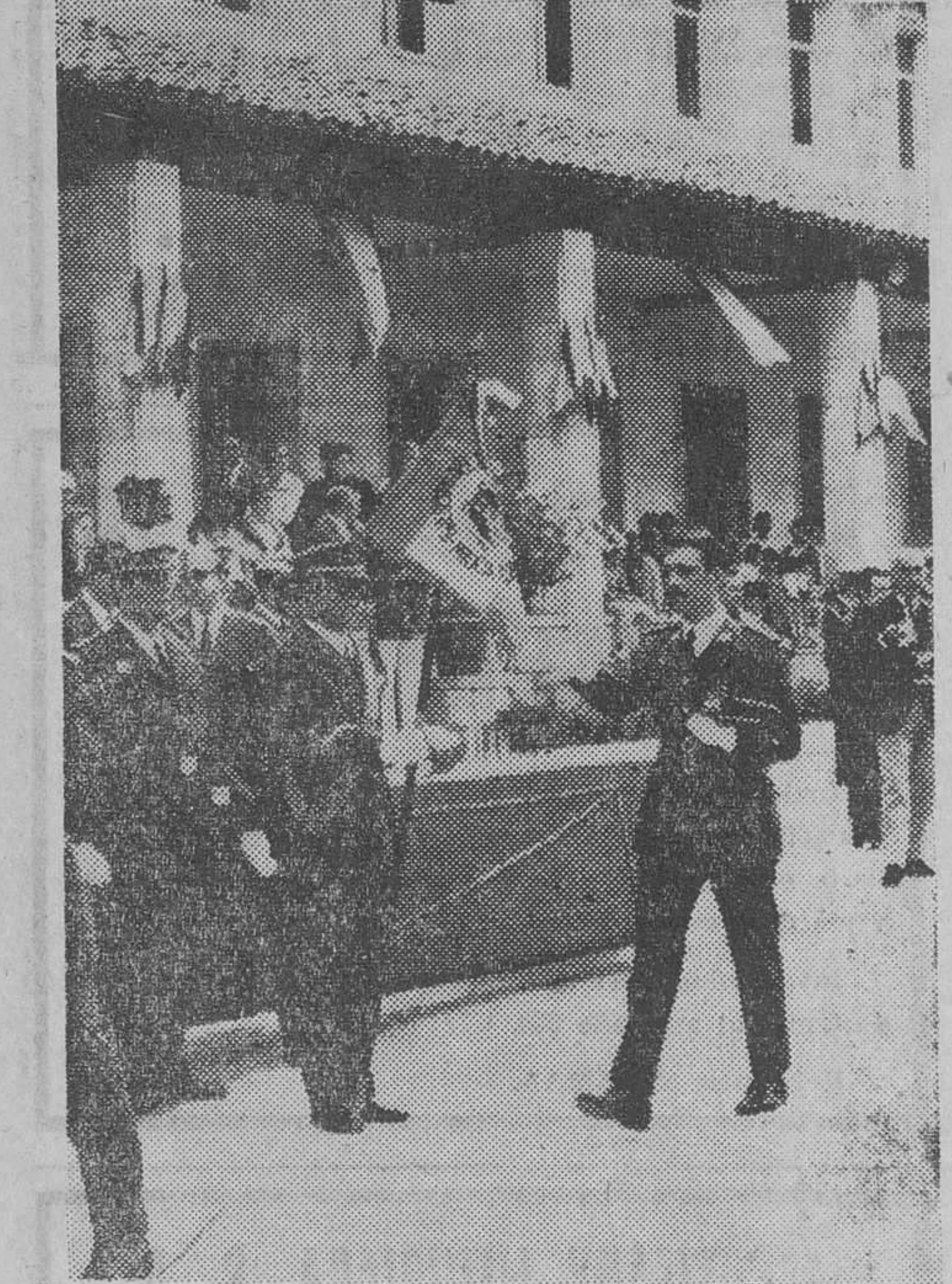
Un momento de la solemne ceremonia de despedida a la Bandera realizada por los alumnos de la XXIII promoción de la M. A. U.

AUTOMOBIA, S. A. - Ctra. Madrid. Km. 10. BURGOS