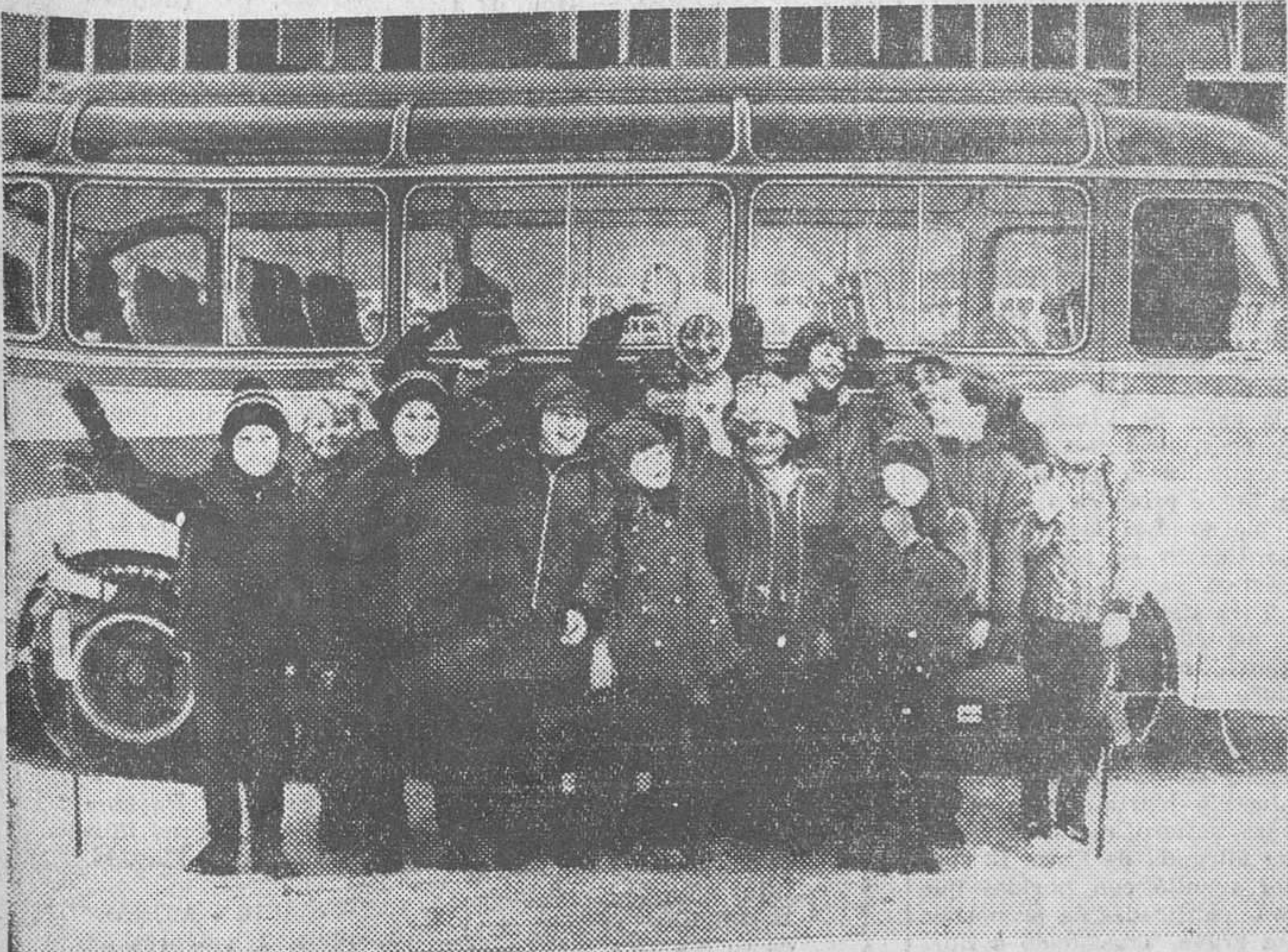
Con júbilo y una sonrisa en los labios estos 16 niños de la localidad alemana de Heimenegg salían al fotógrafo. Y es que realmente tienen motivo para ello. Diariamente tienen que recorrer 4,5 kilómetros para marchar a la escuela en la cercana localidad de Mindelheim. El trayecto lo hacían a pie o en bicicleta, incluso en los fríos días del invierno. Sus padres solicitaron un autobús, pero la petición no tuvo ningún éxito. Entonces los niños tomaron el asunto en sus propias manos y, decididos, se presentaron ante el alcalde. Dos días después, podían sentarse en los cómodos sillones de un pequeño autobús con calefacción.