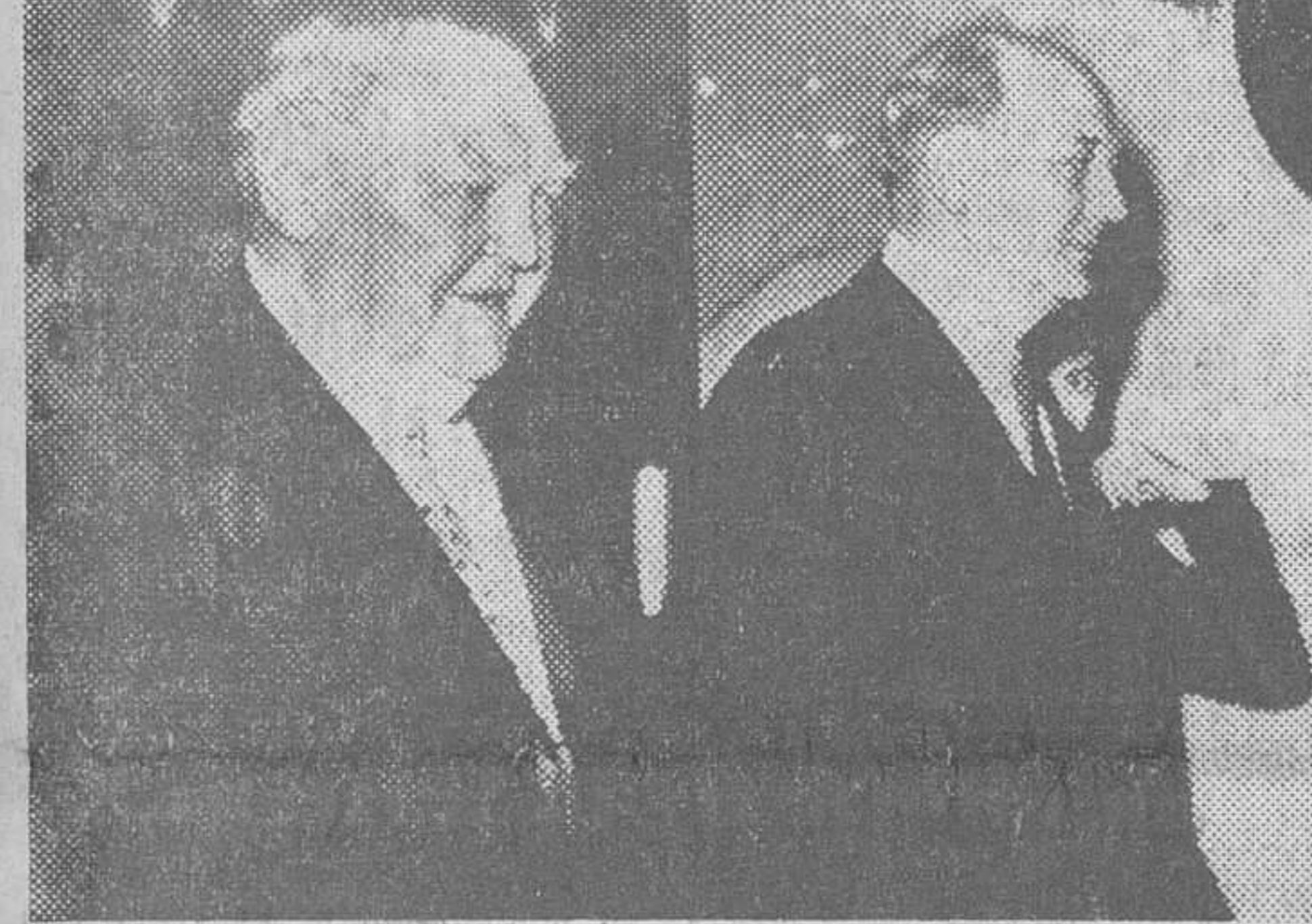
Washington. — Erhard y Johnson a la salida de una de las entrevistas celebradas por ambos estadistas.