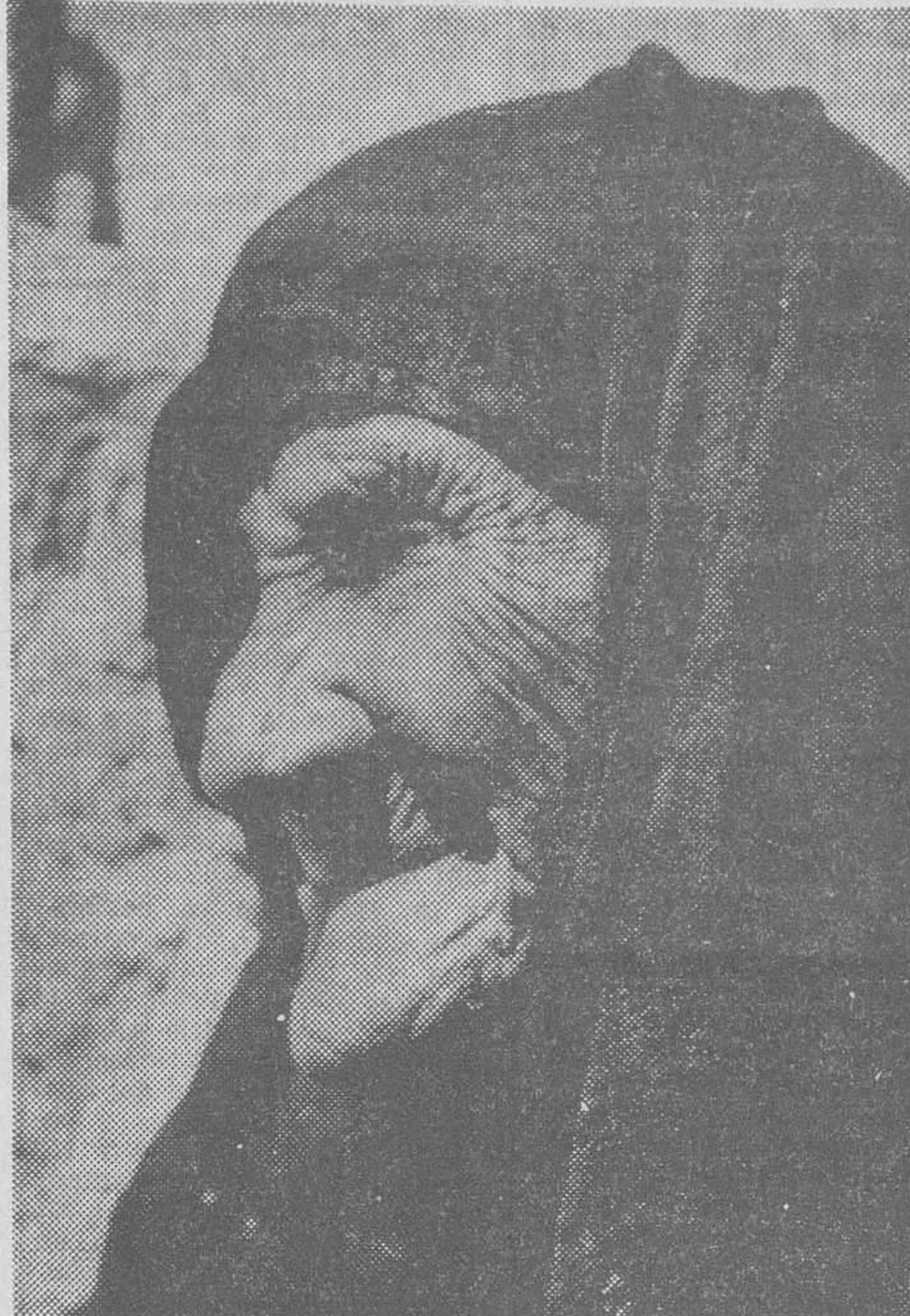
La anciana que muestra el grabado acaba de cumplir los 110 años. Pocas personas en nuestra era se acercan a estas edades, pero los sabios aseguran que para el año 2000, cien años de vida será la media de Humanidad.

Sea por causa de la cosmética, los institutos de belleza, los avances en dietética o vaya usted a saberlo, los hombres de Ciencia vienen observando que la mujer moderna envejece mucho más lentamente que sus madres y abuelas, pero también que el hombre, hasta hacer una realidad inconcretable el antiguo prejuicio de gozar de edad indeterminada. La conclusión se apoya como en la estadística que dice que el número de vidas aumenta por año a un ritmo de 1,5 por cada 10.000 matrimonios. Tal circunstancia unida a la independencia y emancipación, a las repetidas cesiones en el campo social que el hombre por su pasividad o cansancio secular va concediéndole por las buenas o por las malas, su mayor audacia, poder de conservación y dilatación y lozanía de los encantos juveniles, en opinión de los especialistas en gerontología que la mujer del futuro, aparte de escoger el hombre que más le plazca con determinadas imposiciones, por la misma autoridad que gozará al poder elegir, se ayuntará con