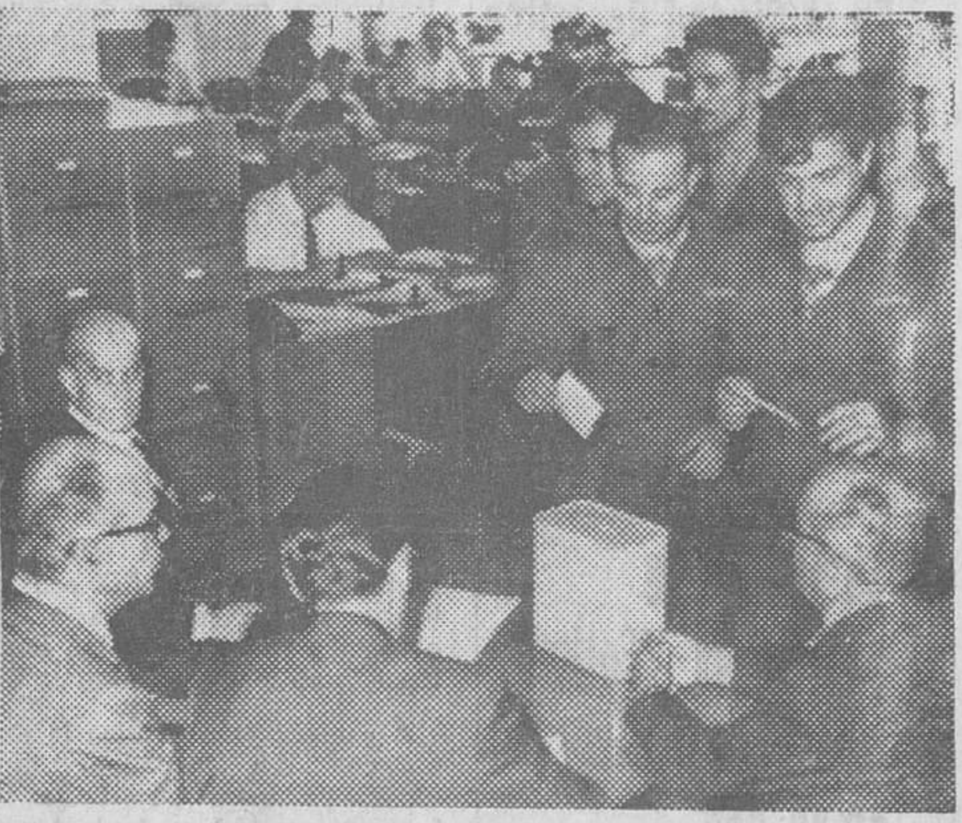
Barcelona. — Primeras elecciones sindicales en la Ciudad Condal. En la foto, un grupo de obreros de una importante fábrica de la ciudad en el momento de emitir su voto.