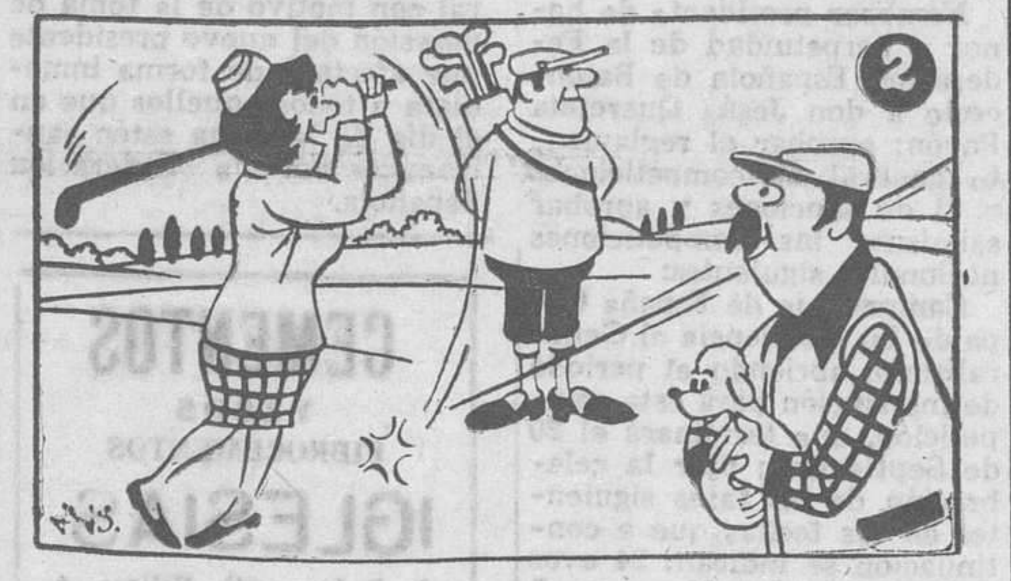
Estos dos dibujos son aparentemente iguales. Siete diferencias los separan. Si es usted buen observador debe descubrirlos antes de cinco minutos.