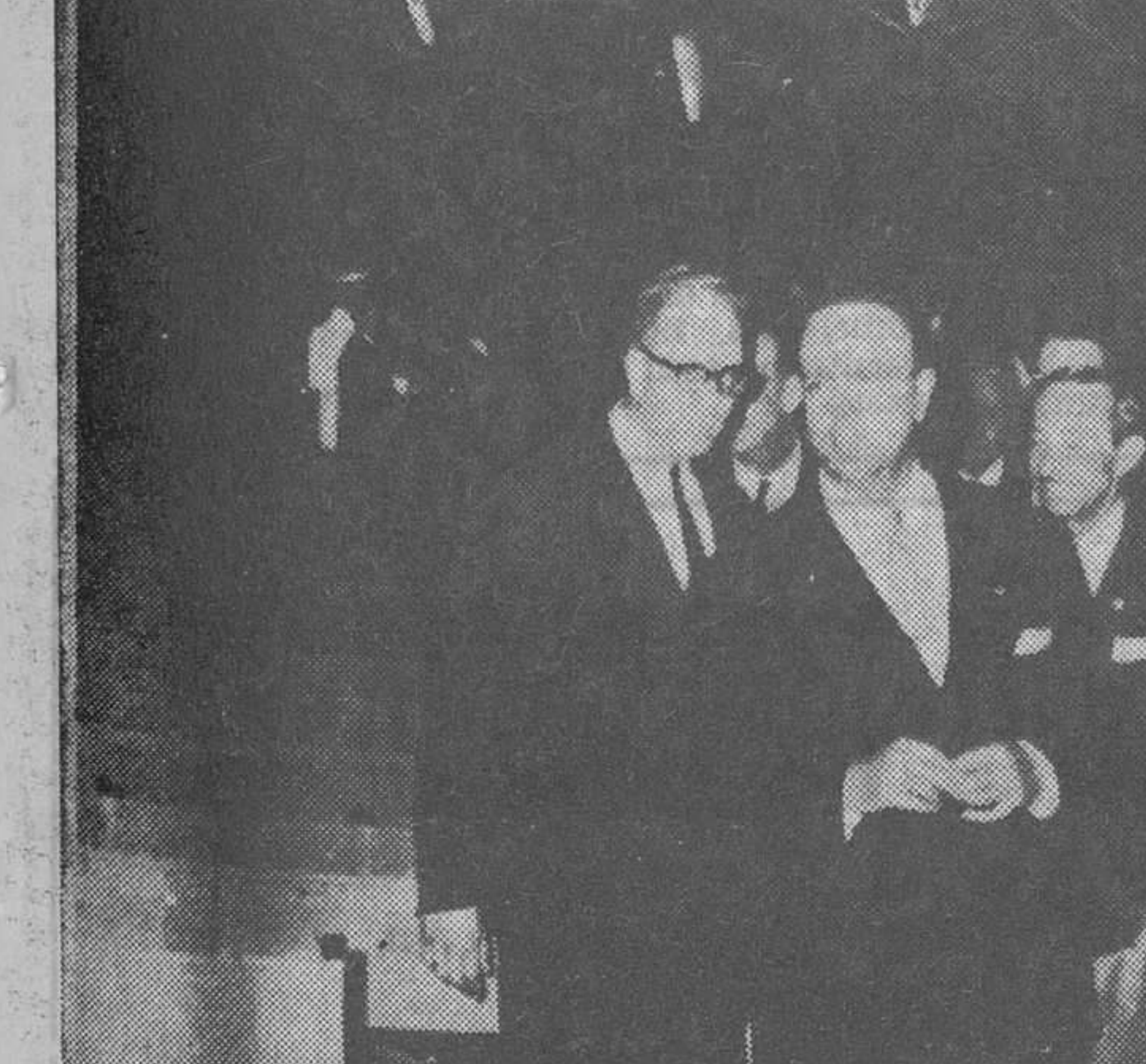
La Coruña. — El primer teatro desmontable que utilizará Festivales de España en sus actuaciones, capaz para mil ochocientas localidades y susceptible de ser instalado en pocas horas en cualquier punto del país, ha sido inaugurado por el ministro de Información y Turismo, don Manuel Fraga Iribarne. En la foto, un momento del acto inaugural.