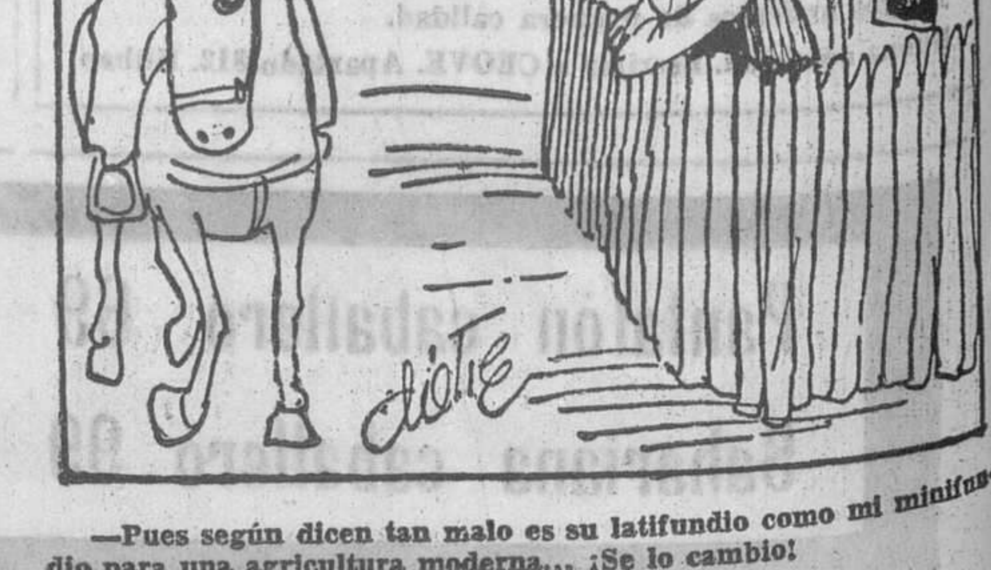
—Pues según dicen tan malo es su latifundio como mi minifundio para una agricultura moderna... ¡Se lo cambio!