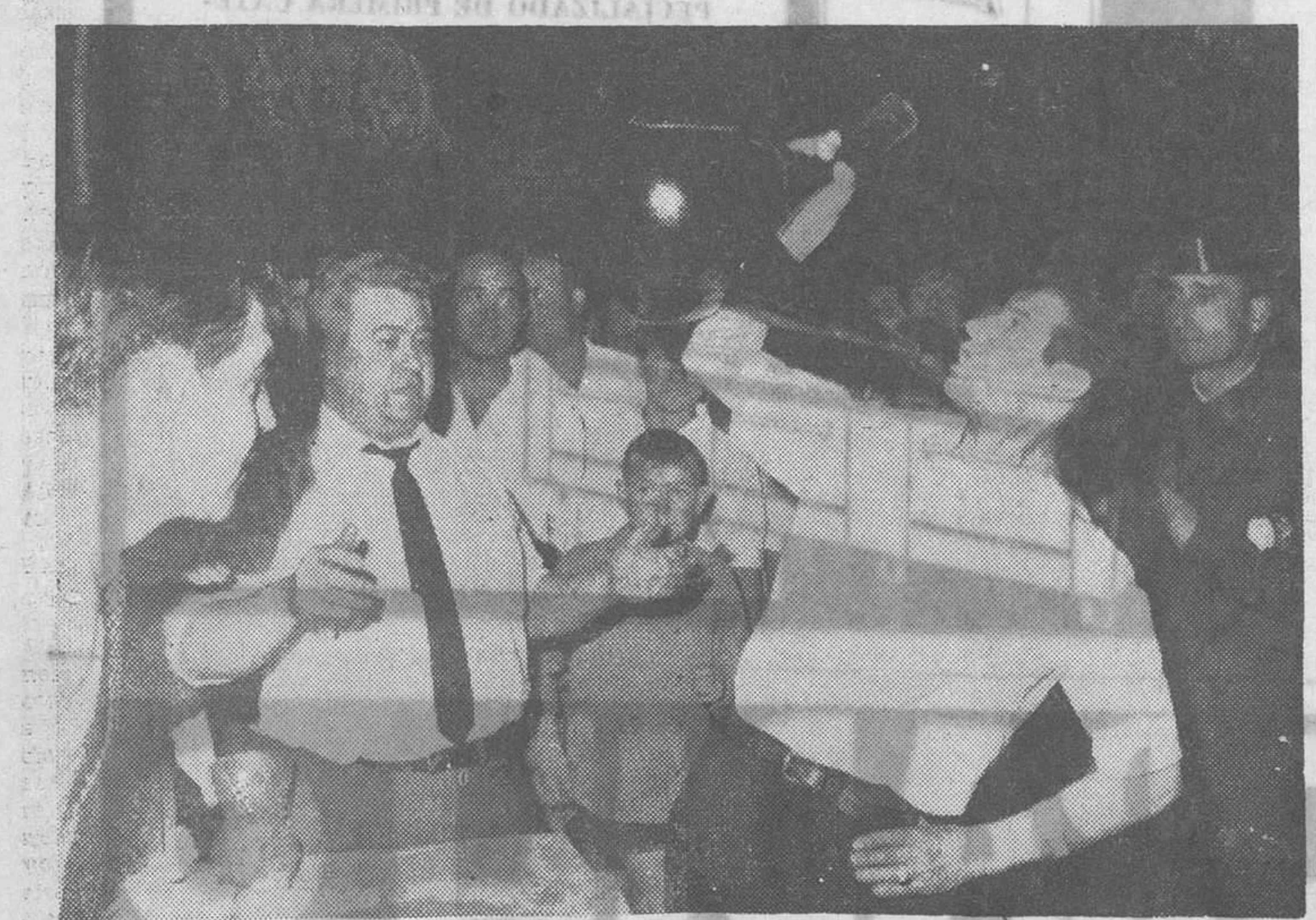
Con motivo de las fiestas patronales que se celebran estos días en la madrileña barriada de Extremadura, ha tenido lugar un simpático concurso: bebedores de vino en porrón. Hay que hacer constar que los participantes tenían una capacidad de diez litros. La competición, que fue seguida con gran interés por numeroso público, consistía en ingerir la mayor cantidad de líquido en un solo trago sin derramar nada. En la foto vemos a uno de los concursantes.