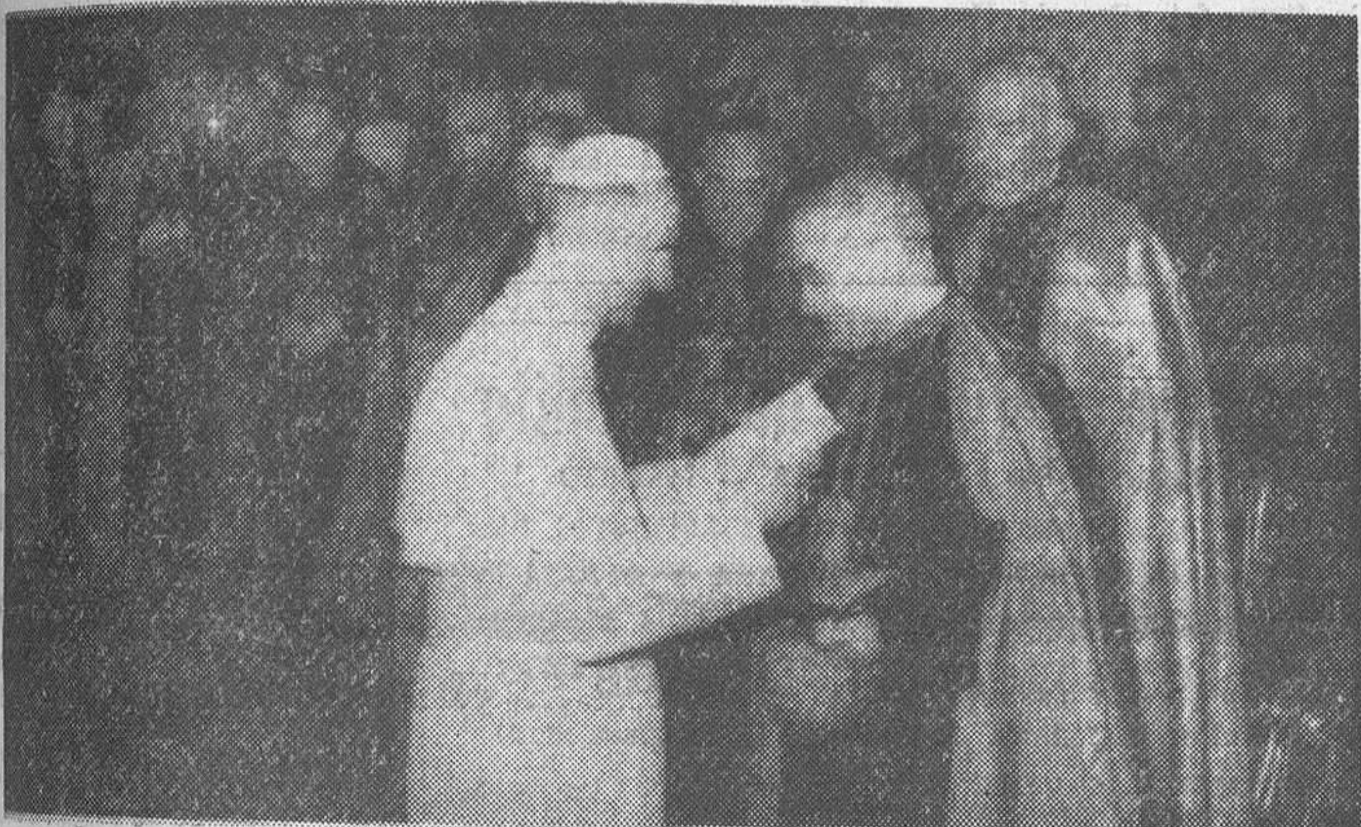
Ciudad del Vaticano. — Su Santidad Paulo IV, recibe en audiencia especial a los Cardenales españoles Arriba y Castro, Bueno Monreal y Quiroga Palacios que se encuentran en Roma, para asistir a las sesiones del Concilio Euménico.