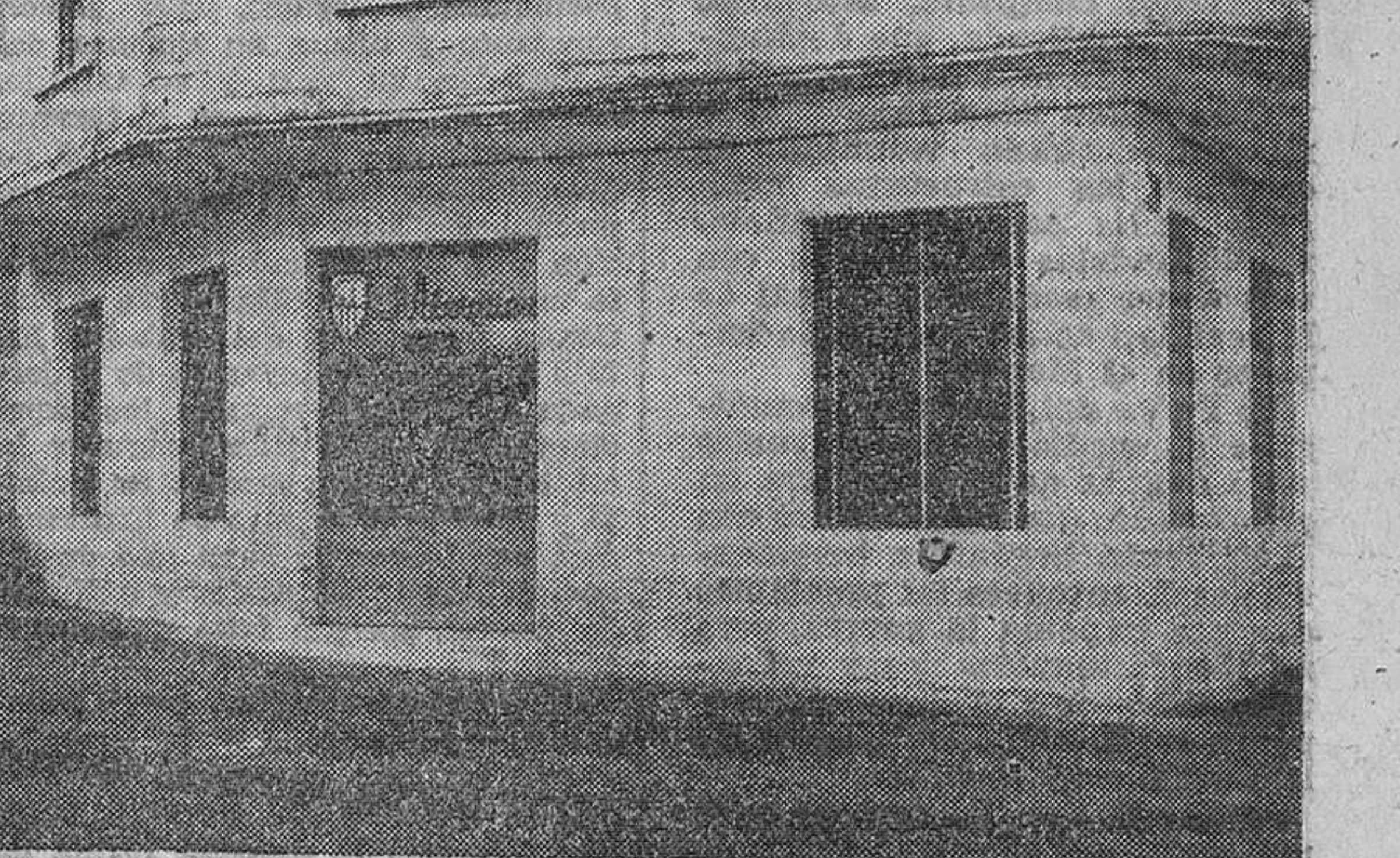
VISTA GENERAL DEL EXTERIOR DE LAS OFICINAS DEL SERVICIO DE CARGAS COMPLETAS MINGUEZ