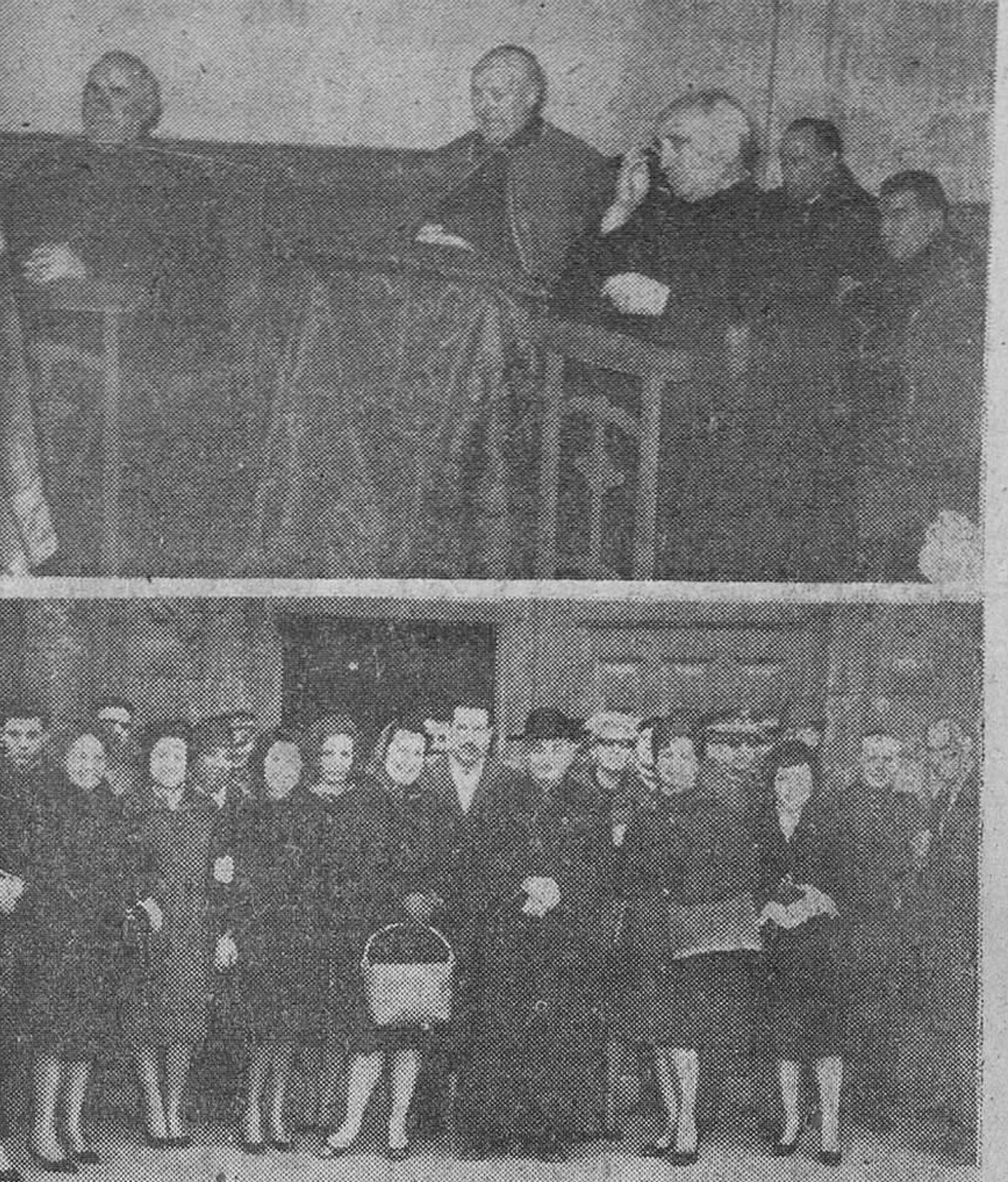
Según es tradicional, la festividad del insigne burgalés San Julián, obispo, se conmemoró en nuestra ciudad con diversos actos, de que damos cuenta en páginas interiores y a que se refieren las precedentes páginas. En primera, aparece nuestro Rvdo. Prelado, presidiendo la solemne misa celebrada en la Iglesia de San Julián y San Quirre (Barrantes). En la segunda figura un grupo de congresos a la salida de la ceremonia con que la Colonia honró a su Santo Patrón, en la iglesia de San Cosme.