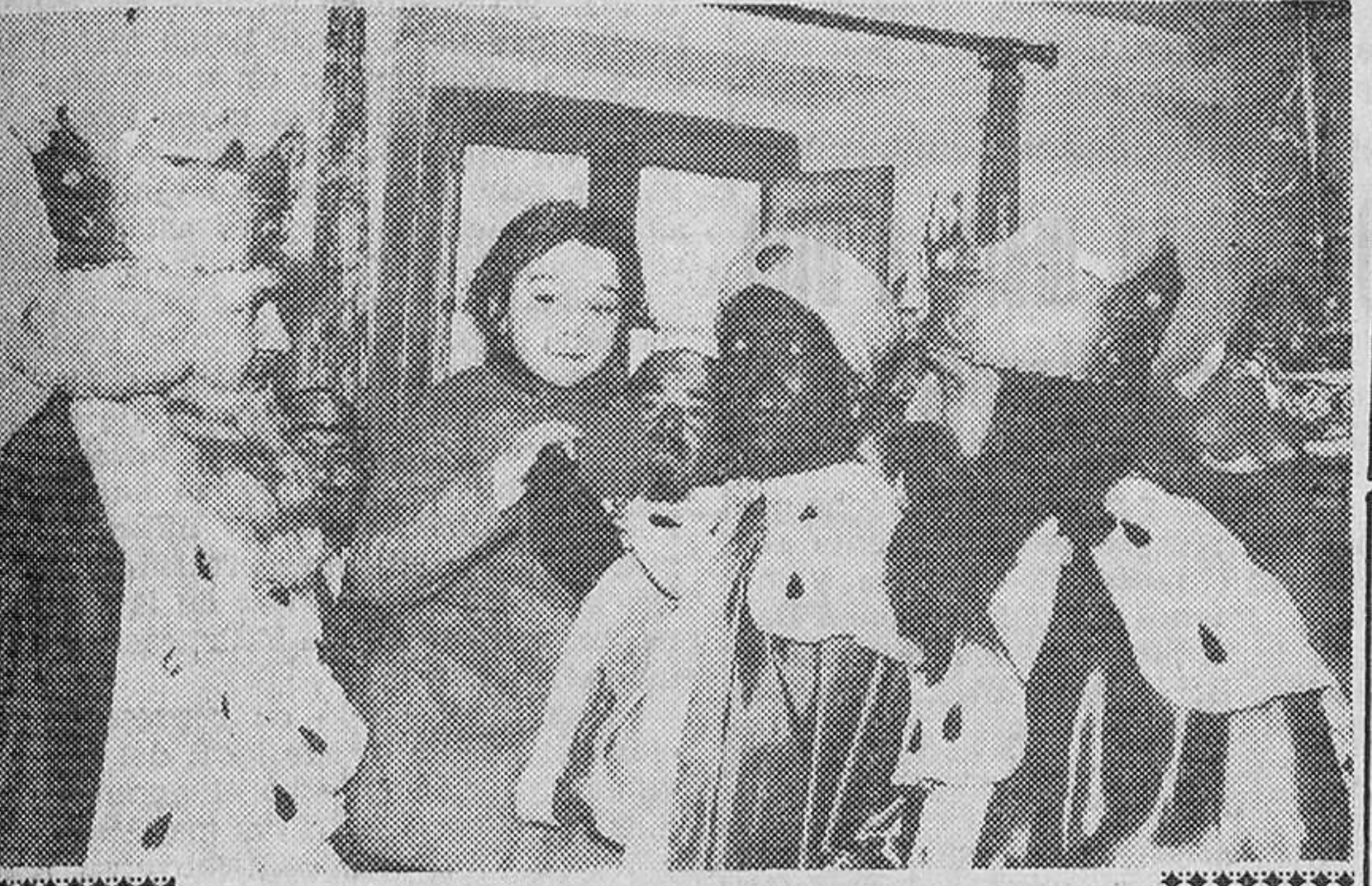
Los Reyes Magos de la Cabalgata de Cáritas a su paso por Padilla. Abren la marcha una niña enferma. Esta pequeña, al no poder salir de casa por el paso de la Cabalgata, pidió a los Reyes que se acercaran a visitarla.